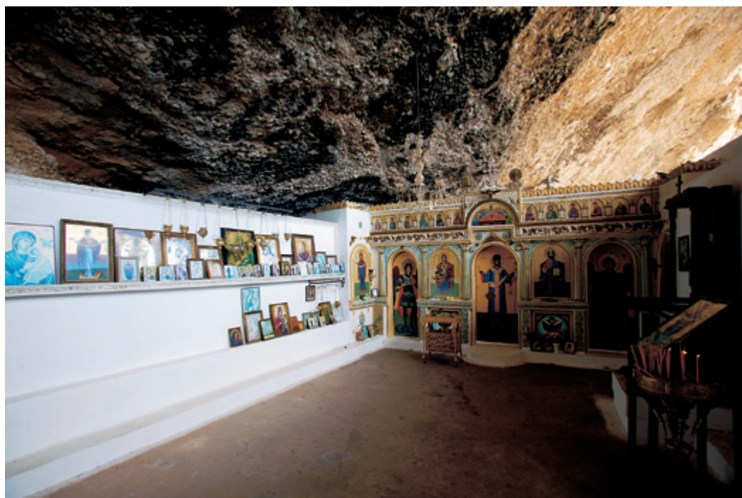
Το εξωκκλήσι της "Παναγίας στο Βράχο", στις θεαματικές πλαγιές του φαραγγιού του Ερύμανθου.

Μεγαλειώδεις βραχώδεις σχηματισμοί ορθώνονται σε πολλά σημεία του Φαραγγιού του Ερύμανθου. (δεξιά)