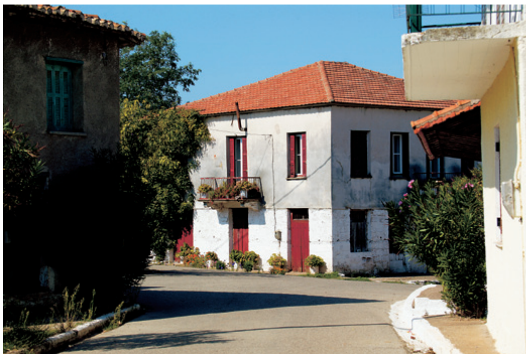
Ωραίο σπίτι στο Δούκα που έχει απομείνει με ελάχιστους κατοίκους. Παλιά καμάρια που έχει διασωθεί δίπλα σε σπίτι του Λάλα.