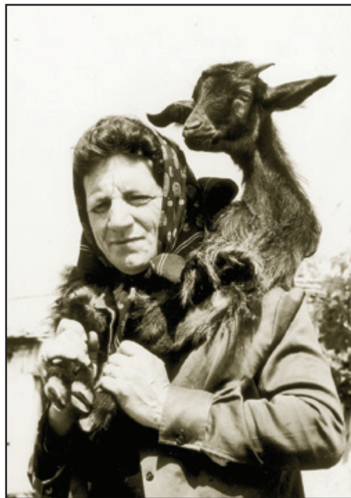
OLYMPIA PRESS / Γ. Σ. ΚΟΣΜΟΠΟΥΛΟΣ