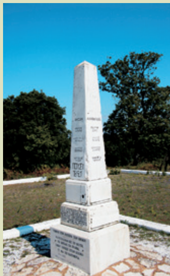
Το Ηρώο στο Πούσι, ενθύμιο της μεγάλης μάχης του Ιουνίου του 1821.

Ένα σημαντικό τμήμα του δάσους έχει ήδη υπαχθεί στο δίκτυο NATURA 2000, ενώ είναι υπό σύνταξη ειδική Περιβαλλοντική Μελέτη από την Ηλειακή Αναπτυξιακή