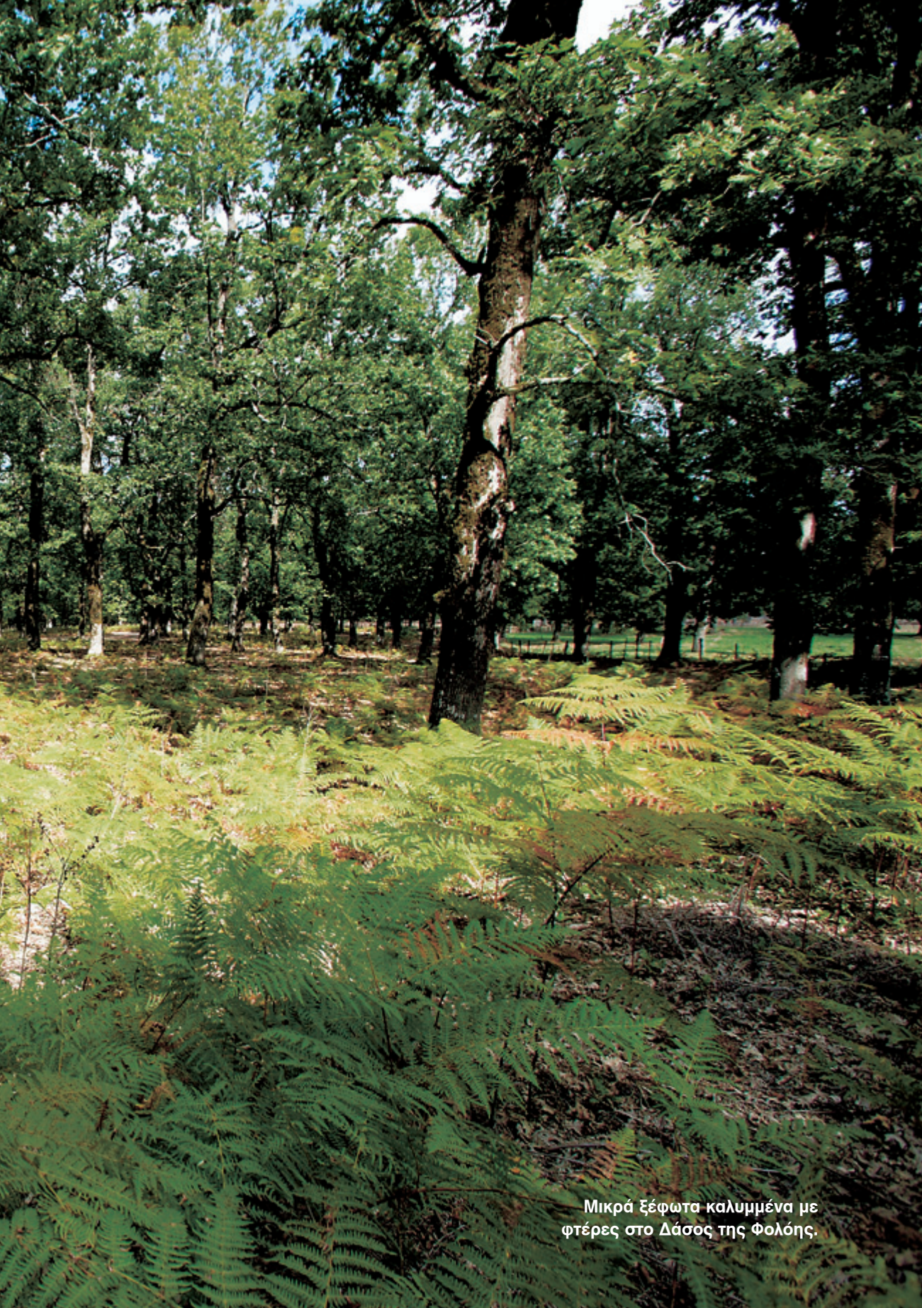
Μικρά ξέφωτα καλυμμένα με φτέρρες στο Δάσος της Φολόης.