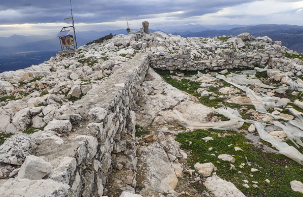
Τα καλύτερα διατηρημένα υπολείμματα φρυκτωρίας στο όρος Αραχναίο της Αργολίδας.

που έγιναν στην Κρήτη έφεραν στο φως συστήματα άμυνας κι επικοινωνίας της Μινωικής εποχής. Δυο νέες φρυκτωρίες ανακαλύφθηκαν το 2016 στην ανατολική Κρήτη και μάλιστα στο νησί Ψείρα , ένα νησί που θεωρείται θησαυρός για τους αρχαιολόγους όλου του κόσμου.