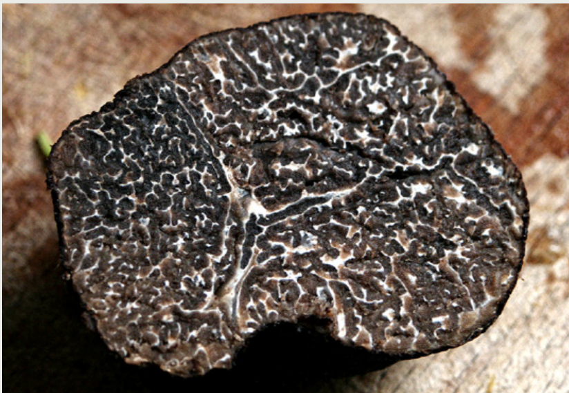
Μαύρη τρούφα