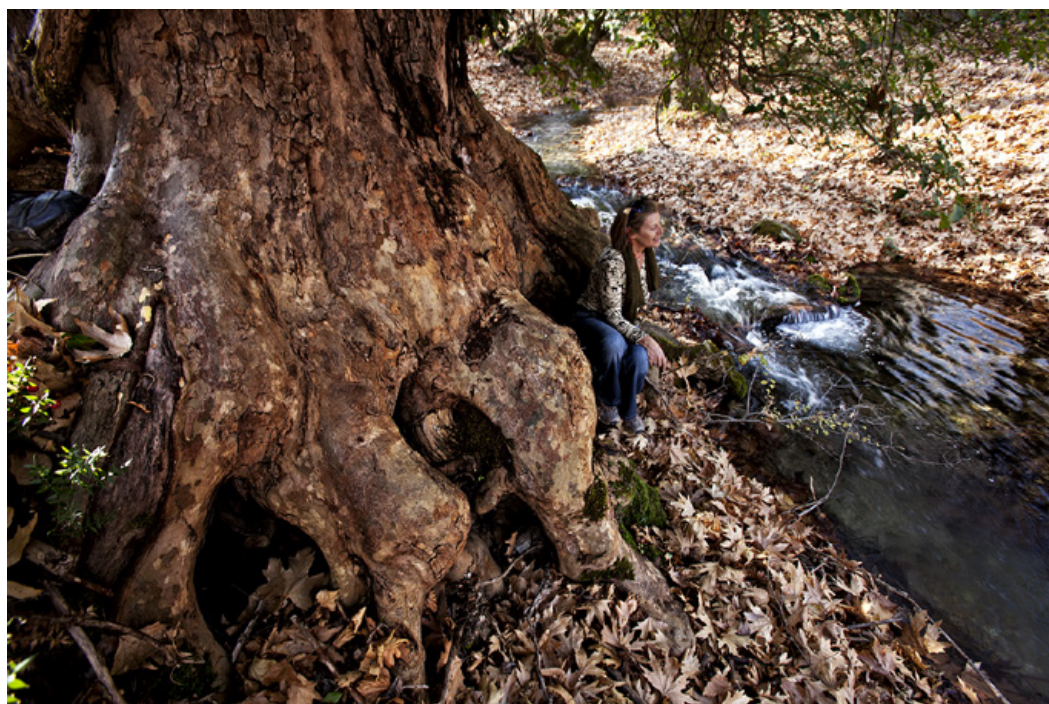
Η Εύχαρις δίπλα στα κρυστάλλινα νερά του Αροάνιου ποταμού.

μας έχουμε μόνιμα την στενή κοίτη μιας μικρής ρεματιάς. Πιο πίσω διακρίνουμε ανάμεσα στα κλαδιά των πεύκων, γαλάζια κομμάτια της λίμνης Δόξας.