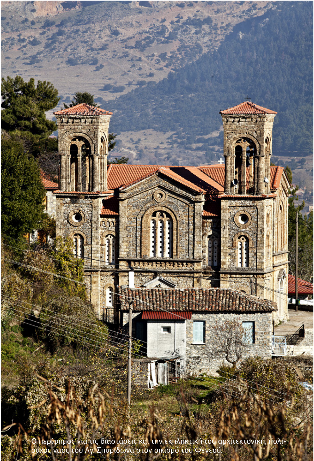
Ο περίφημος για τις διαστάσεις και την εκπληκτική του αρχιτεκτονική, πολυούχος ναός του Αγ. Σπυριδώνα στον οικισμό του Φενεού.