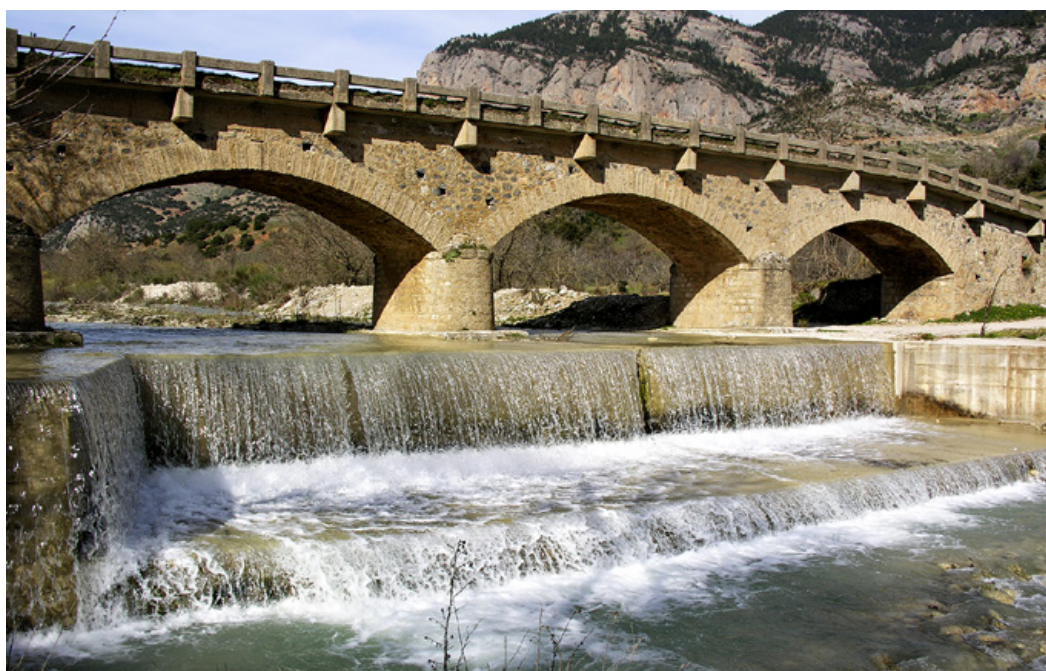
Το περίφημο τετράτοξο γεφύρι του Όλβιου πριν από το Στενό.

-Απ' το νότιο άκρο, το πιο μακρινό και αθέ- ατο -ακόμα- μέσα στην ομίχλη. Θέλουμε, επιτέλους, να γνωρίσουμε τις περίφημες Καταβόθρες.