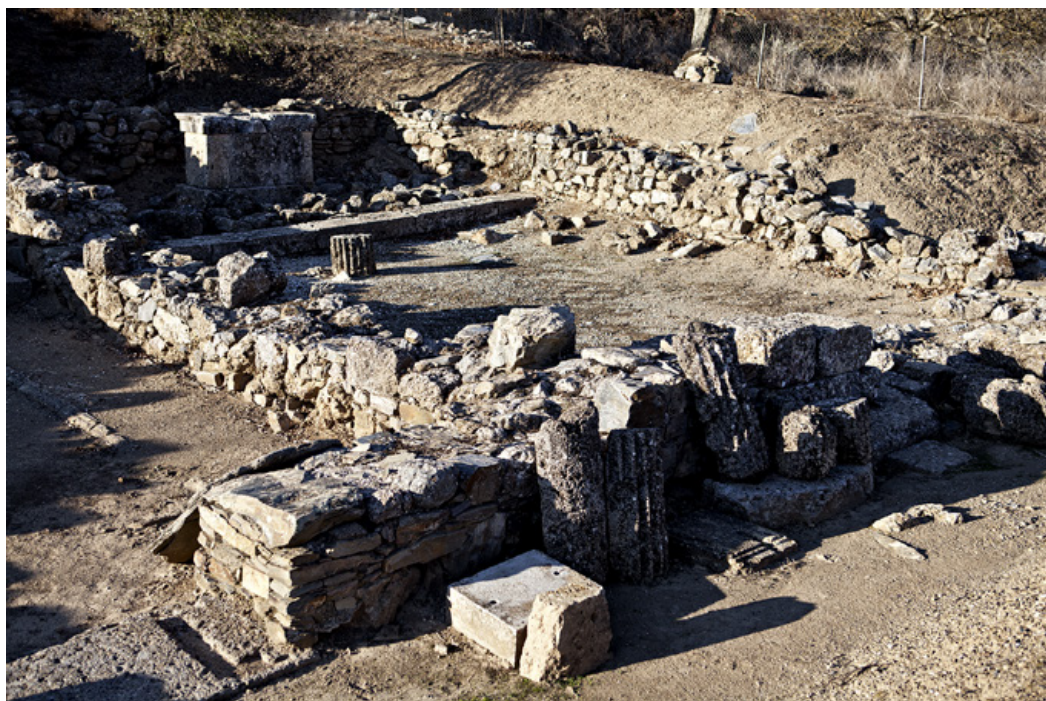
Άποψη από τον αρχαιολογικό χώρο της Αρχαίας Φενεού.

Φενεού. Εδώ διενεργήθηκαν ανασκαφές από την έφορο Ε. Δειλάκη κατά τα έτη 1958, 1959 και 1961, που αποκάλυψαν ιερό του Ασκληπιού. Ανάμεσα στα άλλα ευρήματα βρέθηκαν και δυο πελώρια μαρμάρινα πόδια με σανδάλια, καθώς και το κεφάλι με τα ζωηρά ένθετα μάτια, του υπερμεγέθους αγάλματος της Υγείας. Το σημαντικό αυτό κατά τον 2 ο π.Χ. αιώνα ιερό, είναι άγνωστο στον Πausανία, ίσως γιατί σε μια από τις εμφοράξεις των καταβοθρών κατακλύστηκε από τα νερά και αργότερα τα ερείπιά του έμειναν επικωσμένα από τη λάσπη. (9)