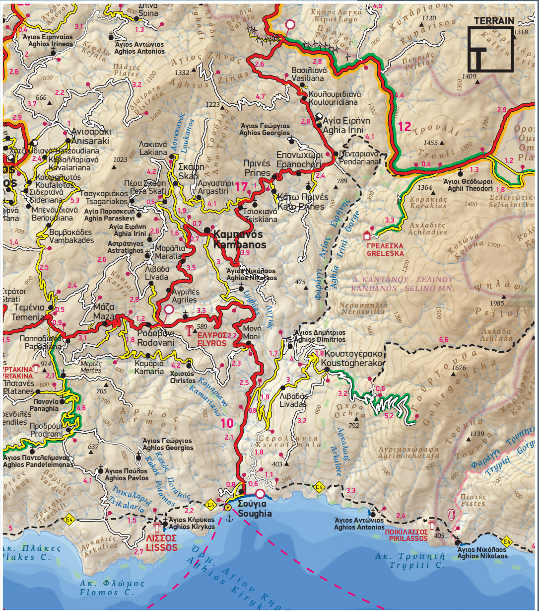
Τμήμα από τον χάρτη Δυτική Κρήτη 1 100 000 των εκδόσεων TERRAIN. www.terrain.gr