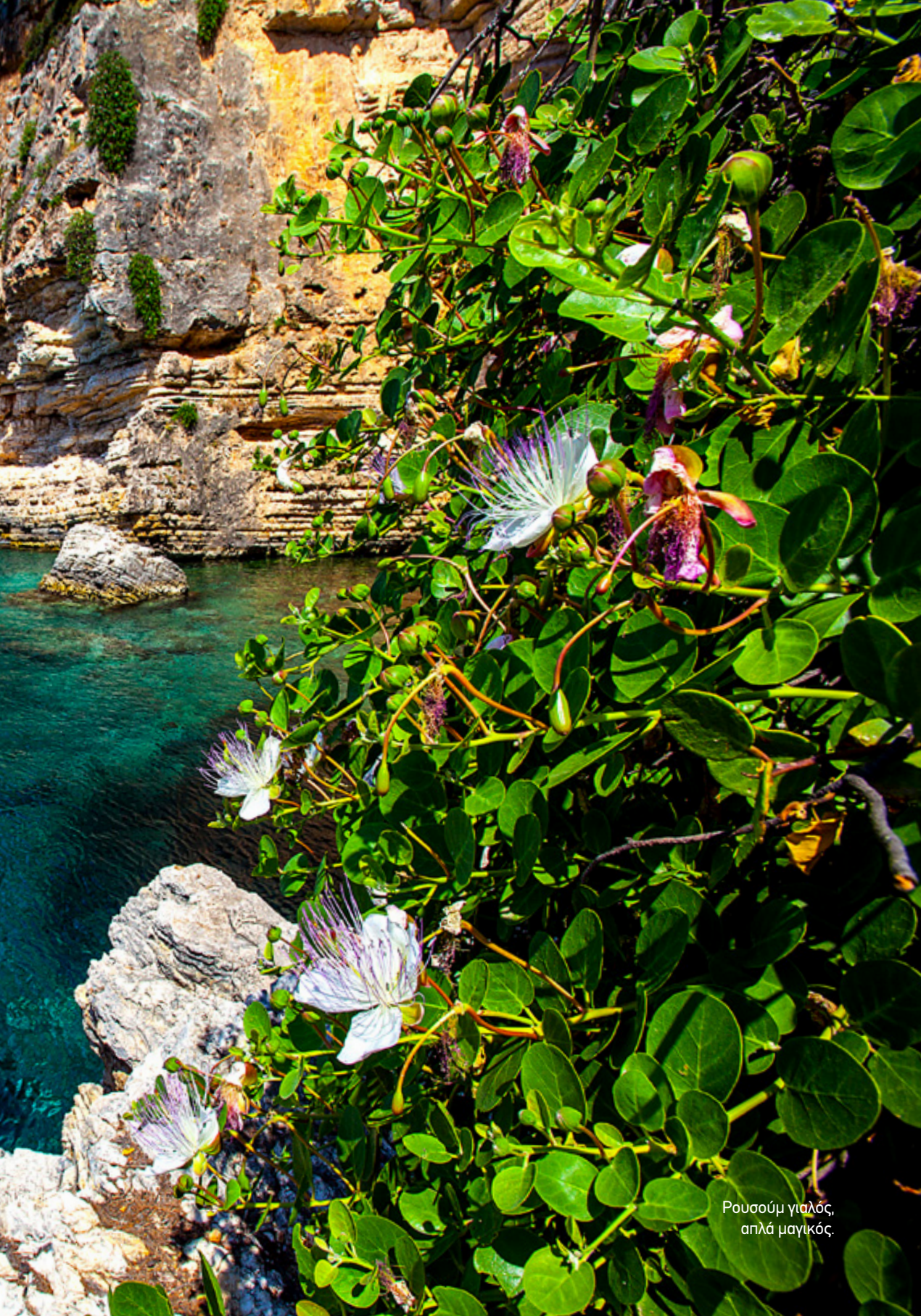
Ρουσόμ γιαλός, απλά μαγικός.