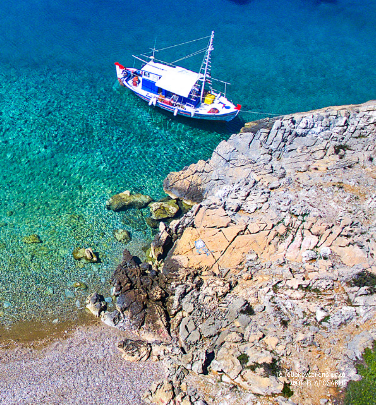
Το Τούρκονέρι από ψηλά.

οι Τούρκοι), είναι μια μικρή βοτσαλιά, πίσω από την οποία και μετά την ανατολική βραχώδη ακτογραμμή εμφανίζονται δυο άλλες μικρές αμμουδερές λεκάνες. Υπάρχει ξύλινο κιόσκι. Ο δρόμος που φτάνει ως εδώ συνεχίζει ανηφορίζοντας ως την άκρη του δασικού συμπλέγματος,