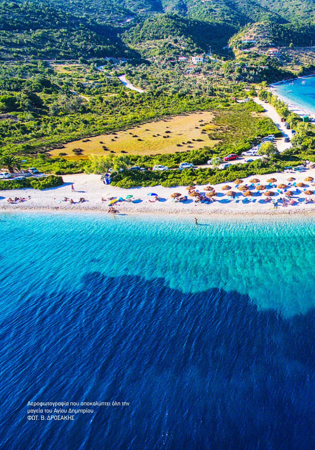
Αεροφωτογραφία που αποκαλύπτει όλη την μαγεία του Αγίου Δημητρίου.