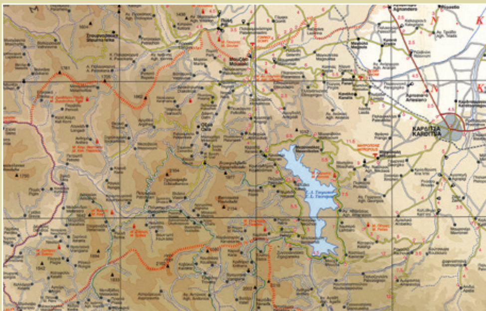
Τμήμα από τον χάρτη "Ήπειρος-Θεσσαλία" 1:250.000 των Road Editions

Κωδικός κλήσης: 24450 Τηλ. Δημαρχείου: 31202, 31120