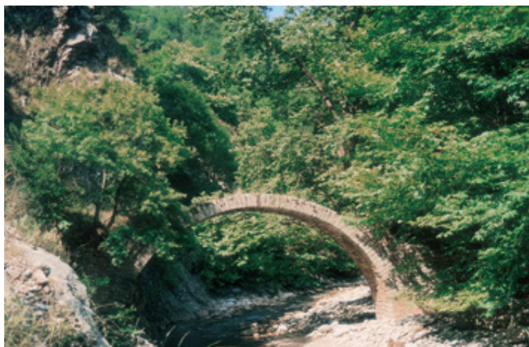
Η Γέφυρα Ελληνικών Αργιθέας - Κοθωνίου. Χτίστηκε το 1241 μ.Χ.

τριος και Χωριό . Με υψόμετρο 634 μ. στην εκκλησία του Αγ. Νικολάου, το Χωριό αποτελεί το κέντρο του οικισμού με θέα εξαιρετική. Διατηρούνται αρκετά πέτρινα σπίτια, αυλές με λουλούδια και λαχανικά, δύο καφενεία-ταβερνάκια. Η παλιά ονομασία του χωριού ήταν Διάσκοβο . Το 1928 γνώρισε την μέγιστη πληθυσμιακή ακμή με 522 κατοίκους. Από τότε η πορεία είναι φθίνουσα και ιδιαίτερα μετά τις κατολισθήσεις του 1975, οπότε πολλοί κάτοικοι έφυγαν κυρίως στην Αθήνα. Σήμερα μένουν μόνιμα περίπου 40. Το Δημοτικό Σχολείο που ξαναλειτούργησε μετά από 21 χρόνια έχει 4 παιδιά, ενώ μερικές