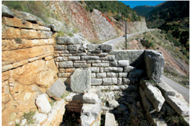
Το περίφημο ταφικό μνημείο με τους λαξευτούς λίθους στη θέση "Ελληνικά".

Σ' ένα λεπτό στρίβουμε αριστερά για Μεσοβούνι. Τις όχθες του μικρού ποταμού συνδέει ένα μονότοξο γεφυράκι, που