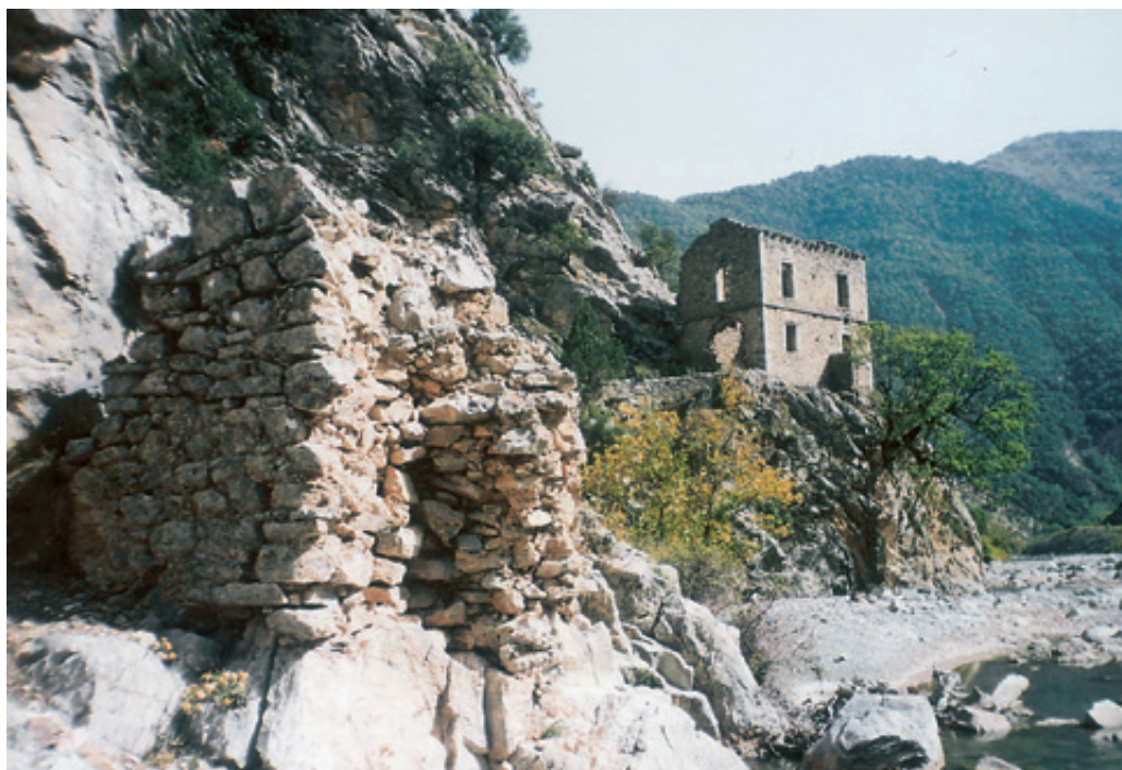
Το πόντι της γέφυρας Κοράκου από τη μεριά της Συκιάς Αργιθέας. Πίσω η Κούλια επιβλητική, μόνο κουφάρι κι αυτή.

του βιβλίου (εκδ. 1999) "το όλο έργο προβλέπεται να κατασκευασθεί μέσα σε 48 μήνες, ήτοι το 2001 θα είναι έτοιμο". Για άλλη μια φορά αποδείχθηκε πόσο ουτοπικές είναι οι προβλέψεις στην Ελλάδα. Σήμερα, τέλος του 2005, οι εργασίες συνεχίζονται, τα φορτηγά πηγαυοέρχονται ασταμάτητα.