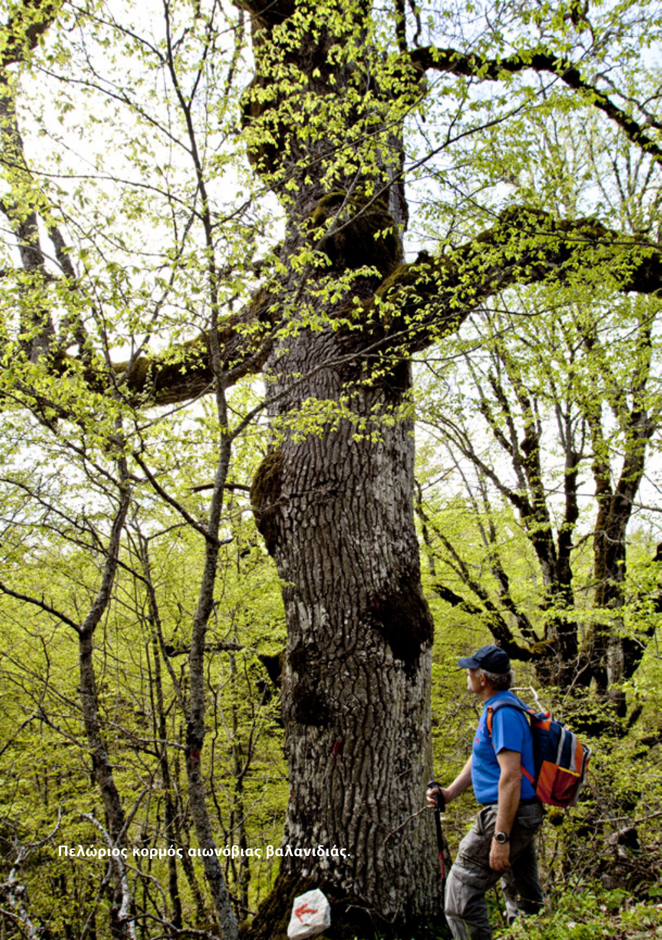
Πελώριος κορμός αιωνόβιας βάλανιδιάς.