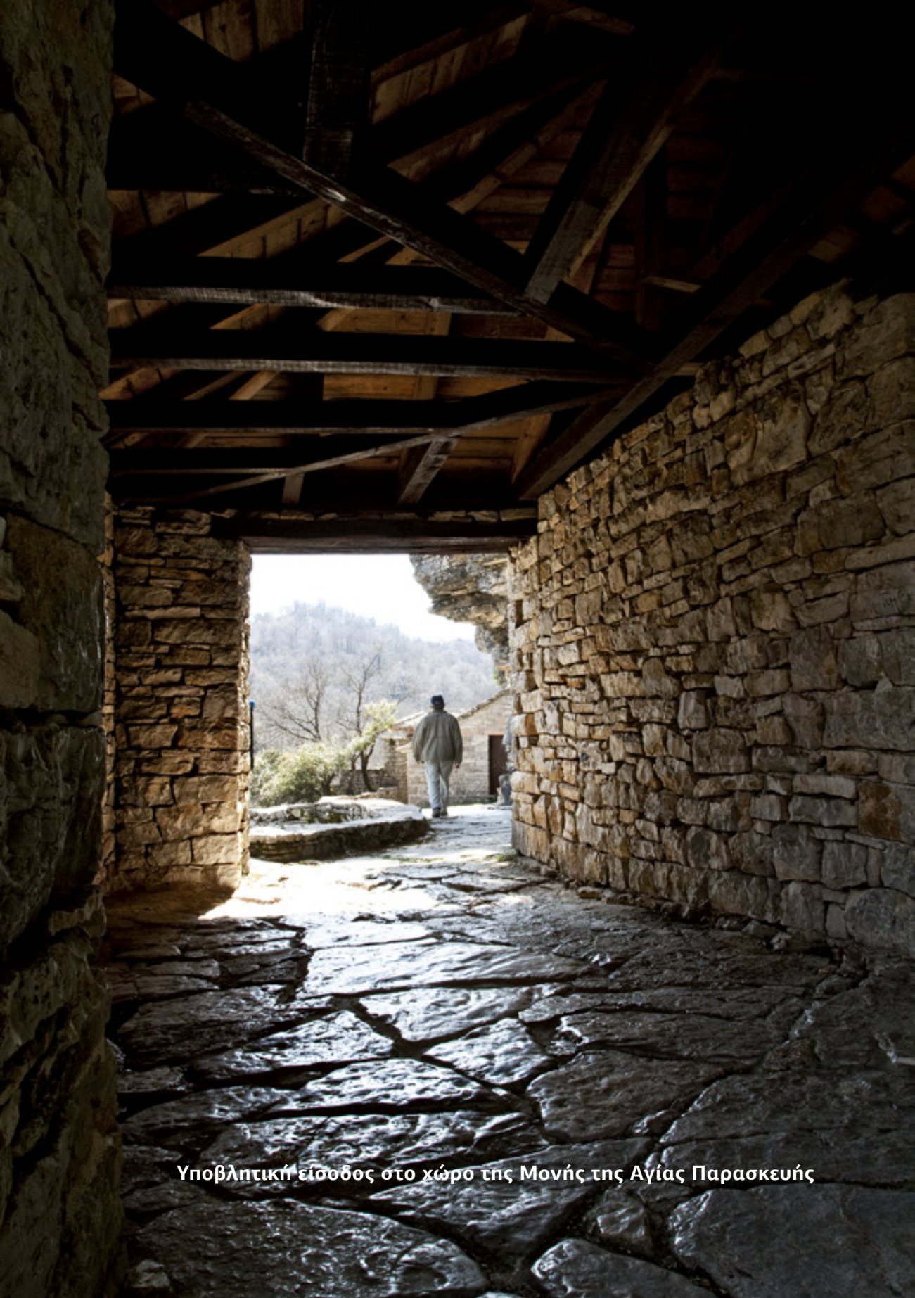
Υποβλητική είσοδος στο χώρο της Μονής της Αγίας Παρασκευής