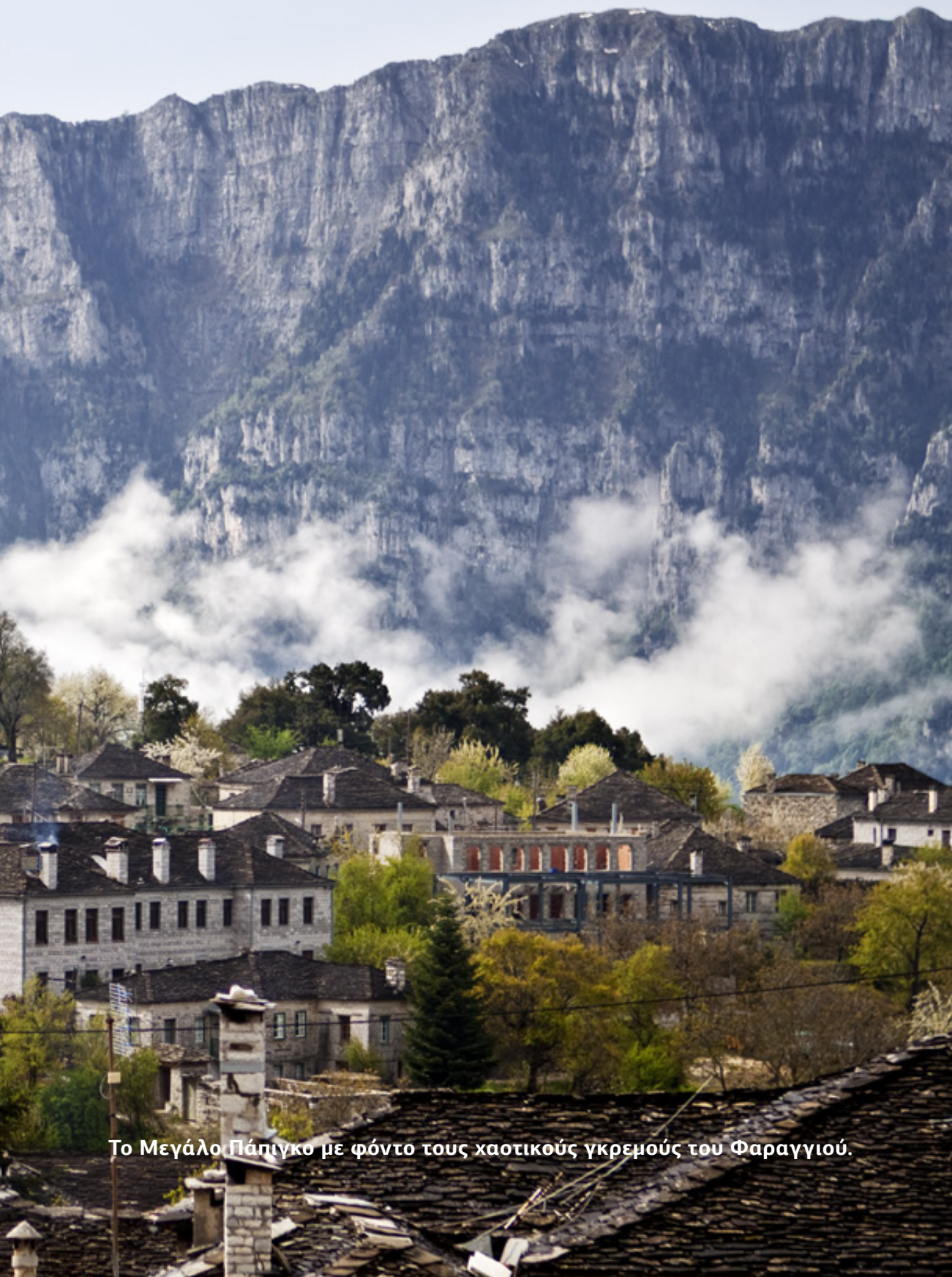
Το Μεγάλο Πάπιγκο με φόντο τους χαστικούς γκρεμούς του Φαραγγιού.