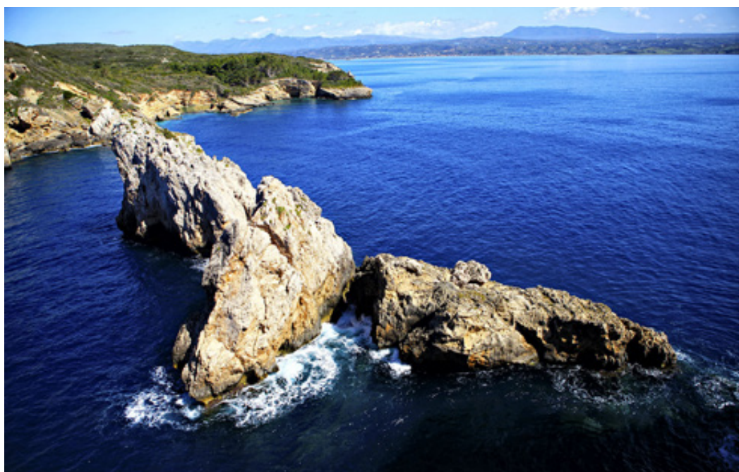
Οι άγιες "Κουτσούνες" ανάμεσα στο "Τσιχλή-Μηριά" και την Σφακτηρία, όπου και ο περίφημος "Δίαυλος του Άρη".

βορειότερα, ο συμπαγής όγκος σχηματίζει ένα στενό, διαμπερές άνοιγμα στην ανοιχτωσιά του Ιονίου.