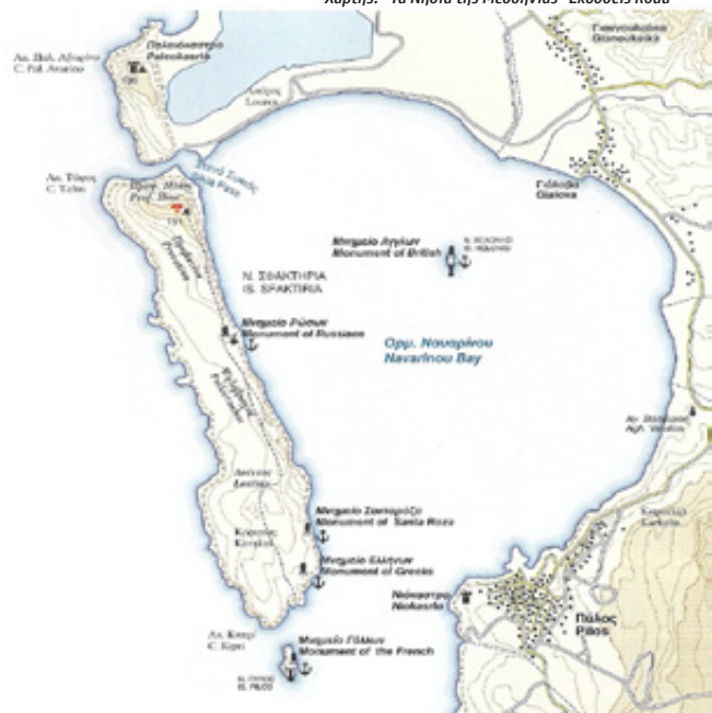
Χάρτης: "Τα Νησιά της Μεσσηνίας" Εκδόσεις Road