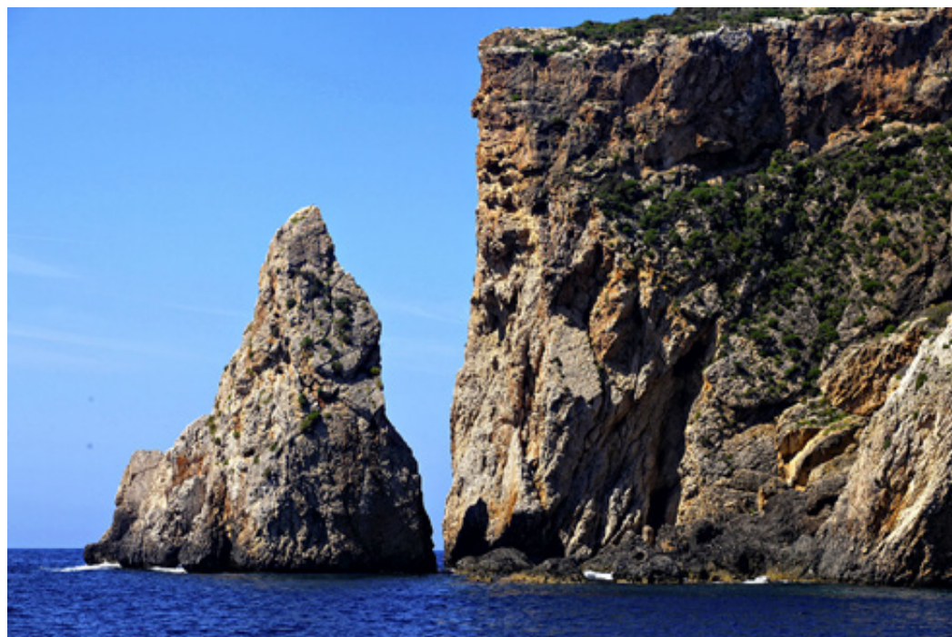
Το απόκρημο και τελείως βραχώδες νότιο άκρο της Σφακτηρίας.

Απέναντι: το εντυπωσιακό Μνημείο του Σανταρόζα.