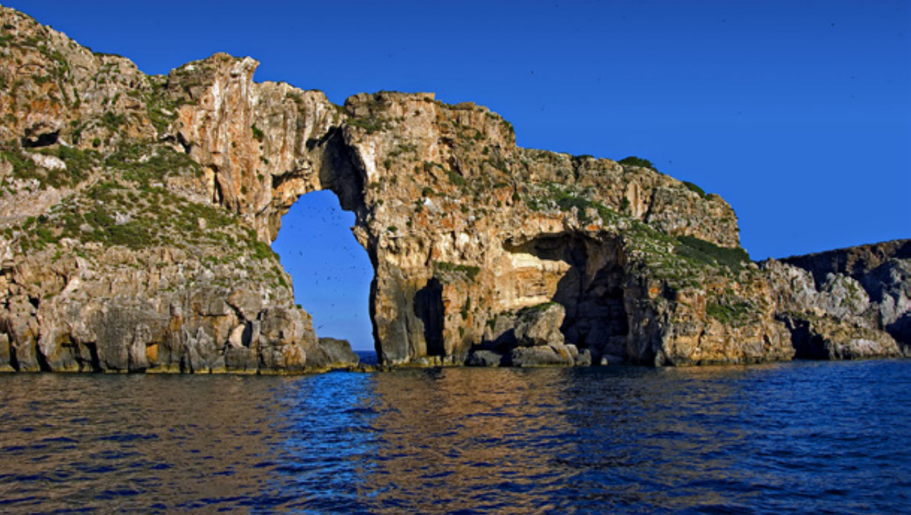
Ένα παράθυρο στο Ιόνιο. Το εντυπωσιακό άνοιγμα στους βράχους του Τσιχλή-Μπαμπά, του πρόσθεσε το όνομα "Τρυπητό".