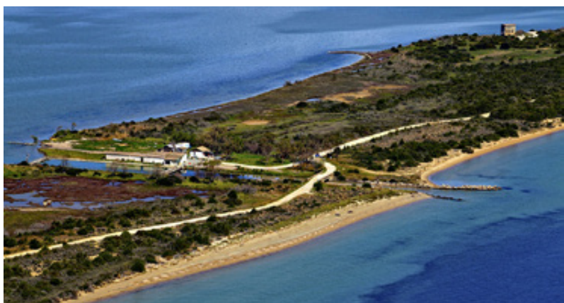
Το απέρητο Μνημείο των Άγγλων στο "Χελωνάκι". Οι αεροφωτογραφίες απεικονίζουν με εντυπωσιακό τρόπο την μορφολογία της περιοχής: Δίαυλος Συκιάς, αμμουδερή παραλία Ναβαρίνου, το Διβάρι που είναι ο υδάτινος σύνδεσμος της θάλασσας του Ναβαρίνου και της λιμνοθάλασσας της Γιάλοβας.