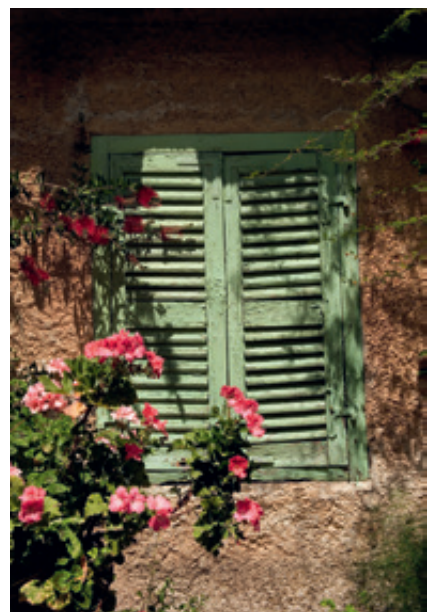
Χαμογελαστές εικόνες της ζωής στο Θιάκι: απλή, αμέριμη και στενά συνδεδεμένη με τα στοιχεία της φύσης.

κά σπίτια του ορεινού οικισμού της νότιας Ιθάκης, του Περαχωριού , είναι μαζεμένα σαν κοπάδι από πρόβατα.