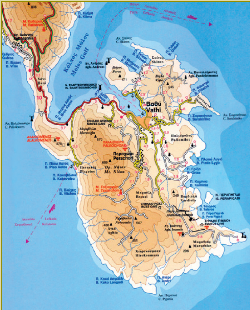
Από το χάρτη ΚΕΦΑΛΟΝΙΑ - ΙΘΑΚΗ κλίμακα 1:70.000 των Road Editions.

Δημαρχείο: Τηλ. 26740-32795, 26740-23911, 26740-33481 Ναυτικό Λαογραφικό Μουσείο: Τηλ. 26740-33398