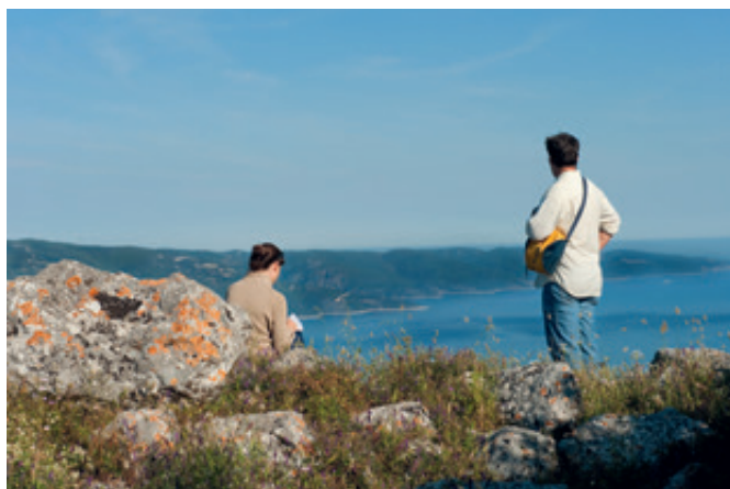
Δείγμα κυκλώπειας κατασκευής στις Αλαλκομενές, όπου εικάζεται πως βρισκόταν το «Ομηρικό Άστυ».