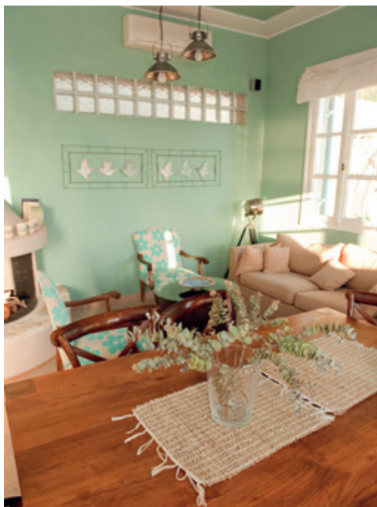
Η όμορφη Αγράμπελη, φτιαγμένη με γούστο και μεράκι.