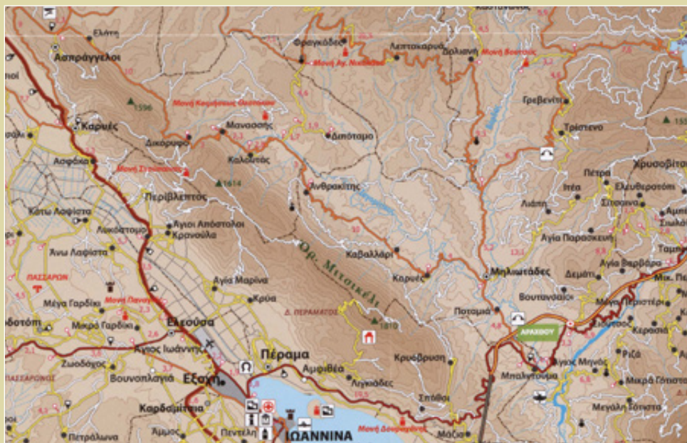
Τμήμα χάρτη "Ν. Ιωαννινών" 1 : 150.000. Έκδοση της Νομ. Αυτοδιοίκησης Ιωαννίνων.