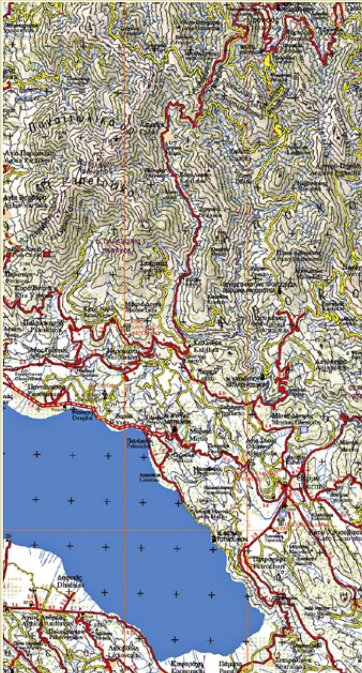
Τμήμα από τον χάρτη Αιτωλία 1 : 100 000 των εκδόσεων Ανάβαση.