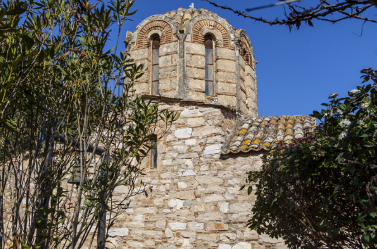
Η Παναγία Μεσσοπορίτισσα, με τον περίτεχνα κατασκευασμένο οκταγωνικό τρούλο Αθηνναϊκού τύπου.

ένα ελαφρύ σκύψιμο μπαίνουμε στο ναό ο οποίος μας καθιλώνει. Οι ηλιαχτίδες περνούν μέσα από τις χαραμάδες των παραθύρων του τρούλου και μπορούμε να δούμε μία εκπληκτική σειρά από τοιχογραφίες-αγιογραφίες που συγκινούν. Πρέπει σε τούτο εδώ το ναό να υπάρχει και η ομορφότερη ίσως μορφή του Ιησού. Πρόσωπα αγίων και μορφές δίχως βλέμματα (από την φυσική φθορά των υλικών στις κόρες των ματιών) έχουν δημιουργηθεί με διαφορετικές τεχνολογίες και απεικονιστικές τεχνικές και αυτό είναι πραγματικά ιδιαίτερο. Μία τοιχογράφηση που χρονολογείται στο 1232 . Στον δε νάρθηκα κυριαρχεί και εντυπωσιάζει άλλη μία παράσταση της Δευτέρας Παρουσίας. Τα λαμπερά χρώματα των αγιογραφιών πραγματικά σου μεταδίδουν την αίσθηση ότι βρίσκεσαι σε ένα περιβάλλον που η τέχνη δημιούργησε για να ευφράνει.