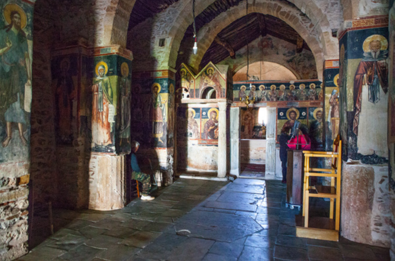
Εσωτερικό του ναού των Ταξιαρχών, με το μοναδικό στο είδος του, για την Αττική, δίδυμο προσκυντήρι στο βόρειο τμήμα του τέμπλου.