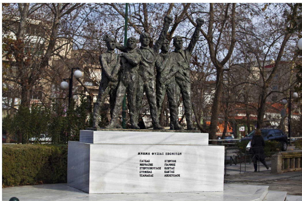
Το μνημείο των πέντε αγωνιστών της Εθνικής Αντίστασης, στην πλατεία Ρήγα Φεραίου

χρόνια. Χρόνο με το χρόνο η Ασκληπιού αρχίζει να αποκτά, σε όλο της το μήκος, μονώροφα και διώροφα σπίτια, καθώς και πολλά αρχοντικά. Η μεγάλη, ωστόσο, ανοικοδόμηση αρχίζει να παρατηρείται από τις αρχές του 20 ου αιώνα. Η ανέγερση δε του ξενοδοχείου « Αχιλλείου », το 1962 , θα αποτελέσει κατά κάποιο τρόπο, το έναυσμα της μεταπολεμικής οικοδομικής δραστηριότητας της πόλης. Τότε η Ασκληπιού είχε άλλο χρώμα, ειδικά τις Κυριακές, στη διάρκεια της βραδινής βόλτας. Οι άντρες φορούσαν τα καφέ ή μπλε κουστούμια τους, οι γυναίκες τις κλαρωτές και πολύχρωμες φούστες τους. Εκεί, ανάμεσα στο συντηρητικό πλήθος, προς το τέλος της δεκαετίας του 1960, θα κάνουν την εμφάνισή τους, βολτάρουσες, και οι πρώτες « μινιφορούσες », προς τέρψιν, βέβαια, των ανδρικών οφθαλμών.