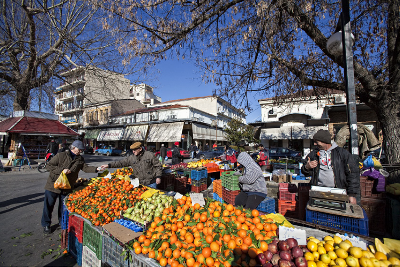
Λαϊκή αγορά. Ευχάριστη νότα της καθημερινής τρικαλινής ζωής.

Πανέμορφη είναι η δενδροστοιχία με τα πλατάνια, που φιλοξενεί καθημερινά μια μεγάλη λαϊκή αγορά, με ελκυστική ποικιλία από φρούτα και ζαρζαβατία. Κάθε Δευτέρα, βέβαια, το «Παζάρι των Τρικάλων» είναι πολύ πιο διάσημο και βέβαια μεγαλύτερο από την καθημερινή λαϊκή αγορά.