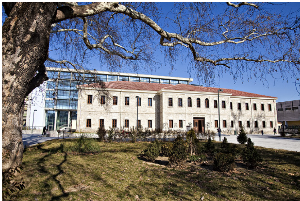
Το Δικαστικό Μέγαρο των Τρικάλων, το αρχικό πετρόχτιστο και το νεότερο γυάλινο.

21,38 μέτρα, έχει διάμετρο 18 μέτρων, πολύ μεγαλύτερη από τα υπόλοιπα τζαμιά της Ελλάδας σε Αθήνα, Ναύπλιο, Λάρισα, Ιωάννινα και αλλού. Το υπέρθυρο της μαρμαρινής εισόδου είναι από « ατράγιο λίθο », δηλ. από πέτρα που έβγαине από τα ορυχεία της αρχαίας πόλης "Άτραγα", απέναντι από την Πηνειάδα Τρικάλων. Από τον μιναρέ του τζαμιού λείπει η κωνική κορυφή. Μερικά μέτρα νοτιότερα του τζαμιού βρίσκεται ο οκταγωνικός, θολωτός και μολυβδοσκεπαστος –άλλοτε- « Τουρμπές », δηλαδή το μαυσωλείο του Οσμάν Σάχ, που έθανε το 1567 / 8.