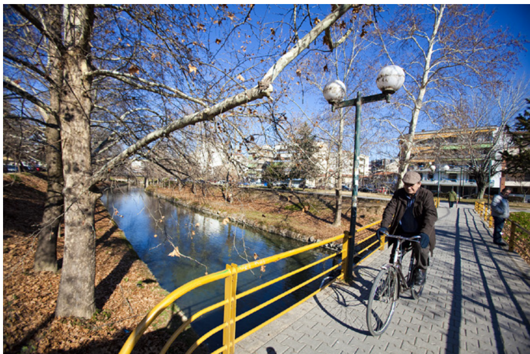
Ληθαίος, πεζογέφυρες και ποδήλατα κυριαρχούν στην Τρικαλινή καθημερινή ζωή.

μήκος 31 και πλάτος 8,25 μέτρα. Το ύψος της είναι 6,30 μέτρα. Χάρη στην ισχυρότατη κατασκευή της άντεξε τόσο στην μεγάλη πλημμύρα του Ληθαίου, το 1907 , όσο και στην απόπειρα των Αγγλικών στρατευμάτων να την ανατινάξουν κατά την αποχώρησή τους, το 1941.