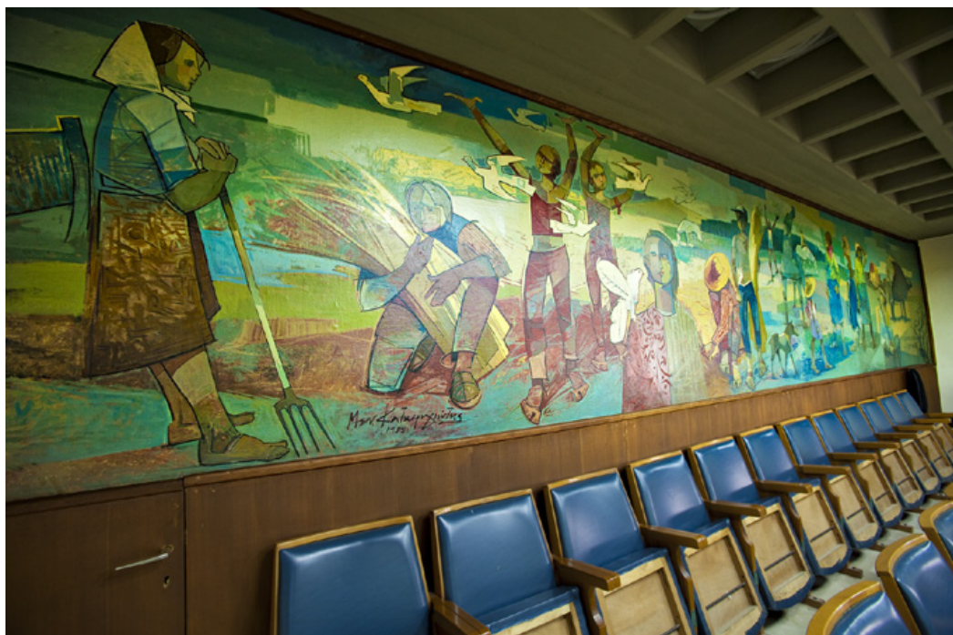
«ΘΕΣΣΑΛΙΚΟΥ ΑΓΕΡΑ ΞΥΠΝΗΜΑ», ο εκπληκτικός πίνακας του Μενέλαου Καταφυγιώτη.

Ο Ίων Βορρές λέει για τον Καταφυγιώτη, ότι «τον διακρίνει ένας προσωπικός και αυθόρμητος οραματισμός που εκφράζεται με ένα φίνο αλλά όχι εξεζητημένο ρεαλισμό...».