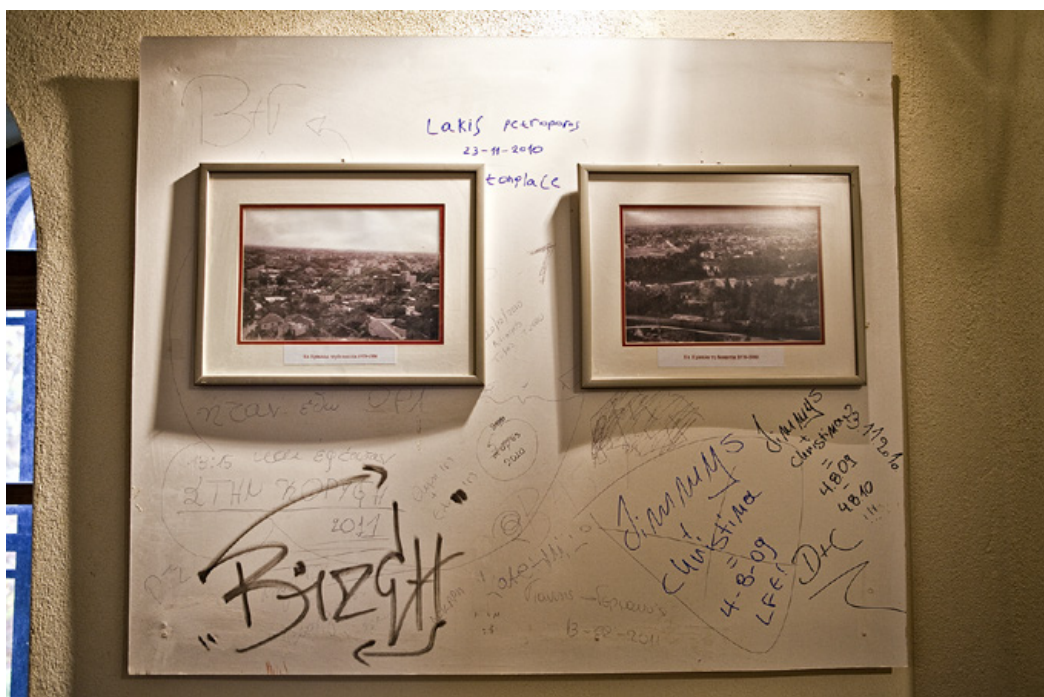
Στο κάστρο των Τρικάλων εξέχουσα θέση κατέχει ο Πύργος του Ρολογιού. Δυστυχώς, η εικόνα στο εσωτερικό, απεικονίζει το επίπεδο πολιτισμού μιας μερίδας επισκεπτών.

ως πατέρα του Μαχάονα και του Ποδαλείριου, αρχηγών του εκστρατευτικού σώματος των Τρικκαίων στην Τροία. Το όνομα Τρίκκη ή Τρίκκα διατηρήθηκε και στην πρωτοβυζαντινή περίοδο. Η πόλη για πρώτη φορά αναφέρεται ως Τρίκαλα το 1082-1083 , όταν τα καταλαμβάνουν οι Νορμανδοί. Στα κατοπινά χρόνια τα Τρίκαλα λεηλατήθηκαν πολλές φορές από τις επιδρομές Γότθων, Σλάβων, Βουλγάρων, Νορμανδών και Καταλανών. Στο δεύτερο μισό του 14 ου αιώνα, οι Σέρβοι ηγεμόνες που εξουσίαζαν την περιοχή, έκαναν τα Τρίκαλα για ένα διάστημα έδρα τους. Το 1395 τα Τρίκαλα περνούν στην κυριαρχία των Τούρκων, η οποία κράτησε σχεδόν 500 χρόνια, ως το 1881 .