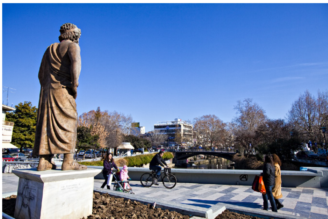
Στην φαρδειά πεζογέφυρα, πάνω από την κεντρική σιδερένια, δεσπόζει ο ανδριάντας του Ασκληπιού

Επιστρέφουμε στην Κεντρική σιδερένια γέφυρα για να γνωρίσουμε και τα υπόλοιπα γεφύρια, ανάντη του ποταμού. Το πρώτο που συναντάμε λίγο πιο πάνω είναι η φαρδιά τσιμεντένια πεζογέφυρα «ΑΧΙΛΛΕΙΟ», από το ομώνυμο αντικρινό ξενοδοχείο.