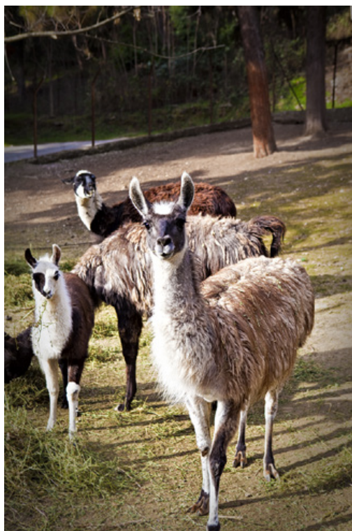
Δημοτικός Ζωολογικός Κήπος Τρικάλων. Οι εικόνες μιλάνε μόνες τους.