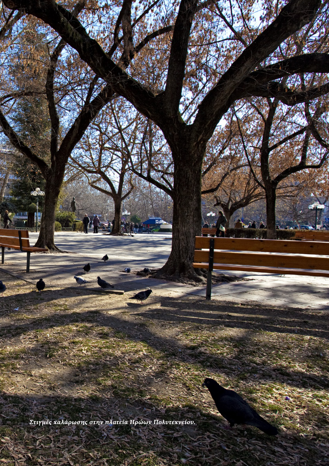
Στιγμές καλάρωσης στην πλατεία Ηρώων Πολυτεχνείου.