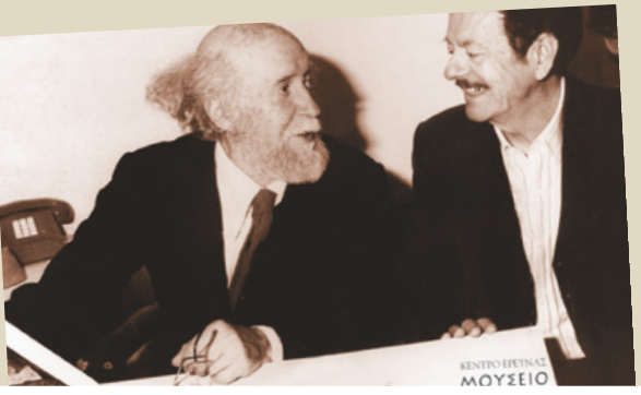
Στην εταιρεία του Ανδρέα Παπανδρέου, 1977. In the Prime Minister's Andreas Papandreu's company, 1977.