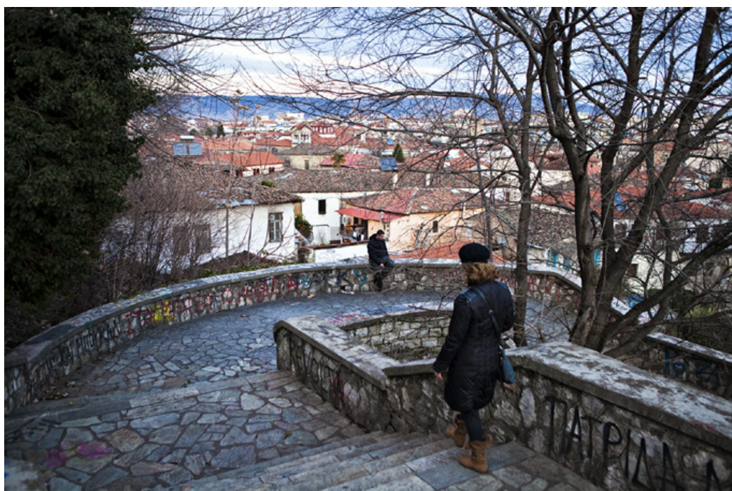
Κατηφορίζοντας το πλακόστρωτο δρομάκι από το κάστρο προς το Βαρούσι.

πυκνή χρήση πληθίων στους οριζόντιους και κάθετους αρμούς και την τρίτη στην Οθωμανική περίοδο με εκτεταμένες επισκευές.