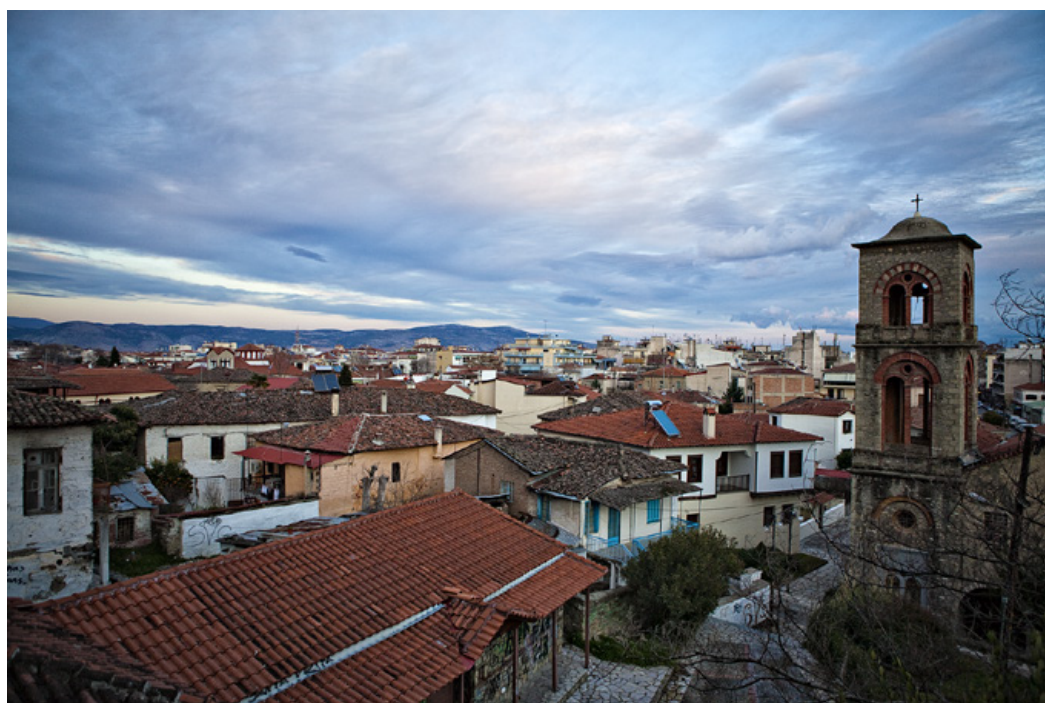
Θέα από τον πύργο του ρολογιού. Σε πρώτο πλάνο η συνοικία του Βαρουσιού.

Εσωτερική ξύλινη σκάλα μας οδηγεί στους διαδοχικούς ορόφους του πύργου. Οι τοίχοι είναι διακοσμημένοι με εξαιρετικό φωτογραφικό υλικό, παλιό κυρίως, από την πόλη και τα σημαντικότερα μνημεία των Τρικάλων. Δυστυχώς, οι κατά καιρούς ανεγκέφαλοι επισκέπτες – νεαρής συνήθως ηλικίας – έχουν φροντίσει ν' αποτυπώσουν ανεξίτηλα την ταυτότητα και το επίπεδο του πολιτισμού τους πάνω στο αρχαιακό υλικό της πόλης των Τρικάλων. Το κλιμακοστάσιο τερματίζει ακριβώς κάτω από τα τέσσερα μεγάλα ρολόγια, ένα σε κάθε σημείο του ορίζοντα. Η θέα περιμετρικά είναι κορυφαία, τα δύο εγκατεστημένα όμως τηλεσκόπια δεν λειτουργούν. Θα ήταν παράλογο αν λειτουργούσαν.