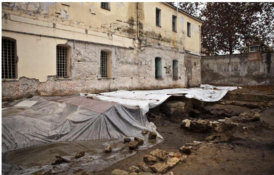
Η σημερινή εικόνα τμήματος των παλιών φυλακών και επιφανειακών υπολειμμάτων των οθωμανικών λουτρών.

εγκαταστάσεις των Φυλακών, που λειτούργησαν μέχρι το 2006