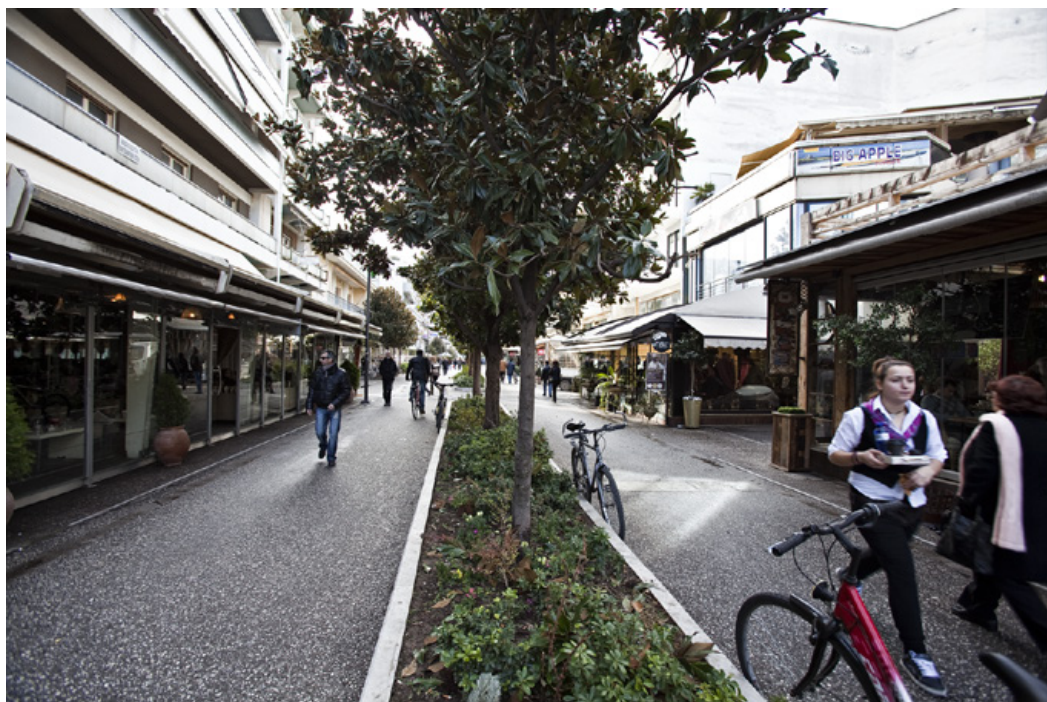
Όρες χαμηλής κίνησης στον πεζόδρομο της οδού Ασκληπιού.

Γιάννη Στάμου. Αμυδρά μόνον θυμάμαι ελάχιστη κίνηση, ελάχιστα αυτοκίνητα, καθόλου καφετερίες και χαμηλές οικοδομές.