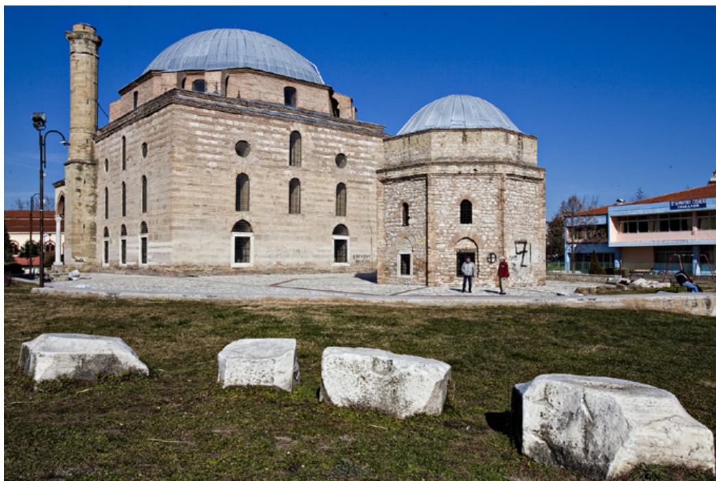
Το περίφημο «Κουρσούμ Τζαμί», έργο του φημισμένου αρχιτέκτονα Μείμάρ Σινάϊ Πασά (1557).

συνδεδειγμένο κονιάμα (κουρασάνι). Σύμφωνα με τα μέχρι στιγμής δεδομένα της έρευνας το λουτρό περιλαμβάνει τέσσερες αίθουσες, ανά δύο, ανατολικά και δυτικά του διαδρόμου. Στη βόρεια και νότια πλευρά αυτού του διαδρόμου ανοίγεται από μια τοξωτή είσοδος. Στην βόρεια είσοδο διατηρείται ισλαμικό οξυκόρυφο τόξο. Ο τρόπος δόμησης του κτίσματος γίνεται είτε με παράλληλες σειρές πλίνθων ή με αργούς λίθους και συνδεδειγμένο κονιάμα.