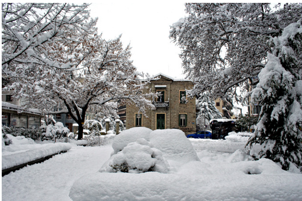
Η πρόσφατη σφοδρή χιονόπτωση του Φλεβάρη έχει χαρίσει στα Τρίκαλα εικόνες ονειρικές Το κτίριο του Σιδηροδρομικού Σταθμού στο τέρμα της Ασκληπιού.