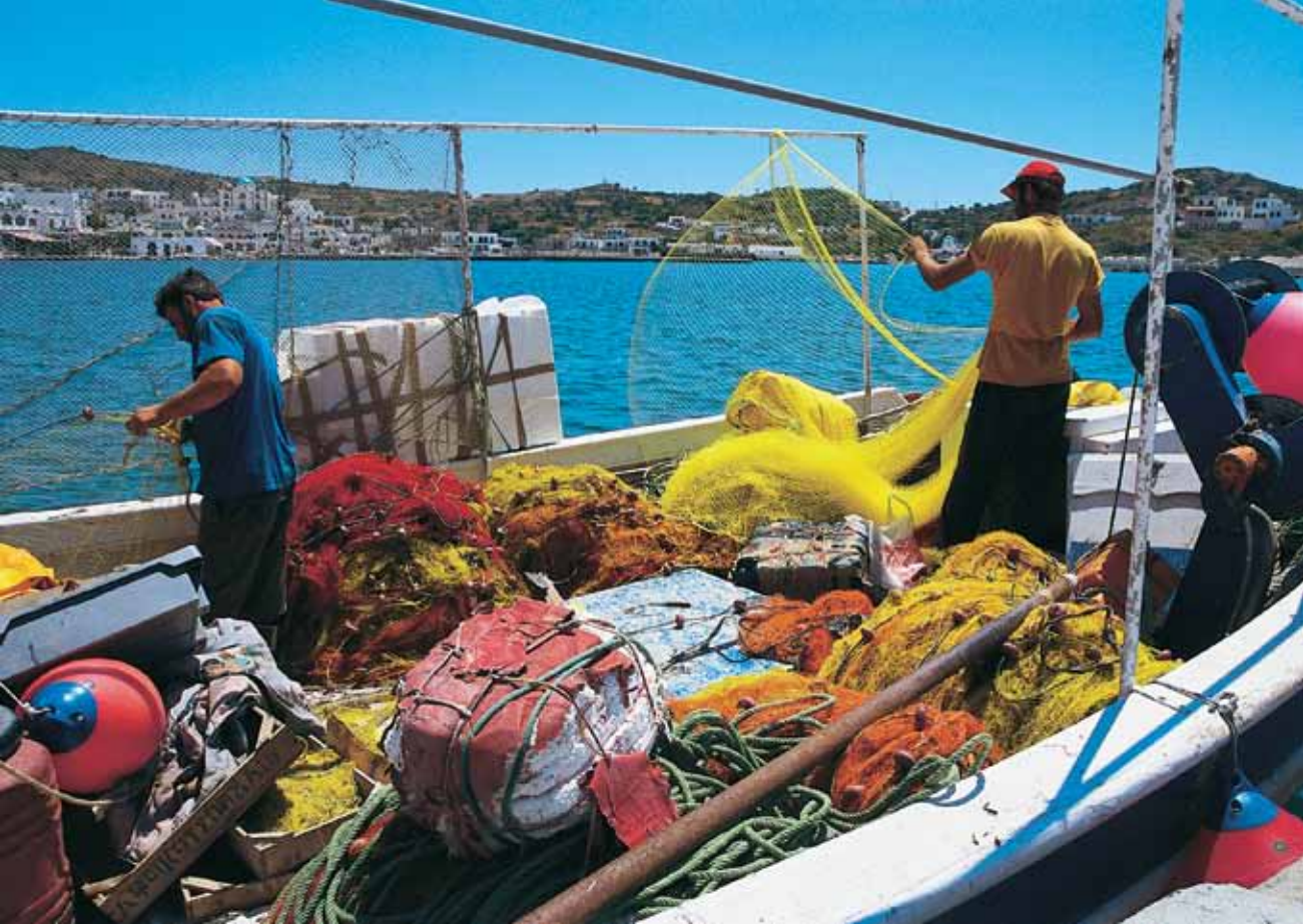
Ετοιμαστές δικτυών στο λιμάνι των Λειψών.

πέτρινο ανηφορικό μονοπάτι μήκους 1 χλμ με την Πάνω Κοίμηση. Η όλη διαδρομή, η μυρωδιά του σκίνου μα περισσότερο, η θέα του λειψιώτικου πολύνησου από τον περίβολο του μικρού ερημητηρίου ανοίγουν την όρεξη για τοπικά μεζεδάκια και νέες περιπέτειες.