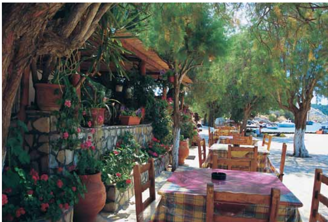
Αρκιοί. Η κεντρική πλατεία.