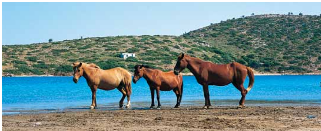
Αρκιόι Λιμνάρι . Αρκιώτικα άλογα στους δίδυμους όρμους

όστρακα προϊστορικής εποχής και τεμάχια οφιανού στην ευρύτερη περιοχή του οικισμού που αποδεικνύουν περίτρανα ότι το νησί κατοικείται ήδη από τους αρχαίους χρόνους. Τα ευρήματα που πραγματικά ξαφνιάζουν, αφορούν τα σωζόμενα ερείπια οχυρού που ιδρύθηκε από την Μίλητο και στιβαρού ορθογώνιου πύργου ελληνιστικής εποχής στην αριστερή πλευρά του Πόρτο Αυγούστα. Ο πύργος