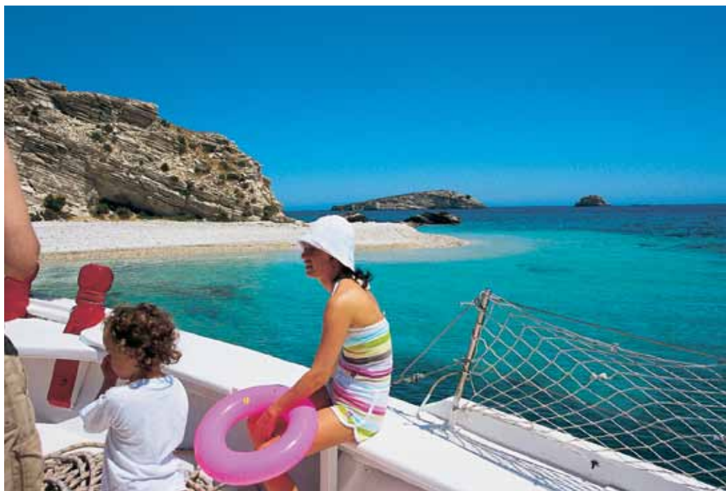
Βόρεια Ασπρονήσια. Ο τέλειος συνδυασμός λευκού και γαλάζιου. Θαλάσσιες αμίδες στο Μακρονήσι, λίγο έξω από το λιμάνι των Λειψιών. (Αριστερά)