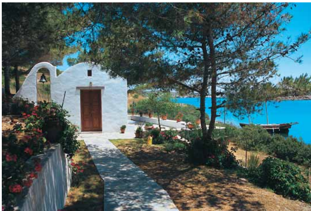
Μαράθι Ιδιωτικό εκκλησάκι Ο Τρύπας και ο Πειρατής.

...στο ειδυλλιακό Μαράθι. Στη νησίδα αυτή των 355 στρεμμάτων που πήρε το όνομά της από το ομώνυμο μυρωδικό κατοικεί μόνιμα η οικογένεια Κάβουρα.