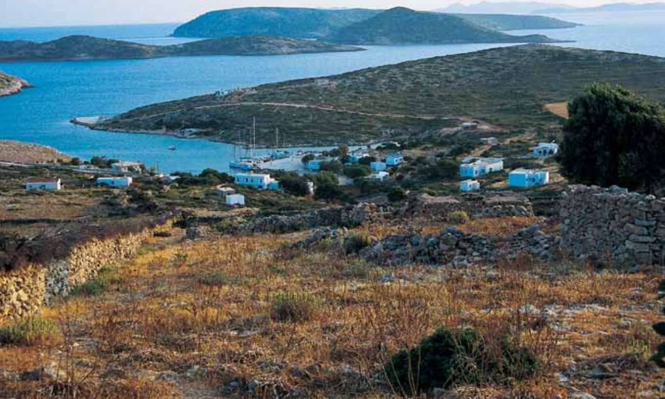
Το Πόρτο Αυγούστα από την Παντάνασσα Διακρίνονται το Μαράθι η Στρογγυλή και η Αγγελούσα

Λιμνάρι , το Ιταλικό φυλάκιο στα βόρεια του νησιού, το Κάστρο των ελληνοσλαβικών χρόνων, τα κλασικά Τηγανάκια , το παλιό χωριό με την εκκλησία της Παντάνασσας , τους δίδυμους όρμους Στενό και Γλίπαπα στο μεγαλόνησο και τον Άγιο Νικόλαο , την βυζαντινή στέγνα και τον Πειρατή στο Μαράθι .