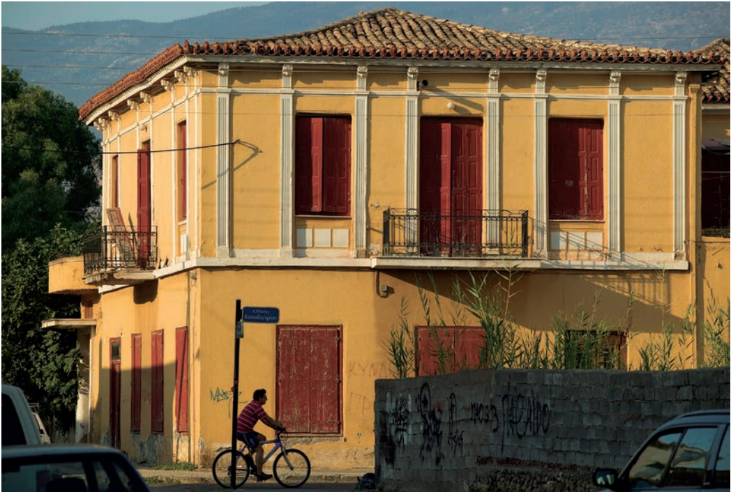
Θαυμάσιο νεοκλασσικό της Ιτέας. Χαρακτηριστική η φιγούρα του ποδηλάτη. Τραπεζάκια στην αμμουδιά, δίπλα στο νερό.