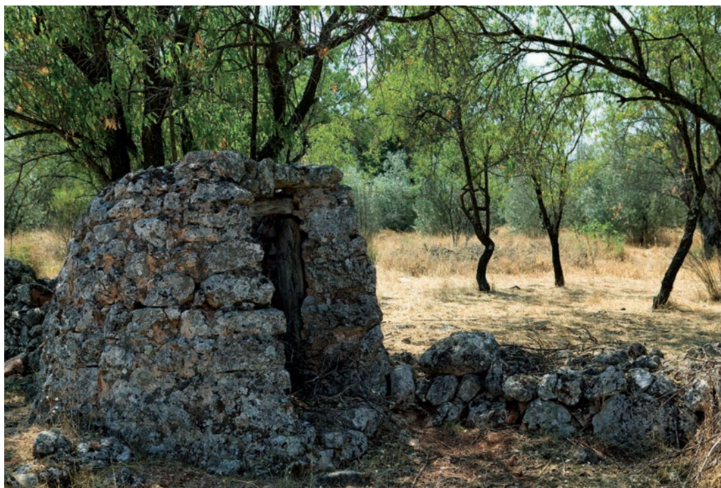
Πετρόχτιστο σκέπαστρο πηγαδιού, για να διατηρείται πιο κρύο το νερό. Κάθετοι λαξευτοί βράχοι δημιουργούν ευδιάκριτα δωμάτια στον αρχαίο οικισμό.