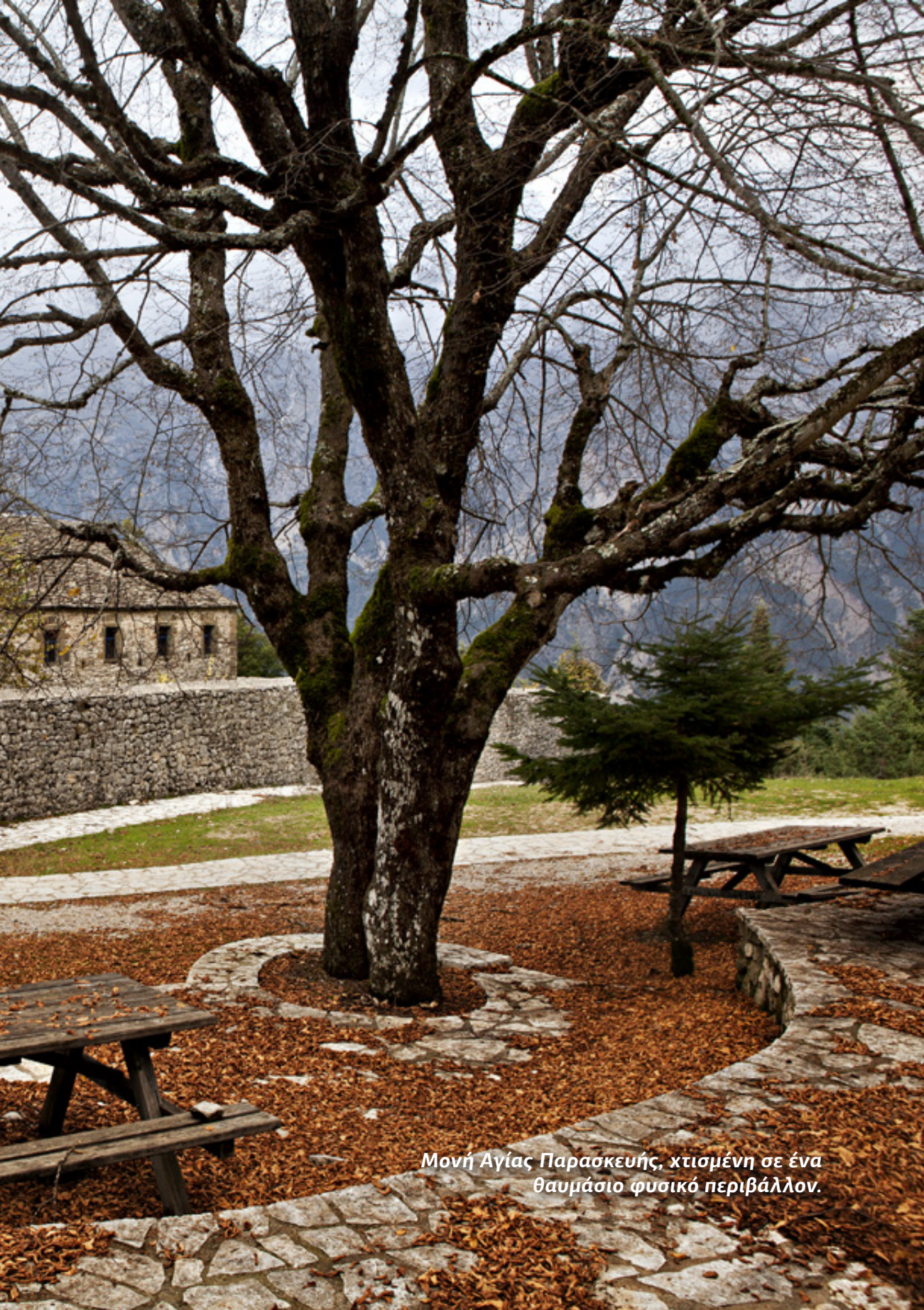
Μονή Αγίας Παρασκευής, χτισμένη σε ένα θαυμάσιο φυσικό περιβάλλον.