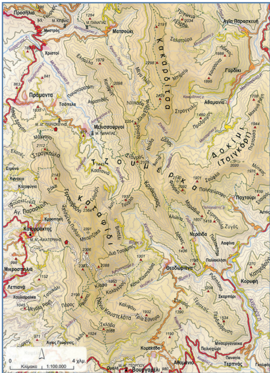
ΧΑΡΤΗΣ: ΕΚΔΟΣΕΙΣ ΑΝΑΒΑΣΗ, ΑΠΟ ΤΟ ΒΙΒΛΙΟ ΤΟΥ ΝΙΚΟΥ ΝΕΖΗ 'ΤΑ ΕΛΛΗΝΙΚΑ ΒΟΥΝΑ', 2010