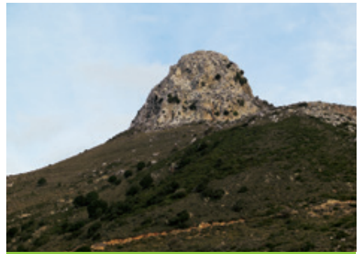
Ο Βραχώδης κώνος του "Καρφιού". Το Καθολικό της περιφέρειας Μονής Κεράς (κάτω)