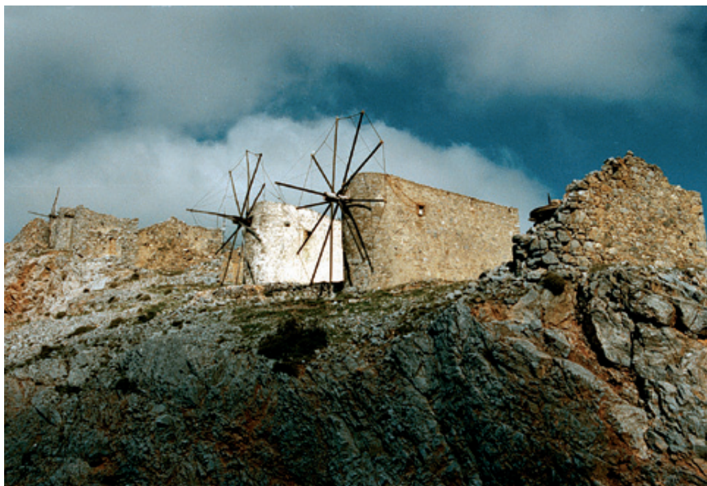
Μερικοί από τους εναπομείναντες πετρόμυλους - αλευρόμυλους στο Σελί. Οι παραδοσιακές αγροτικές ασχολίες δεν σταματούν ούτε τον χειμώνα. (δεξιά)