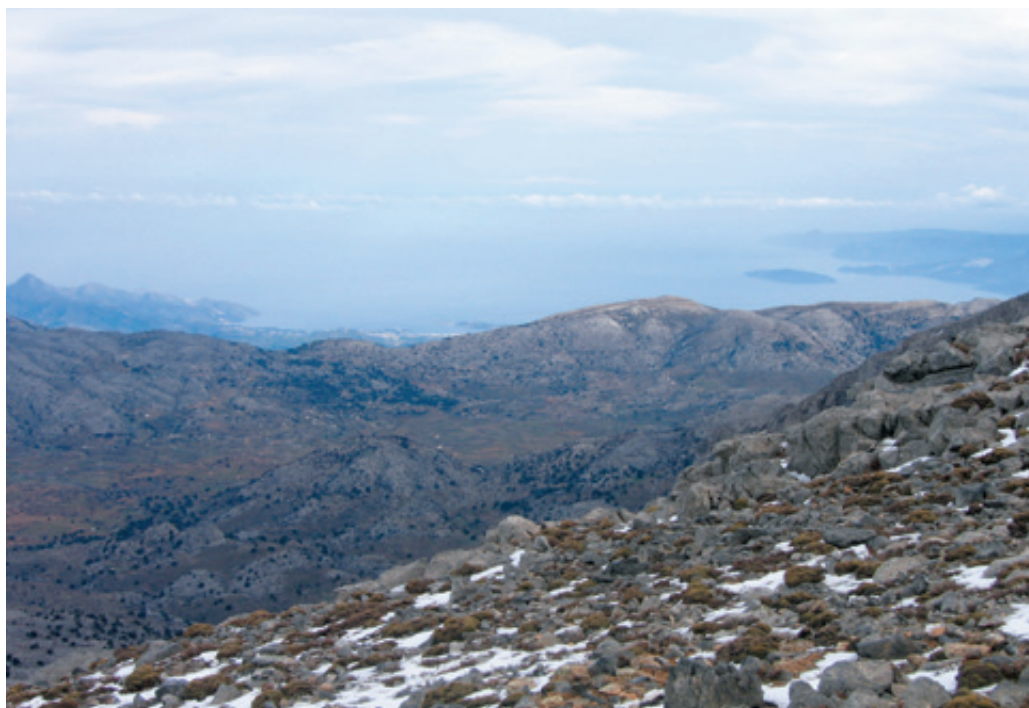
Από την κορυφή ο κόλπος του Μεραμπέλου. Ακριβώς μπροστά μας διακρίνουμε και το οροπέδιο του Καθαρού.

"διάσημο" Χαλασά (τοπωνύμιο που δεν έχει πάρει αδίκως το όνομα αυτό). Πρόκειται για μία σάρα (πλαγιά με πέτρες) κλίσεως είκοσι - είκοσι πέντε μοιρών που ειδικά το καλοκαίρι είναι αρκετά επώδυνη... Εδώ πρέπει να δώσουμε και ιδιαίτερη προσοχή αφού το μονοπάτι, όπως φαίνεται, χιλιάει κάθε χρόνο με την ισχυρή χιονόπτωση και δεν υπάρχει σήμανση με σημαϊάκια παρά με πολύ αγνά σημάδια από σπρέι και κούκους (συστάδες από πέτρες).