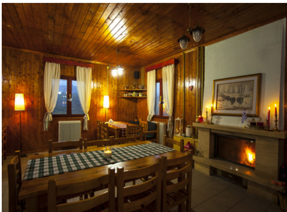
Εσωτερικό από τον ιδιαίτερα φροντισμένο χώρο εστίασης στο Δασικό Χωριό Ερυμάνθου.