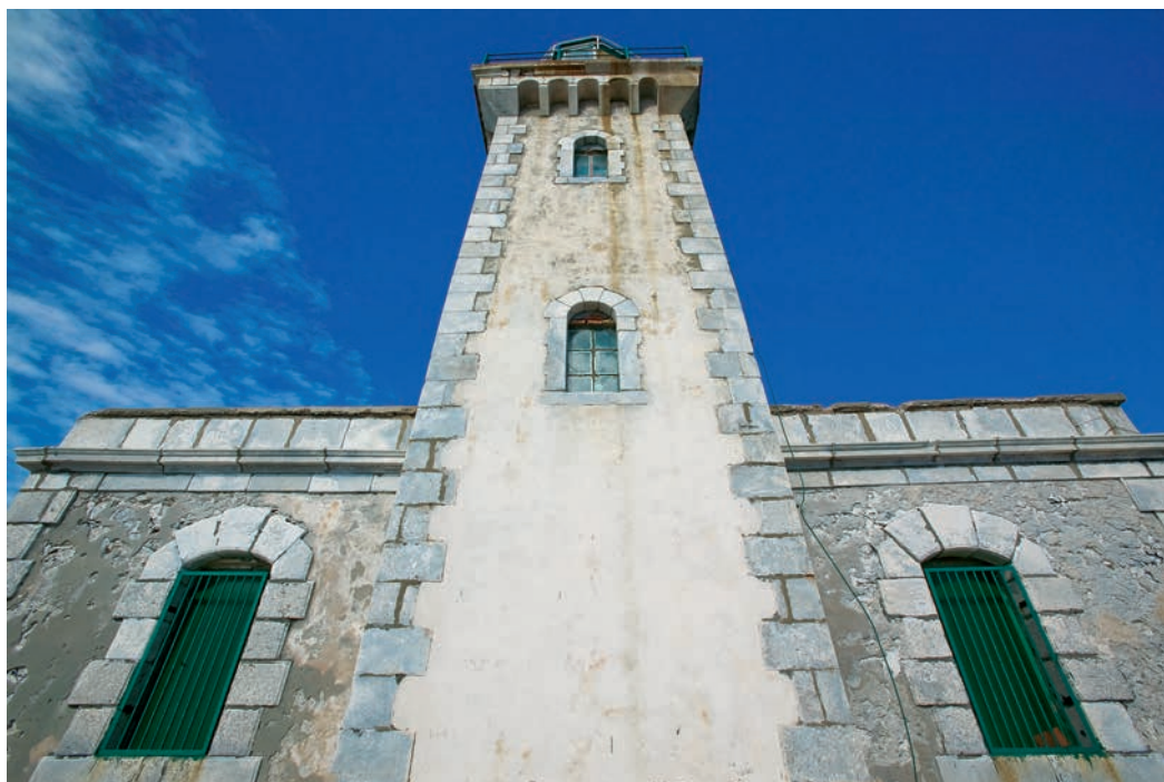
Ο λιθόκτιστος φάρος του Ακροταίναρου ή Κάβο Ματαπά, που κατασκευάστηκε το 1882 από τους Γάλλους.

κτιστοι τοίχοι του είναι εξωτερικά επιχρισμένοι, ενώ μαρμάρινοι και εμφανείς είναι οι γωνιακοί λίθοι, το γείσο, το στηθαίο του κτίσματος και τα τοξωτά στα παράθυρα και στην είσοδο. Ανακαίνιστηκε το 1930 αλλά έπαψε να λειτουργεί κατά την κατοχή. Το 1950 ανακαίνιστηκε για δεύτερη φορά και μέχρι το 1984 φιλοξενούσε τρεις φαροφύλακες. Από τότε έπαψε να είναι επιτηρούμενος, αφού εγκαταστάθηκε αυτόματος φωτιστικός μηχανισμός με εμβέλεια 22 ναυτικά μίλια που λειτουργεί με ηλιακή ενέργεια. Σε απόσταση 62 μιλίων ΝΔ του φάρου μετρήθηκε το μεγαλύτερο βάθος της Μεσογείου, στα 4.850 μέτρα!