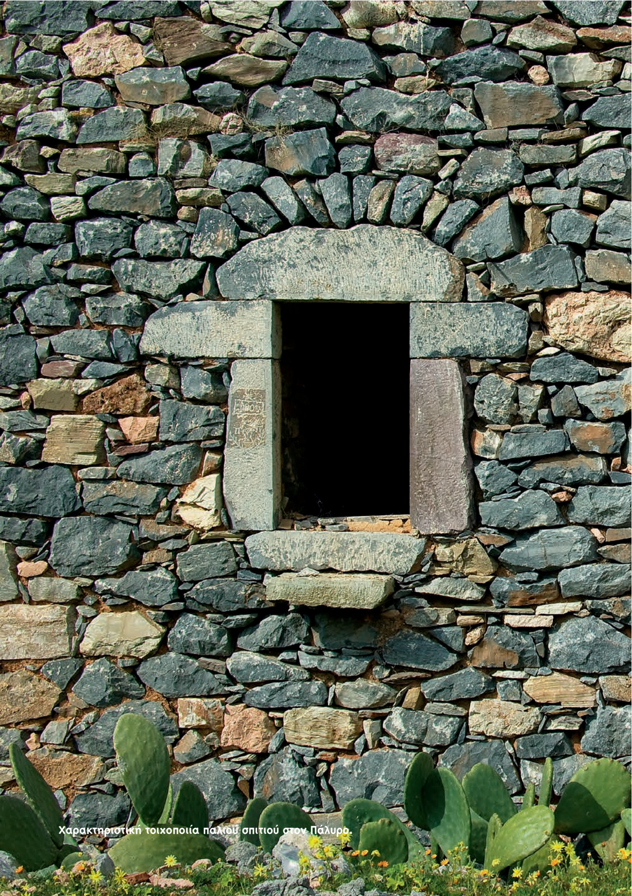
Χαρακτηριστική τοικοποιία παλιού σπιτιού στον Πάλυρο.