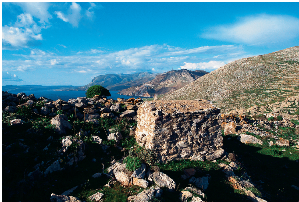
Κοιμητήριο Αγ. Θεοδώρων στο Αγριοκάμπι. (Επάνω)

Πανοραμική εικόνα του οικισμού Κοκκινόγεια, διακρίνεται ο χώρος ανασκαφής και η κορυφή 106.