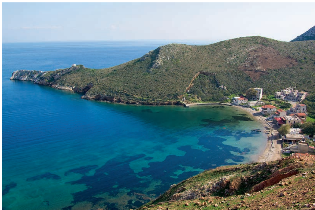
Ο οικισμός του Πόρτο Κάγιο με τα ρηκά, διάφανα νερά. Στο μονοπάτι για το ακρωτήριο με τη σπίθα. (Αριστερά)