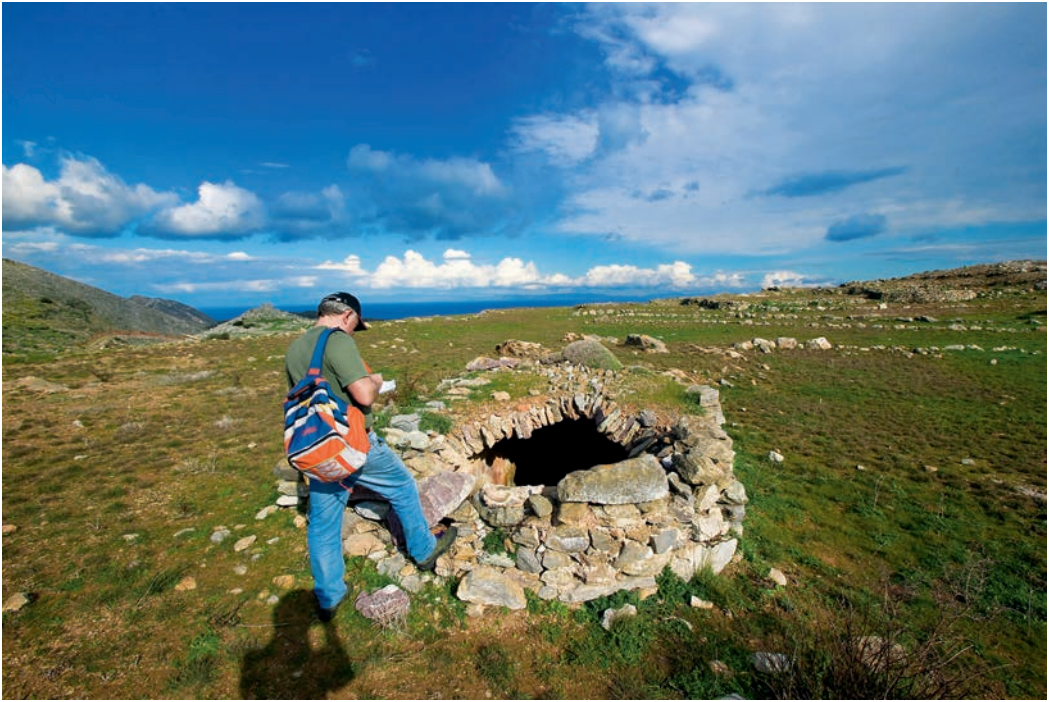
Οικισμός Αγριοκάμπι. Αλώνι, στέρνα και κοιμητηριακός ναΐσκος Αγ. Θεοδώρων.