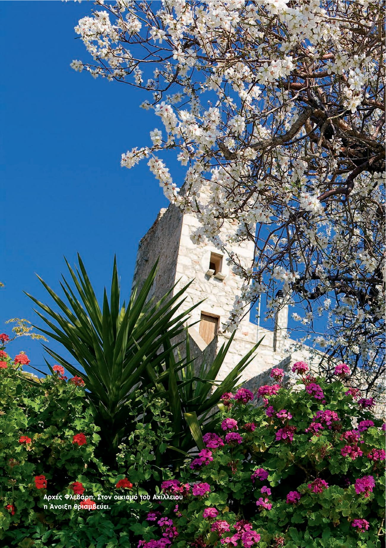
Αρχές Φλεβάρη. Στον οικισμό του Αχιλλείου η Άνοιξη θριαμβεύει.