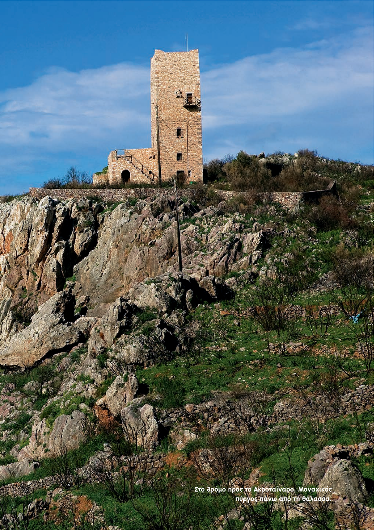
Στο δρόμο προς το Ακρεταίναρο. Μοναχικός πύργος πάνω από τη θάλασσα.