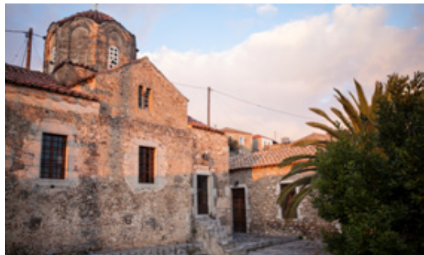
Πάνω: Ιστορικής σημασίας βραβείο για τα γερακίτικα χαλιά. Έκθεση Βιέννης 1873. Κάτω: Ο καθεδρικός του χωριού. Η Κοίμηση της Θεοτόκου.

Αν και το έμπα στο κεφαλοχώρι της Λακωνίας δεν εκπέμπει τίποτε άλλο παρά μια «κουρασμένη» καθημερινότητα, η βόλτα στα καλντερίμια του χωριού φροντίζει να ανταμείψει τον επισκέπτη με μικρές, απανωτές εκπλήξεις. Η λαίλαπα του «μοντερνισμού» μπορεί να έχει καταφέρει αρκετά χτυπήματα στο χωριό, το αρχοντικό όμως Γεράκι, γαντζωμένο και απλωμένο σε ένα βράχο πάνω από τον κάμπο, διασώζει την αρχιτεκτονική του κληρονομιά. Σπίτια κατοικημένα που σφύζουν από ζωή δίπλα σε μεγαλειώδη ερείπια δείχνουν τη συνέχεια αυτού του οικισμού, που έχει περάσει ουκ ολίγα σκαμπανεβάσματα. Ας μην ξεχνάμε ότι μιλάμε για έναν τόπο, που ο άνθρωπος και τα έργα του μετρούν κάποιες χιλιάδες χρόνια!