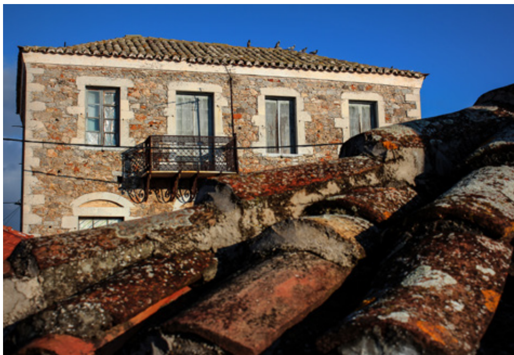
Λιτό αρχοντικό, στιβαρό, χωρίς «φιιοριτούρες». Όπως και η κυρά του που θα γνωρίσουμε παρακάτω.

Κουρασμένο από την αδιαφορία της Πολιτείας; Ενδεχομένως. Ακολούθησε το δρόμο της καθημερινότητας που έχει να κάνει με τις αγροτικές εργασίες και κυρίως την Ελιά . Ο υπέροχος κάμπος που ξαπλώνεται μπροστά από το υπερυψωμένο Γεράκι κάποτε, όχι πολλά χρόνια πίσω, χρύσιζε από τα στάχυα. «Κάτω στον Γερακιού τ' αλώνια, όπου κεληθούν πουλιά κι αηδόνια...» Σταδιακά και αφού πέρασαν και εποχές άνυδρες που σημάδεψαν το χωριό και τις τύχες των ανθρώπων εξαιτίας της Μετανάστευσης, η ελιά κυριάρχησε και έως σήμερα είναι το αίμα που δίνει ζωή στο χωριό και την οικονομία του. Απόδειξη, ότι ο Αγροτικός Συνεταιρισμός Γερακίου , ιδρυμένος το 1954 και ένας από τους μεγαλύτερους πρωτοβάθμιους Συνεταιρισμούς στη χώρα, έχει ως αποκλειστική παραγωγή το Ελαιόλαδο και την Ελιά Καλαμών . Γενάρης και όλες οι εγκαταστάσεις δουλεύουν στο μάξιμουμ. Οι βρώσιμες ελιές Καλαμών είναι η αιχμή του δόρατος της τοπικής παραγωγής και η δοκιμή μάς έπεισε με το