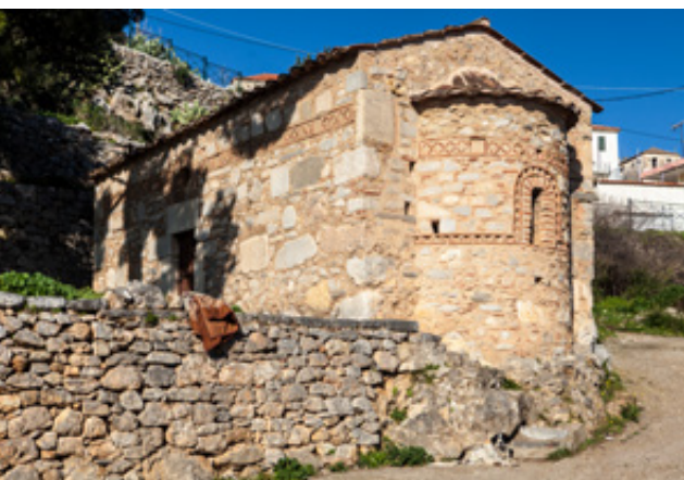
Όταν δεν υπήρχαν εφημερίδες, υπήρχαν ενημερωτικές πλάκες. Το διάταγμα του Διοκλητιανού όπως σώζεται στον μικρό ναό του Αγίου Ιωάννη του Χρυσοστόμου.

Τα θραύσματα αγγείων και τα εργαλεία από οψιανό και πυρόλιθο μιλούν για κατοίκηση ήδη από το 4500 π.Χ. Εκτεταμένος οικισμός και οχυρωματικά τείχη από το 2700 π.Χ. και μια Ακρόπολη που μας δίνει υλικό από διάφορες περιόδους, αποδεικνύουν ότι το Γεράκι ήταν ένα σημαντικό κέντρο κατά την Αρχαιότητα. Οι « Γερόνθραι » έκαναν τον περιηγητή Πausανία να σταθεί ιδιαίτερα στην ύπαρξη δυο ναών, του Άρη και του Απόλλωνα και τα στοιχεία μιλούν για σθεναρή αντίσταση των γηγενών στους Σπαρτιάτες, στους οποίους πήρε κοντά 300 χρόνια για να υποτάξουν τους ντόπιους κατοίκους. Οι πρώτοι που ασχολήθηκαν με τον μνημειακό πλούτο του Γερακίου ήταν οι Άγγλοι, που δουλεύοντας στη γειτονική Σπάρτη, μελέτησαν κυρίως τις κλασσικές αρχαιότητες των αρχαίων Γερονθρών. Παράλληλα αποτύπωσαν το κάστρο. Μετά τον πρώτο παγκόσμιο πόλεμο αρχίζει να συστηματοποιείται το ενδιαφέρον για το Γεράκι με τους Έλληνες βυζαντινολόγους να στρέφουν το ενδιαφέρον τους σε αυτό και με πρωτεργάτη τον Παναγιώτη Πουλίτσα , μετέπειτα Ακαδημαϊκό και πρόεδρο της Εταιρείας Βυζαντινών Σπουδών.