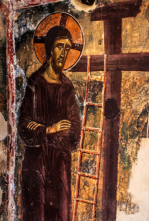
Η διαδεδομένη στη Λακωνία παράσταση του «Ελκόμενου».

ενότητα τοιχογραφημένων ναών. Το κάστρο γίνεται κατοικήσιμο αν και ο οικισμός του «κάτω Γερακίου» μοιάζει να μην εγκαταλείφθηκε ποτέ. Όλα αυτά έως το 1460 , οπότε άνοιξε ένα άλλο κεφάλαιο με την κυριαρχία των Τούρκων.