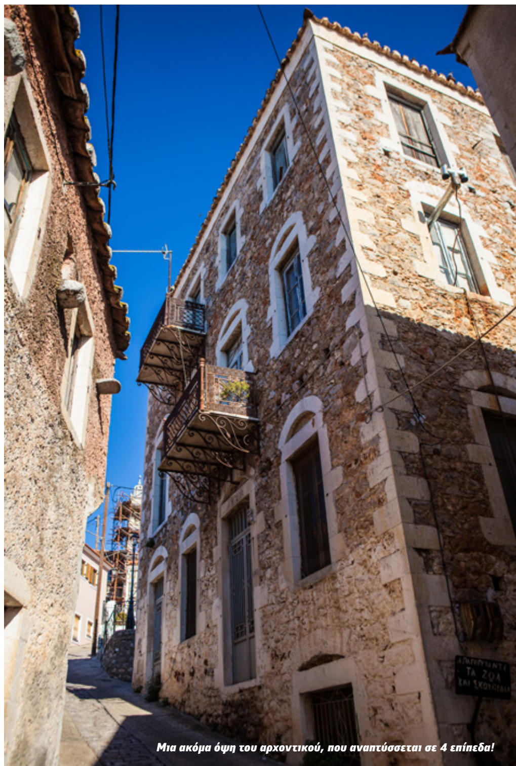
Μια ακόμα όψη του αρχοντικού, που αναπτύσσεται σε 4 επίπεδα!