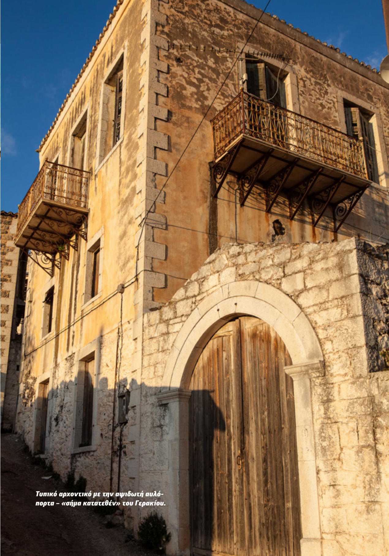
Τυπικό αρχοντικό με την αψιδωτή αυλό- πορτα - «σήμα κατατεθέν» του Γερακίου.