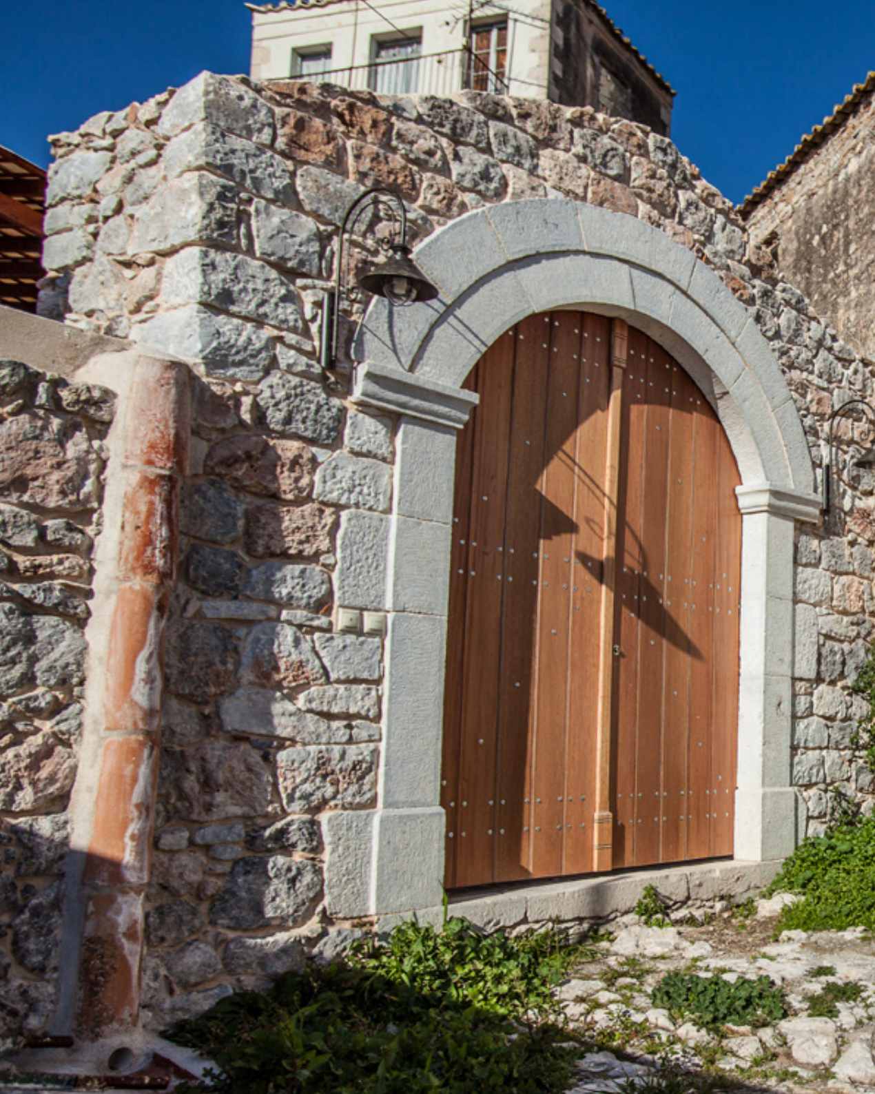
Κάποιες αποκαταστάθηκαν. Κάποιες άλλες ακόμα και στην εγκατάλειψή τους δε στερούνται του «μεγαλείου» τους. Δυο χαρακτηριστικές από τις πάνω από 130 αυλόπορτες του Γερακίου.