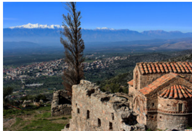
Η εικόνα της Βρεφοκρατούσας «Ελεούσας» στην είσοδο του Ναού της Ζωοδόχου Πηγής δεν περνά απαρατήρητη. Στο χαμηλό πλάτωμα του Κάστρου. Δεξιά ο περίτεχνος ναός της Αγίας Παρασκευής.