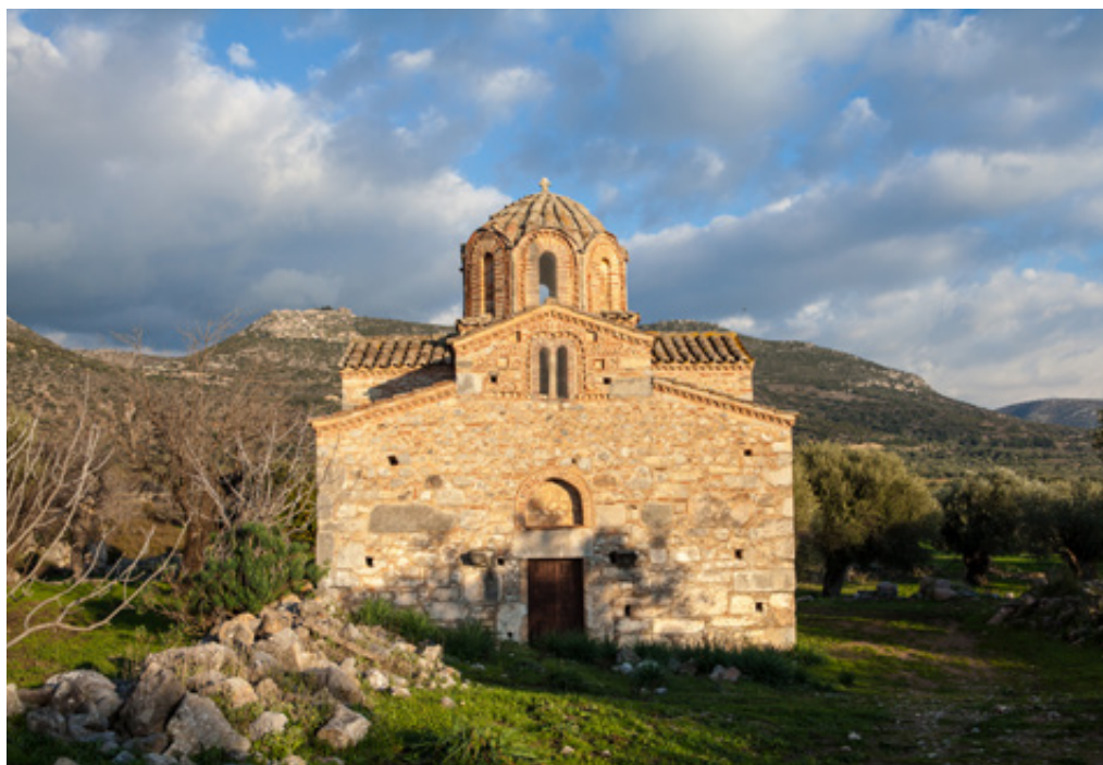
Σαν «κόσμημα» ακουμπισμένο στον ελαιώνα. Ο απογευματινός ήλιος καιδέυει τον υπέροχο ναό του 13ου αιώνα. Άγιος Σώζων.

σκόνη του Βυζαντίου και έφυγε ξανανωμένος με τα στήθη πλημμυρισμένα από την πνοή μιας αγνής ομορφιάς, μιας πηγαίας καλωσύνης». Ο ανεπανάληπτος χρονογράφος εποχής, Παύλος Παλαιολόγος , γράφει στα «Αθηναϊκά Νέα» της 3 ης Ιουνίου 1936 εντυπώσεις από το «Προσκύνημα εις Γεράκι» με αφορμή το Μνημόσυνο του Τελευταίου Αυτοκράτορα, Κων/νου Παλαιολόγου. Και όμως. Το Γεράκι δε σφύζει από ξενώνες και rooms to let. Εμείς αφεθήκαμε στην υπέροχη φιλοξενία του Ξενοδοχείου « Μεβελάϊον » στη Σπάρτη και η διαδρομή διάρκειας 35 περίπου λεπτών ως το χωριό ήταν η ωραιότερη προετοιμασία και η ιδανική «αποφόρτιση» από την κάθε Γερακίτικη μέρα μας. Προς το παρόν, στο χωριό υπάρχουν δυο μικροί ξενώνες και ευελπιστούμε ο Δημοτικός Ξενώνας να περάσει στα χέρια ενός δυναμικού επιχειρηματία που θα αξιοποιήσει πλήρως το κτήριο που βρίσκεται σε προνομιακή θέση.