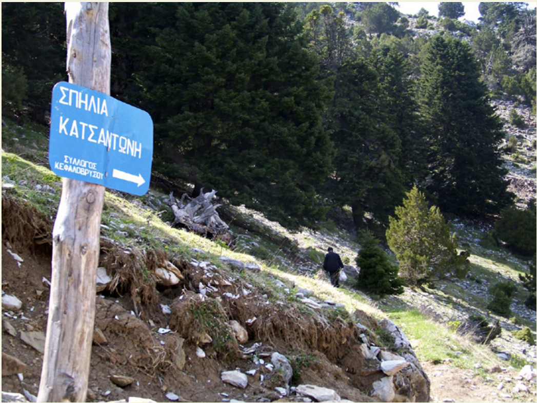
Στο δρόμο για τη σπηλιά