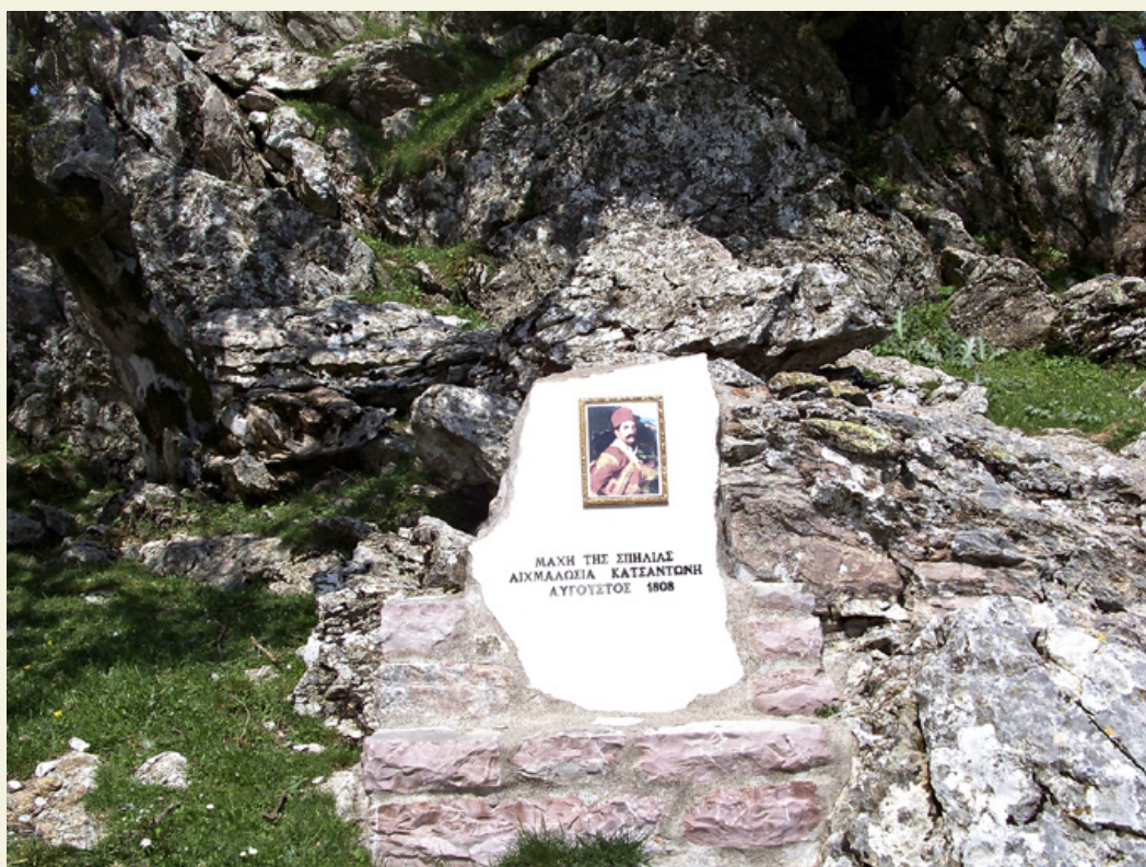
Απάνω στο διάσελο της Φούρκας.