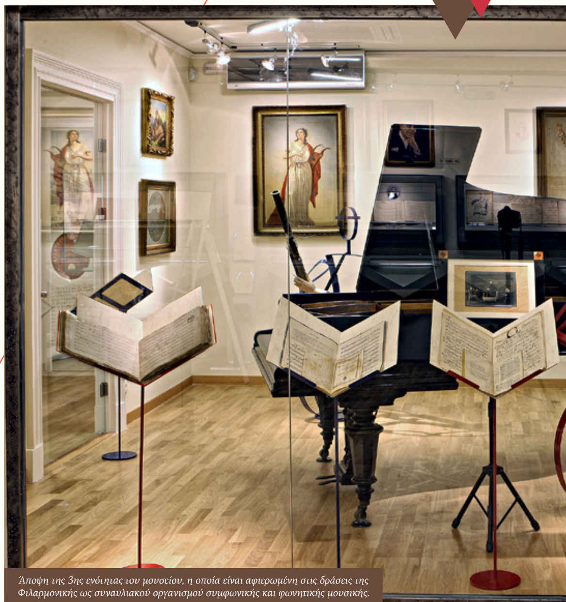
Άποψη της 3ης ενότητας του μουσείου, η οποία είναι αφιερωμένη στις δράσεις της Φιλαρμονικής ως συναυλιακού οργανισμού συμφωνικής και φωνητικής μουσικής.

στο παλαιότερο από τα μουσικά σωματεία του νησιού, τη Φιλαρμονική Εταιρεία Κερκύρας (τη λεγόμενη και «Παλαιά Φιλαρμονική»). Πράγματι, η Φιλαρμονική «έδωσε τον τόνο» σε ό,τι αφορά τη δημιουργία μπαντών στο νησί των Φαιάκων και για χρόνια αποτέλεσε πρότυπο και για άλλες μπάντες της Ελλάδας. Ωστόσο, η Φιλαρμονική Εταιρεία Κερκύρας δεν ήταν ποτέ μόνο η μπάντα της,