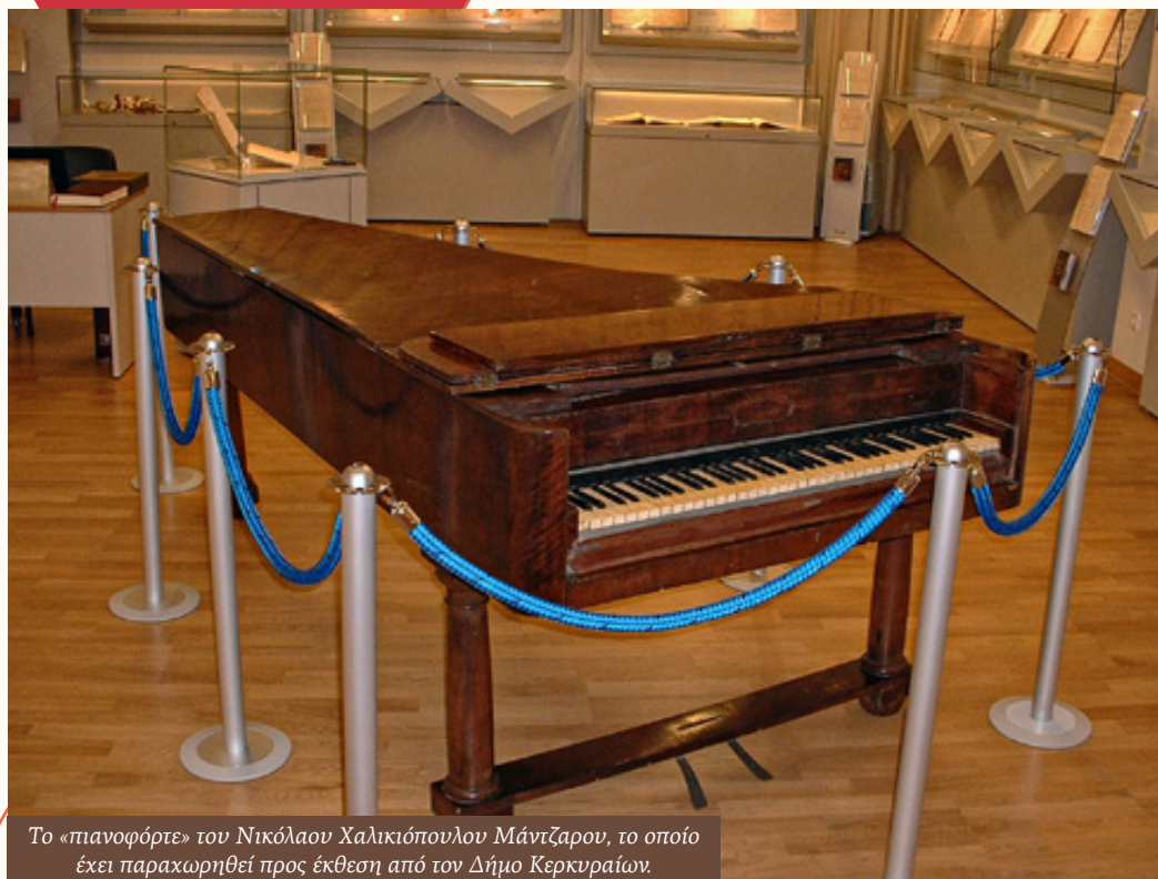
Το «παινοφόρτε» του Νικόλαου Χαλικιόπουλου Μάντζαρου, το οποίο έχει παραχωρηθεί προς έκθεση από τον Δήμο Κερκυραίων.