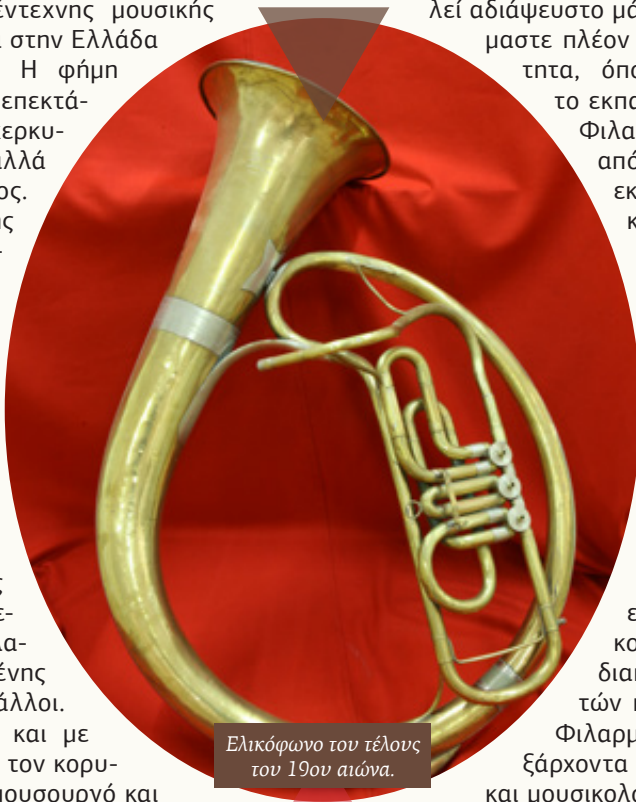
Ελικόφωνο του τέλους του 19ου αιώνα.

Πράγματι, η Φιλαρμονική ως μουσικοεκπαιδευτικός και συναυλιακός οργανισμός, υπό την καλλιτεχνική καθοδήγηση αρχικά του Νικόλαου Μάντζαρου (1797-1872) και στη συνέχεια άλλων σημαντικών συνθετών της Επτανήσου [όπως του Δομένικου Παδοβάνη (1817-1892), του Διονύσιου Ροδοθεάτου (1849-1892) και του Δημήτριου Ανδρώνη (1866-1918)], εξελίχθηκε σε κεντρική εστία ανάπτυξης της έντεχνης μουσικής στα Επτάνησα και στην Ελλάδα του 19 ου αιώνα. Η φήμη της σύντομα επεκτάθηκε εκτός του κερκυραϊκού χώρου, αλλά και εκτός Ελλάδος. Επίτιμα μέλη της υπήρξαν ο Τζιοακίνο Ροσίνι, ο Σαρλ Γκουνώ, ο δημιουργός του «Γερο Δήμου» Παύλος Καρρέρ, ο συνθέτης πλειάδας μελοδραμάτων (αλλά και του «Ολυμπιακού Ύμνου») Σπύρος Σαμάρας, ο διεθνούς φήμης φλαουτίστας Ευρυσθένης Γκίζας και πολλοί άλλοι. Το μουσείο τιμά και με την ονομασία του τον κορυφαίο Κερκυραίο μουσουργό και πρώτο καλλιτεχνικό διευθυντή του ιδρύματος Νικόλαο Χαλικιόπουλο Μάντζαρο.