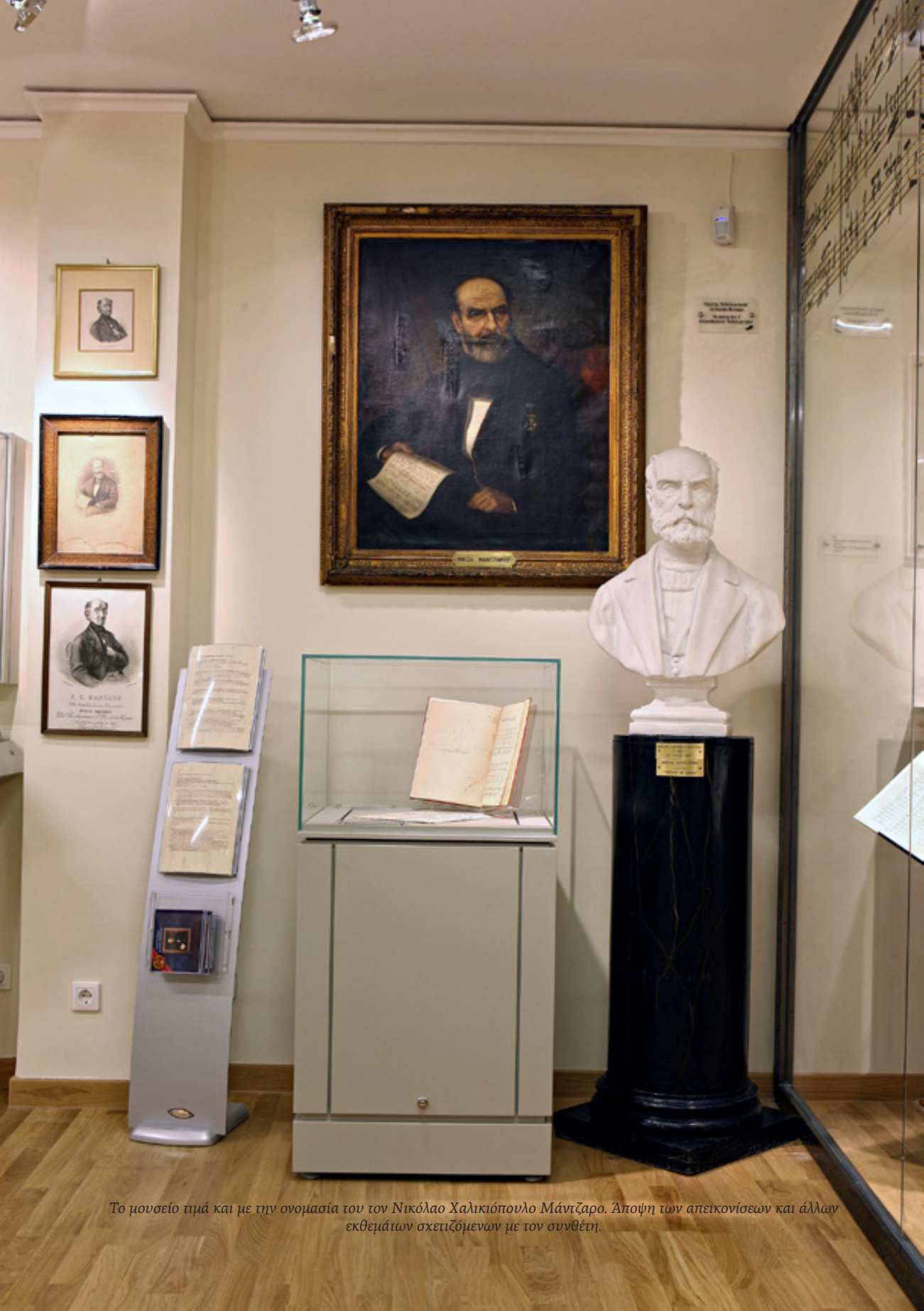
Το μουσείο τιμά και με την ονομασία του τον Νικόλαο Χαλικιόπουλο Μάντζαρο. Αποψη των απεικονίσεων και άλλων εκθεμάτων σχετιζόμενων με τον συνθέτη.