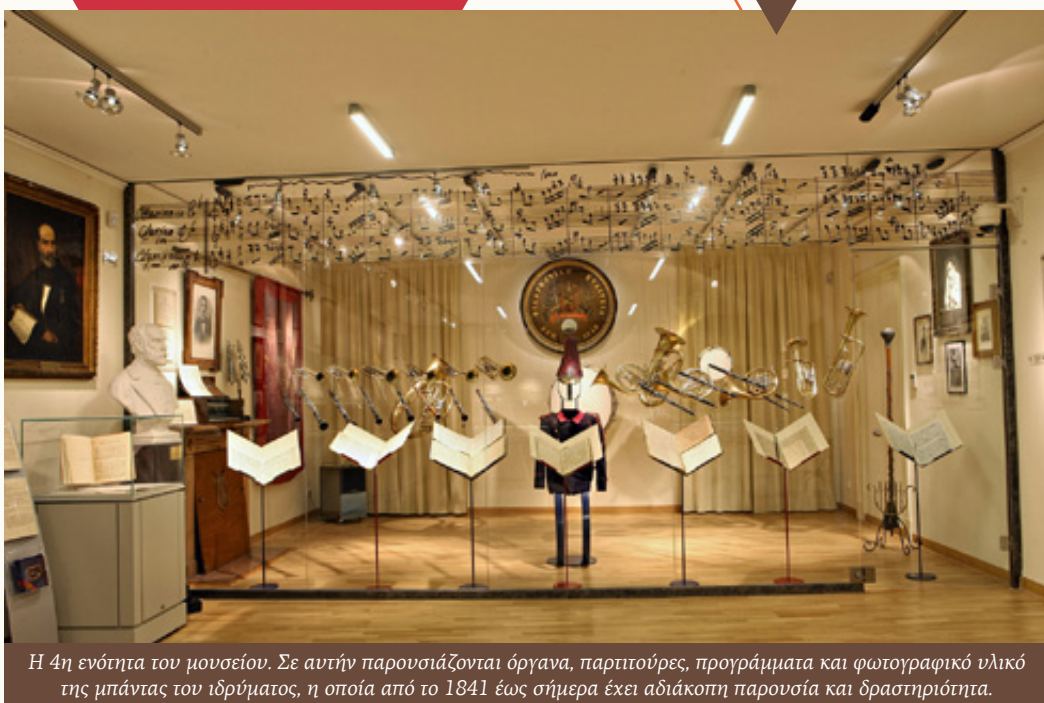
Η 4η ενότητα του μουσείου. Σε αυτήν παρουσιάζονται όργανα, παρτιτούρες, προγράμματα και φωτογραφικό υλικό της μπάντας του ιδρύματος, η οποία από το 1841 έως σήμερα έχει αδιάκοπη παρουσία και δραστηριότητα.

Ο Μάντζαρος, οι μαθητές του και ο κύκλος τους παρουσιάζονται μέσα από έργα και ζωγραφικούς πίνακες σε όλη την πέμπτη ενότητα του Μουσείου. Με τον τρόπο αυτό βρισκόμαστε σε ένα είδος βιωματικής αποτύπωσης της πρωτότυπης μουσικής δημιουργίας των Επτανήσων σε όλη τη διάρκεια του 19 ου αιώνα, η οποία συνδέεται άμεσα με την ίδια τη Φιλαρμονική, αφού όλοι οι παρουσιαζόμενοι μουσουργοί σχετίστηκαν με το ίδρυμα είτε ως οργανωτές είτε ως δάσκαλοι είτε ως υποστηρικτές του. Παράλληλα, οι συνθέτες αυτοί σημάδεψαν την εξέλιξη της έντεχνης μουσικής στην Ελλάδα του 19 ου αιώνα και των αρχών του 20 ου . Οι παρτιτούρες των έργων των παραπάνω μουσουργών επιβεβαιώνουν την ευρύτητα των σκοπών της Φιλαρμονικής Εταιρείας. Πιανιστική μουσική, οπερατικά αποσπάσματα, ολοκληρωμένα μελοδράματα, χορωδιακά, έργα για συμφωνική ορχήστρα και πολλά άλλα μας προσφέρουν με ζωντάνια την εικόνα μιας περιόδου με πρωτοφανή για τα ελληνικά δεδομένα μουσική δημιουργικότητα.