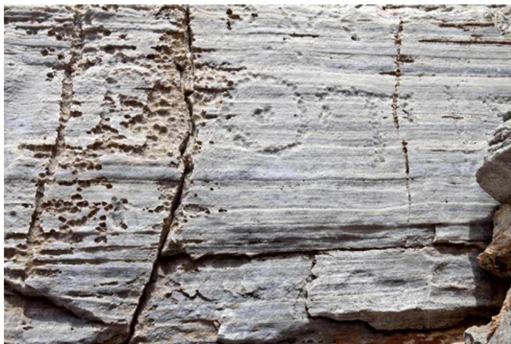
Ακρόπολη Αγ. Γεωργίου. Χαρακτηριστικά λαξεύματα, εμφανής λαξευμένη αύλακα και ίχνη επιγραφής σε κάθετη επιφάνεια βράχου.