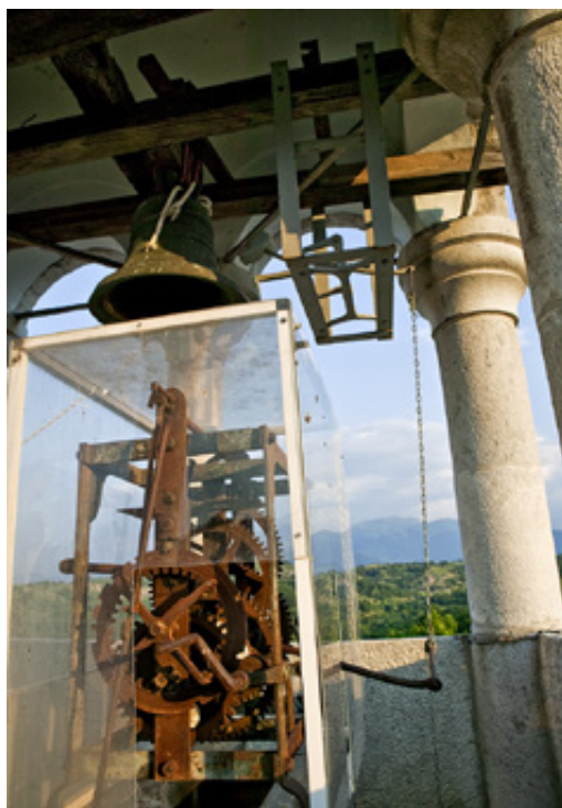
Ο κ. Σωκράτης δίπλα σε μία από τις δύο λαξευτές πέτρες που χρησιμεύουν στο κούρδισμα του ρολογιού. Μια σειρά από γρανάζια δημιουργούν τον μηχανισμό του ρολογιού του καμπαναριού.