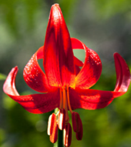
Lilium chalcidonicum , ένα από τα εντυπωσιακότερα αγριολούλουδα του Ολύμπου, που πολλές φορές χαρίζει ομορφιά και χρώμα στο μονοπάτι μας.