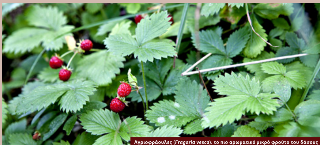
Αγριοφράουλες ( Fragaria vesca ): το πιο αρωματικό μικρό φρούτο του δάσους