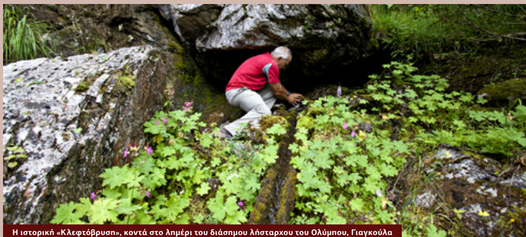
Η ιστορική «Κλεφτόβρυσ», κοντά στο λημέρι του διάσημου λήσταρχου του Ολύμπου, Γιαγκούλα

λέτη, έχουν καταγραφεί 182 είδη. Τα θηλαστικά είναι 34 , τα Πτηνά 129 , τα Ερπετά 14 και τα Αμφίβια 5 .