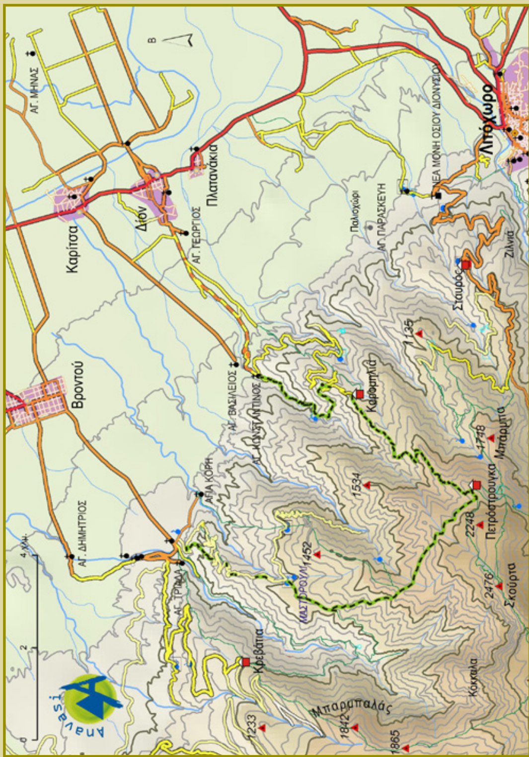
Χάρτης μέρους του Ολύμπου, ειδικά σχεδιασμένος για το άρθρο από τις εκδόσεις Ανάβαση