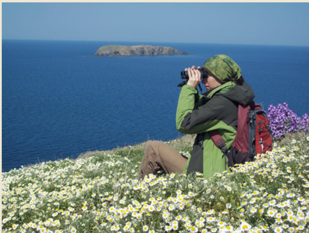
Fieldwork στη Σκύρο.

φθινόπωρο. Στη συνέχεια μεταναστεύει κι αυτός για να ξεχειμωνιάσει στη Μαδαγασκάρη και σε άλλα νησιά του Ινδικού Ωκεανού και στην ανατολική Αφρική. Επιστρέφει και πάλι στη χώρα μας τέλη Απριλίου και μέχρι να έρθει η στιγμή του φωλιάσματος μπορεί, εκτός από τα νησιά, να τον δούμε παντού στην Ελλάδα, ακόμη και στις κορυφές της Πίνδου. Την εποχή αυτή – όπως και το χειμώνα – ο Μαυροπετρίτης τρέφεται κυρίως με έντομα. Τζιτζίκια, ακρίδες, πεταλούδες, ιπτάμενα μερμήγκια, βρίσκονται σε αφθονία και έτσι βρίσκει άφθονη τροφή χωρίς να κουράζεται.