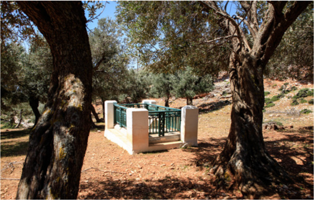
Το λιτό ταφικό μνημείο του RUPERT BROOKE πάνω από τις "Τρεις Μπούκες" και ο επιβλητικός ανδριάντας του ποιητή στην Χώρα, έργο του Τόμηρου (αριστερά, απέναντι).

Συνεχίζοντας στο κεντρικό οδικό δίκτυο συναντάμε έναν δεύτερο χωματόδρομο. Μας οδηγεί στην πανέμορφη, επίπεδη περιοχή « Βουκολίνα ». Στάνη με γιδοπρόβατα, μικρή σουβάλα με καφεκίτρινο νερό, τόπος πολύ ειδυλλιακός.