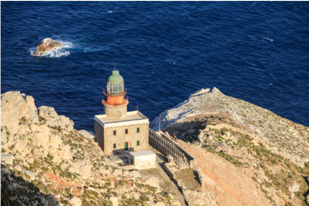
Το τελικό απαιτητικό μονοπάτι προς τον Φάρο.