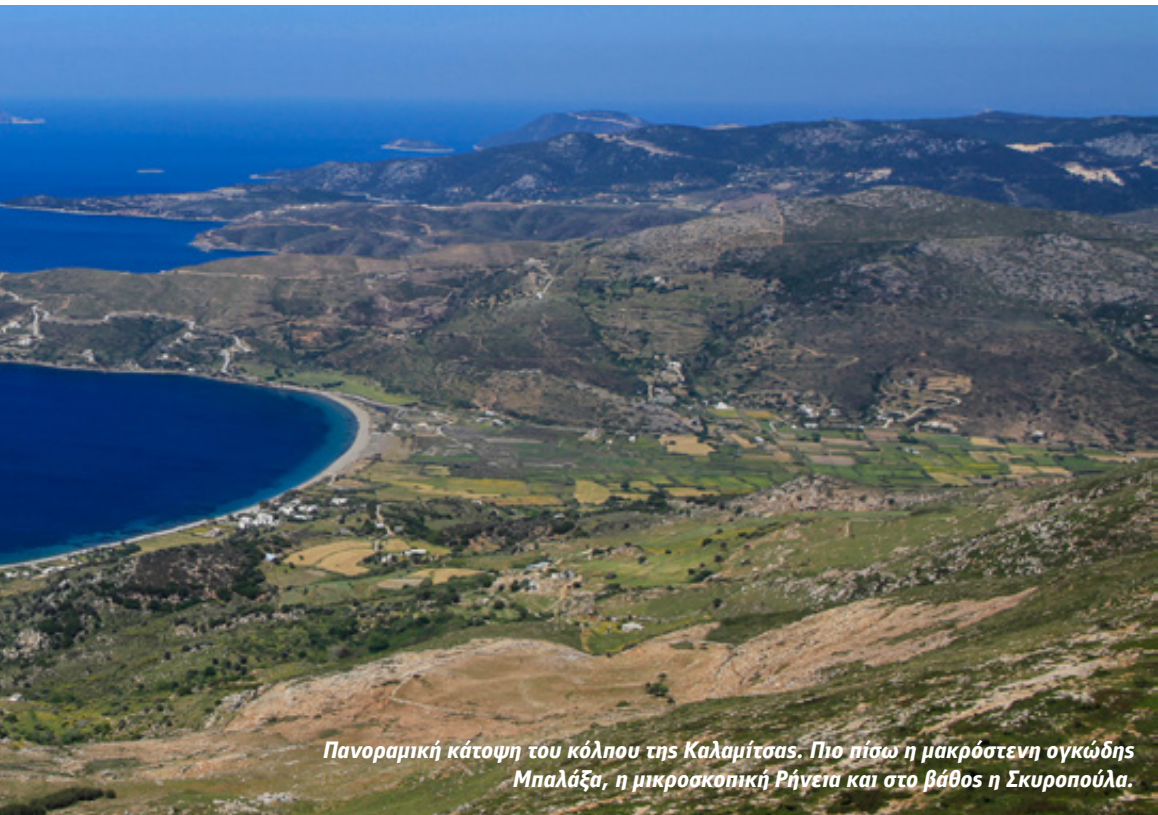
Πανοραμική κάτοψη του κόλπου της Καλαμίτσας. Πιο πίσω η μακρόστενη ογκώδης Μπαλάξα, η μικροσκοπική Ρήνεια και στο βάθος η Σκυροπούλα.

12:40' Δυο ώρες μετά την αναχώρησή μας από τον Κόχυλα φτάνουμε στη Διχούνια, που πήρε το όνομά της από τις δυο «χούνες», τις δυο ρεματιές που αυλακώνουν την πλαγιά. Χτισμένο στη σκιά μιας αιωνόβιας γκορτσιάς, το πανέμορφο ξωκκλήσάκι αγναντεύει από υψόμετρο 275 μέτρων την απεραντοσύνη του πελάγους. Αυτό όμως που το κάνει τόσο αγαπητό κι επιθυμητό είναι το εκπληκτικό νερό που