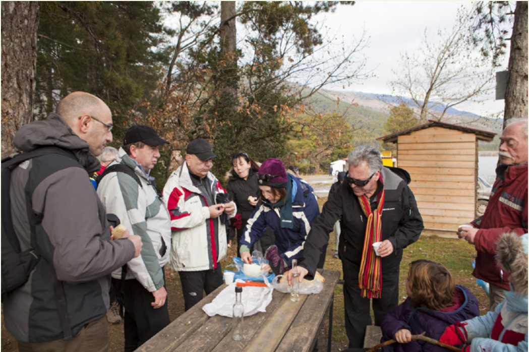
Τσιπουράκι, ζυμωτό ψωμί και γραβιέρα Φενεού στην όχθη της λίμνης Δόξας. Μικρή πρόγευση του γεύματος που μας περιμένει μετά την πεζοπορία στο μονοπάτι του Άμπουλα. Φωτιές και γαργαλιστικές τσίχνες μας υποδέχονται μετά την πεζοπορία στο μονοπάτι.