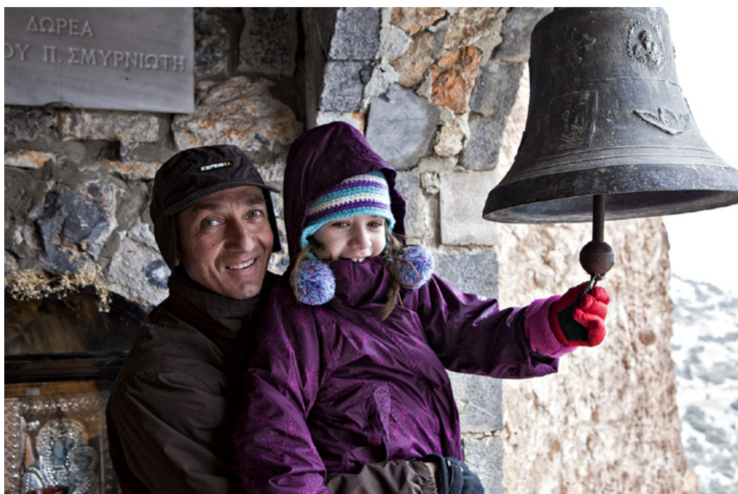
Παναγιά του Βράχου. Ασκηταριό και μοναστηράκι στη σχισμή του πελώριου βράχου. Χτύπημα της καμπάνας σε στιγμές απίστευτης τρυφερότητας.

Όλοι εντυπωσιάζονται από την συγκλονιστική μεγαλοπρέπεια των βράχων κι από το σπηλαιώδες μοναστήρι με το παλιό ασκηταριό. Επικρατεί παγωνιά. Μια παγωνιά που καθιστά επιβεβλημένη την -ούτως ή άλλως- προγραμματισμένη στάση μας στο καφενεδάκι της Βέτας , στην πλατεία του Ταρσού.