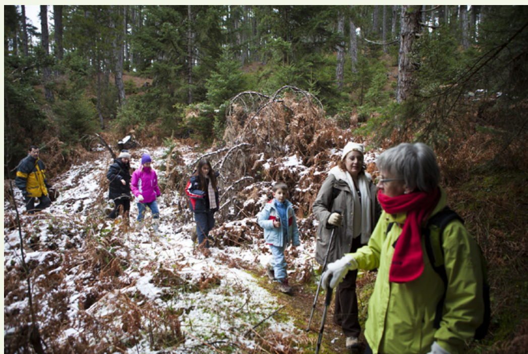
Δασικό μονοπάτι του Άμπουλα. Ελαφρά χιονισμένο και υπέροχο μέσα στα μαυρόπευκα.

άλλοι αφήνουν στους βλαστούς τους πλήρη ελευθερία. Τα μεγαλύτερα παιδιά κάνουν ποικίλες ερωτήσεις, ενδιαφέρονται κυρίως να μάθουν πού εξαφανίζονται τα νερά.