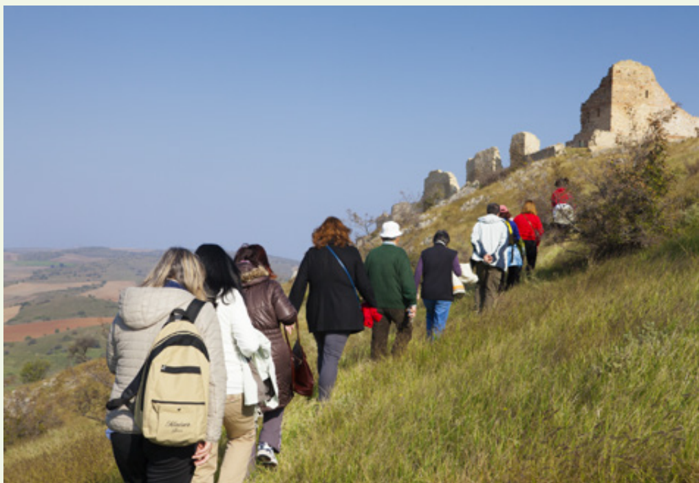
Επιχείρηση ειρηνικής κατάληψης του Γυναικόκαστρου.