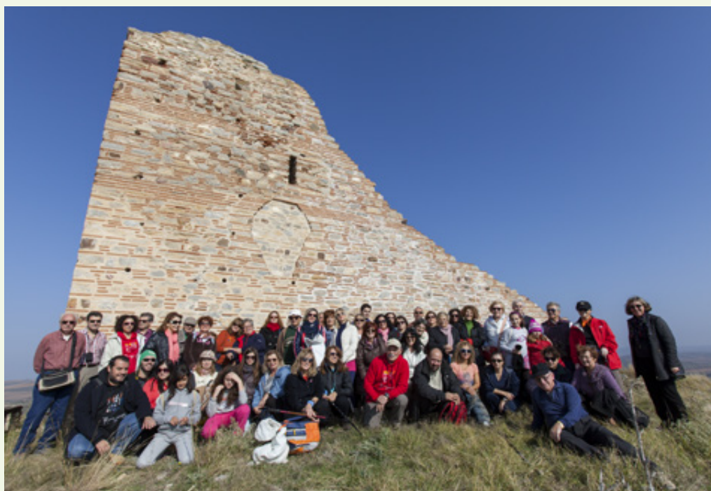
Οι «Έλληνες Περιηγητές» φωτογραφίζονται μπροστά στον Πύργο του Γυναικόκαστρου. Είναι ολοφάνερη η πλειοψηφία των γυναικών.

Ός προς την χρονολογία ανέγερσης του κάστρου, τοποθετείται στο 1328 από τον Ανδρόνικο Γ' Παλαιολόγο , σε μια από τις τελευταίες αναλαμπές της βυζαντινής αυτοκρατορίας. Ήταν μια προσπάθεια του νεαρού αυτοκράτορα να προφυλάξει τα εδάφη του, με την δημιουργία μικρών κάστρων και εγκατάσταση σ' αυτά φρουδαρχών, κατά το πρότυπο των δυτικών».