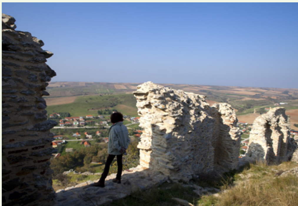
Κάτω από τις επάλξεις του Κάστρου, στον ήλιο κάμπο του Κιλκίς, απλώνεται νωχελικά ο οικισμός του Παλαιού Γυναικόκαστρου.

ναί ένας βράχος με αυτό το περίεργο σχήμα ή ανθρώπινη κατασκευή, που έχει υποστεί τη φθορά του χρόνου. Η αλήθεια βρίσκεται, όπως πάντα, κάπου στη μέση: οι βράχοι συμπληρώνουν την οχύρωση του κάστρου»!