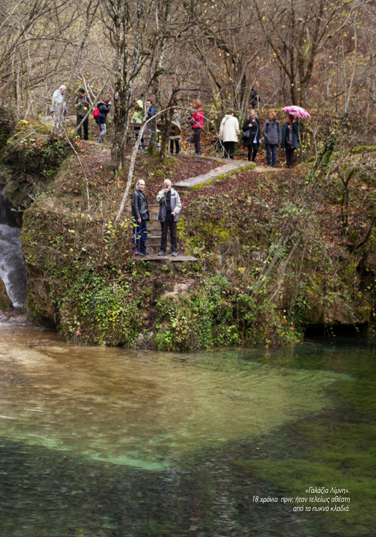
«Γαλάζια Λίμνη». 18 χρόνια πριν, ήταν τελείως αθέατη από τα πυκνά κλαδιά.