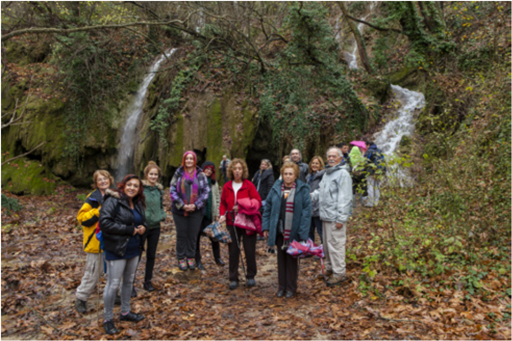
Ανάμεσα στους δύο αρχικούς καταρράκτες που τροφοδοτούν με τα νερά τους την Γαλάζια Λίμνη.