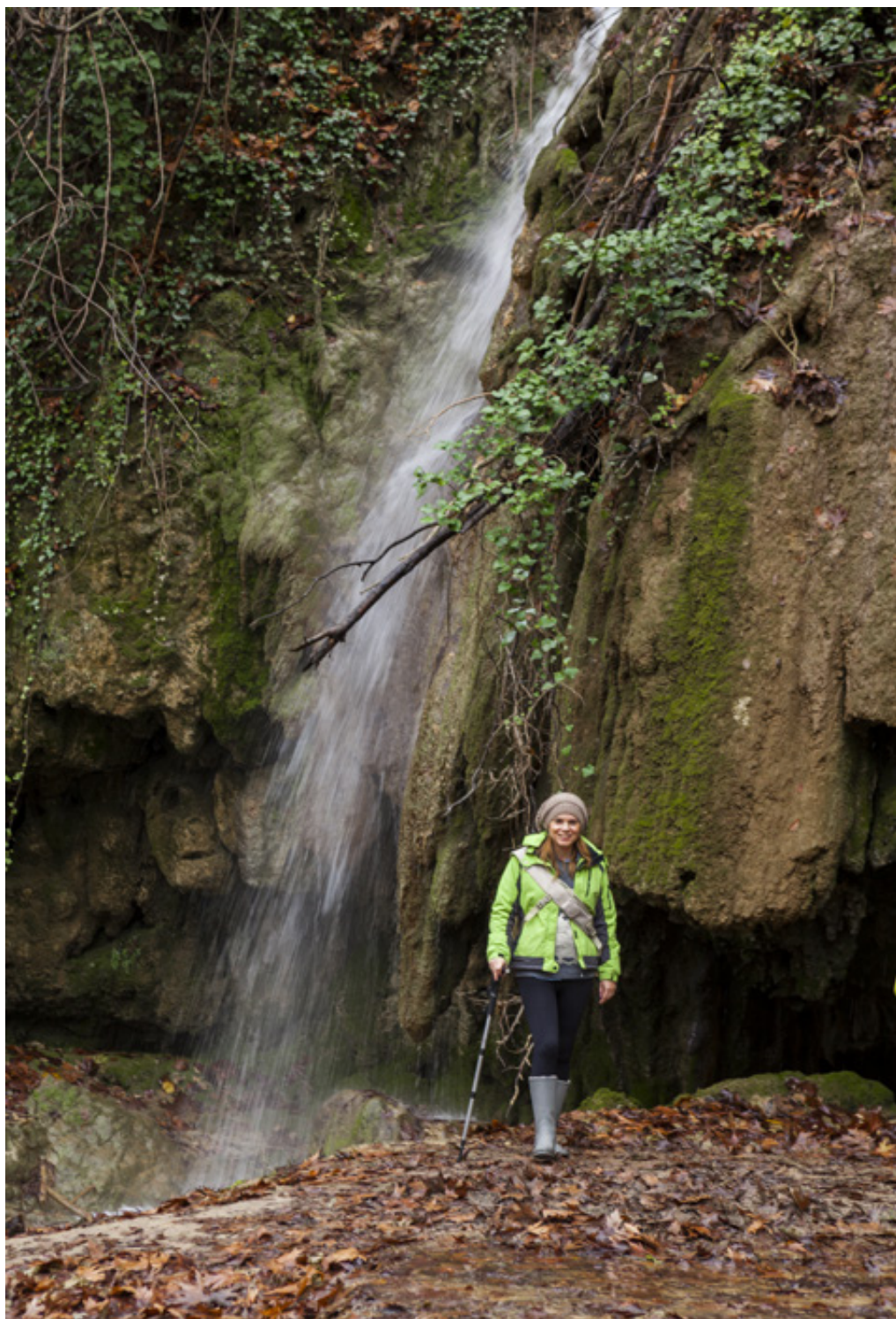
Μηροστά σε έναν από τους πολλούς καταρράκτες του Σκρα.