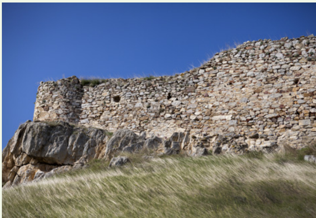
Ισχυρή τοικοποιΐα με αργολιθοδομή, συνδετικό κονίαμα και πλίνθους. Η κιστέρνα του Γυναικόκαστρου με την πέτρινη κλίμακα και το υδραυλικό κονίαμα. (Αριστερά)

από την αρχαιολογική υπηρεσία με τρόπο υποδειγματικό. Το καλύτερα διατηρημένο και αποκατεστημένο τμήμα του πύργου είναι το νότιο, με ύψος 12 περίπου μέτρων. Η τοικοδομία αποτελείται από συνδυασμό λίθων κυρίως ακανόνιστων και πολύ λίγων λαξευτών και γωνιόλιθων. Ενδιάμεσα υπάρχει συνδετικό κονίαμα με πλίνθους, οι οποίοι χρησιμοποιούνται επιπλέον και για την δημιουργία επαναλαμβανόμενων διακοσμητικών μοτίβων.