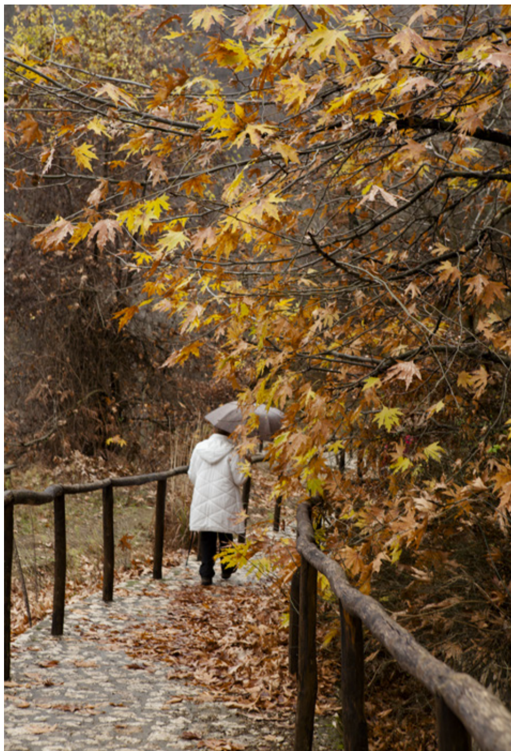
Έξοχη ανάπλαση του χώρου με λιθόστρωτο δρομάκι και ξύλινα καγκελάκια.