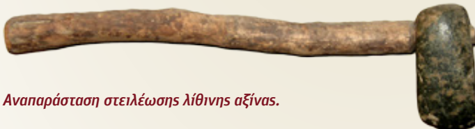
Αναπαράσταση στείλεωσης λίθινης αξίνας.