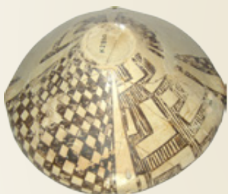
Επάνω: Πήλινη γραπτή φιάλη φάσης Κλασικό Διμήνι. Νεότερη Νεολιθική.