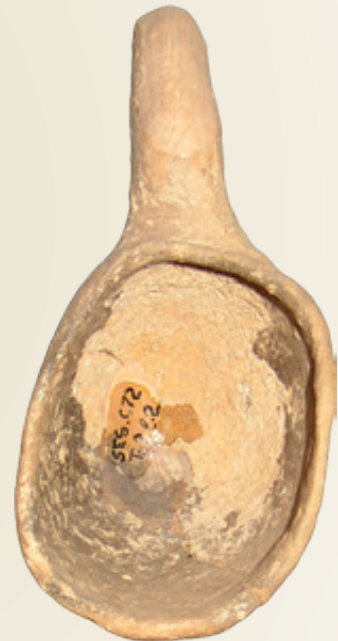
Επάνω: Πήλινη κουτάλα