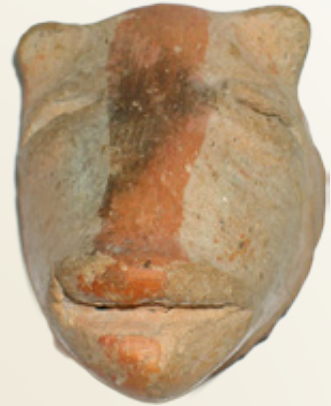
Κεφάλι πήλινου ειδωλίου βοοειδούς. Αρχαιότερη Νεολιθική.