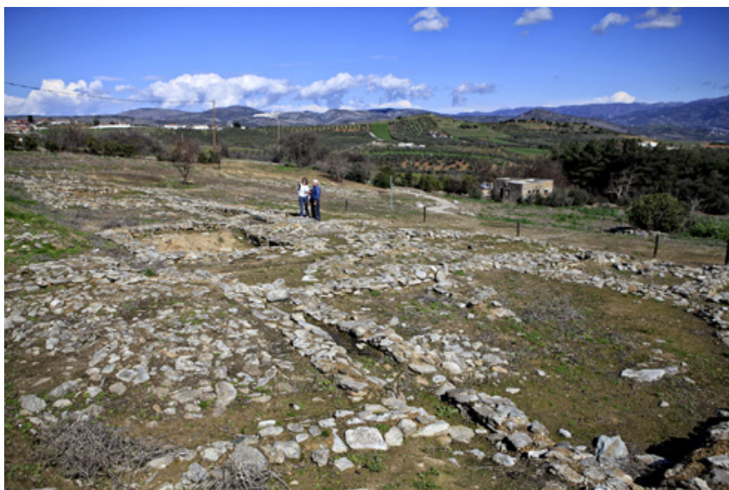
Άποψη από την επίσκεψη στο δυτικό τμήμα του επισκέψιμου χώρου, το λεγόμενο Σέσκλο Β.

ανοικοδομούνται στην ίδια θέση κι έτσι σταδιακά δημιουργείται ένας γύλοφος, η γνωστή «μαγούλα», ενώ έχουν όλα περίπου τον ίδιο προσανατολισμό. Το μέγεθός τους ποικίλει από 20 ως 70 τ.μ. Στενά δρομάκια ανάμεσά τους, σχηματίζουν σε ορισμένα σημεία πλατείες.