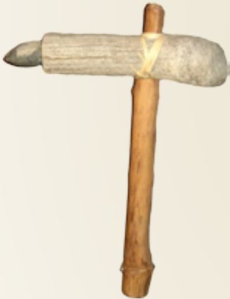
Αριστερά: Αναπαράσταση στείλεωσης λίθινης αξίνας.