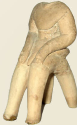
Επάνω: Ειδώλιο καθιστής ανδρικής μορφής.