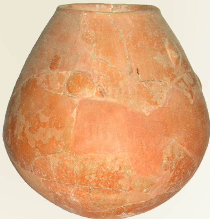
Μονόχρωμο κλειστό αγγείο.