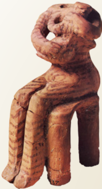
Ειδώλιο καθιστής γυναικείας μορφής με παιδί (Κουροτρόφος). Νεότερη Νεολιθική.