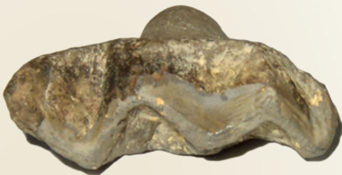
Επάνω: Πήλινη σφραγίδα.