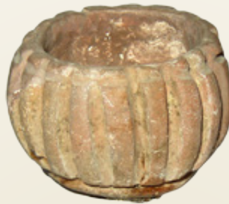
Μικρογραφικό ημισφαιρικό αγγείο.