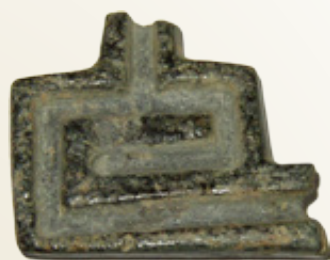
Επάνω, από αριστερά προς δεξιά: 1. Γραπτό αγγείο, Μέση Νεολιθική, 2. Γραπτό αγγείο, Μέση Νεολιθική, 3. Λίθινη σφραγίδα.