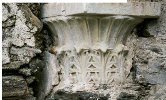
Λεπτομέρειες αρχιτεκτονικών μελών από το εσωτερικό της Παλαιοχριστιανικής Βασιλικής του Ταξιάρχη στο Μηλιωπό.

Το κάστρο πρέπει να είναι βυζαντινό του 10ου - 11 ου αιώνα, η τείχισή του είναι ισχυρή και κυμαίνεται από 1,5-2 περίπου μέτρα.