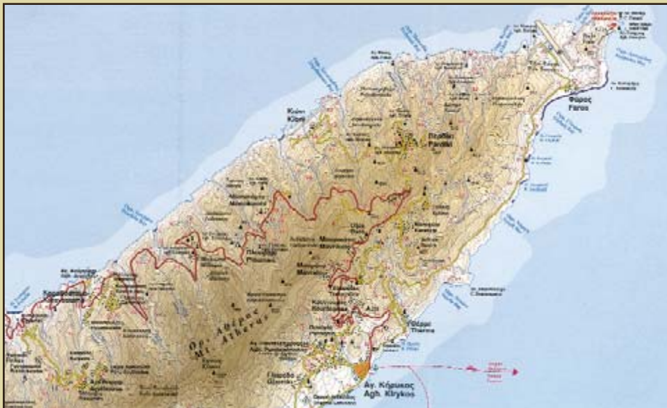
Τμήμα από τον χάρτη "ΙΚΑΡΙΑ - ΦΟΥΡΝΟΙ" 1 : 50.000 των εκδόσεων Road.

Δημαρχείο Αγ. Κήρυκου: Γραμματεία Τηλ. 2275022298 Γραφ. Δημάρχου Τηλ. 22750 22215 Γραφ. Τουρ. Πληρ. Τηλ. 22750 24047 Λιμεναρχείο Τηλ. 22750 22207 Αστυνομία Τηλ. 22750 22222-22944 Πληρ. Διαμονής Τηλ. 22750 24047 Κ.Ε.Π. Τηλ. 22750 22202