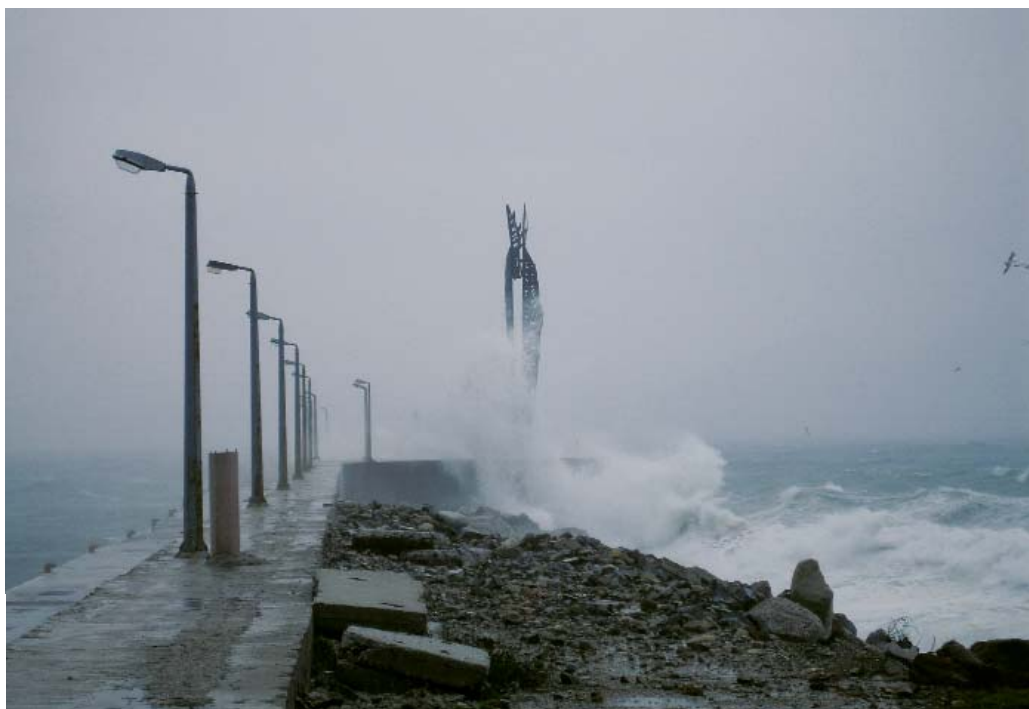
Μάρτης του 2006. Η γλυπτική σύνθεση του Ίκαρου στο έλεος των κυμάτων.(Επάνω) Ένα τμήμα από τον αμφιθεατρικό οικισμό του Αγ. Κήρυκου.