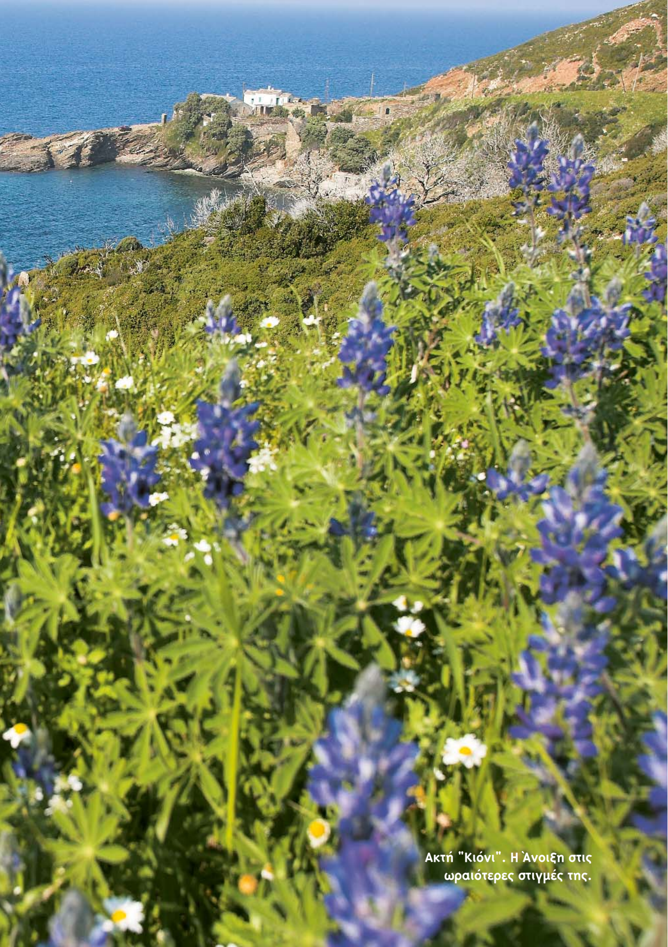
Ακτή "Κιόνι". Η Άνοιξη στις ωραιότερες στιγμές της.