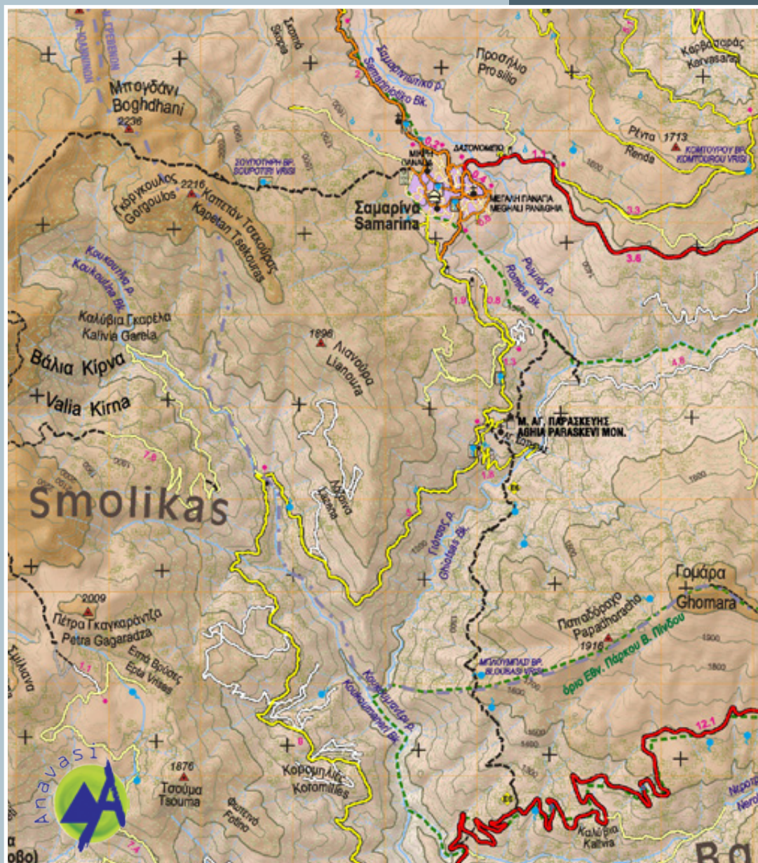
Τμήμα του χάρτη Γράμμος - Σμόλικας - Βασιλίτσα 1:50.000 των εκδόσεων Anavasi, www.anavasi.gr