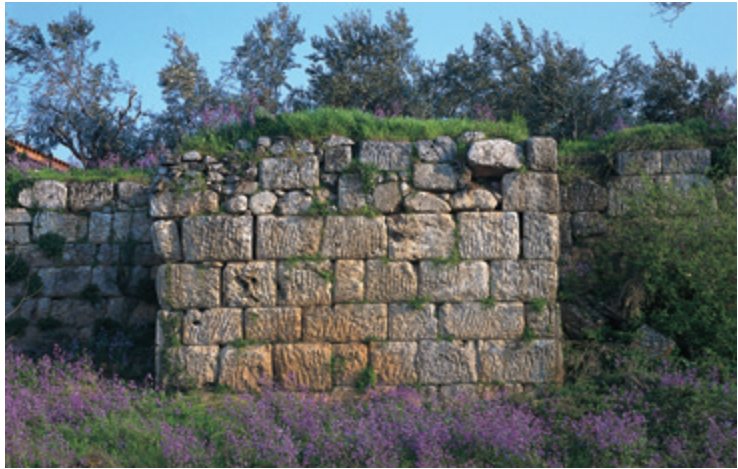
Τα τείχη, ο πύργος, οι πολεμίστρες, φτιαγμένα από τεράστιους ογκόλιθους, ενσωματώνονται σήμερα στα σπίτια του χωριού.

Α νηφορίζοντας προς το χωριό, συνειδητοποιούμε ότι θα πρέπει να βρισκόμαστε στα ίχνη του μονοπατιού E-65 που οδηγεί προς τα υψώματα του Παρνασσού. Όμως πριν βρούμε το μονοπάτι, "πέφτουμε" πάνω στα τείχη της Τιθορέας. Είναι εντυπωσιακά όπως παρουσιάζονται μπροστά μας ανάμεσα σε σπίτια που τα ακουμπούν, ή ακόμα και χρησιμοποιούν τις πλευρές τους για αυλόγυρο. Ξεχωρίζουν μόνο οι πύργοι. Κάποτε αποτελούσαν το οχυρό της αρχαίας πόλης που την περιτριγύριζαν προστατευτικά. Είναι φτιαγμένα από λαξευμένους ογκόλιθους οι οποίοι συνεχίζουν το οχυρωματικό έργο των απόκρημνων βράχων όπου αυτοί χαμηλώνουν. Τα αναφέρει ο Πλούταρχος και ο Παισαρνιάς και