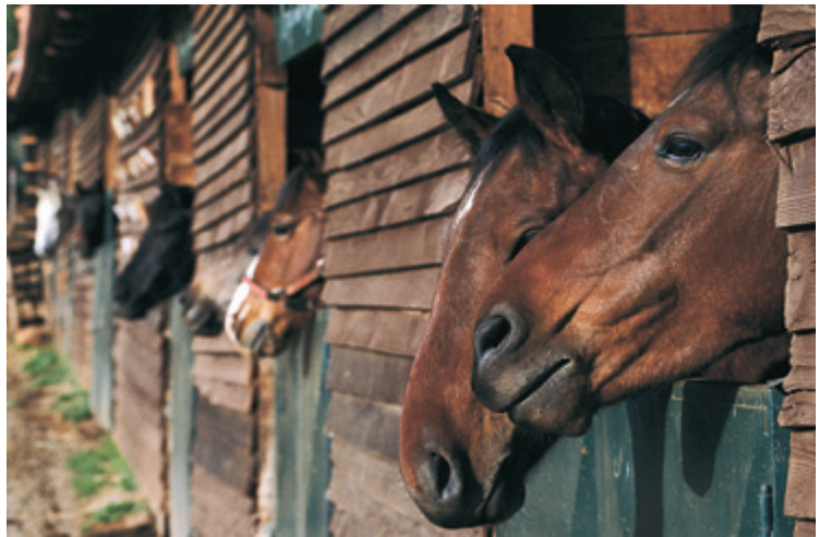
Τα Θεσσαλικά άλογα στους στάβλους. (Επάνω) Ο Θεσσαλός μας κοιτάζει λίγο καχύποπτα από το "παράθυρό" του.

ανθεκτικά, ικανά να σκαρφαλώνουν, ψάχνοντας για τροφή, στις δύσβατες πλαγιές όπου τα εγκατέλειπαν μόνα τους κάθε χειμώνα οι ντόπιοι, αλλά εκείνα τα κατάφεραν να επιβιώσουν. Τώρα κι αυτά έχουν πάρει το δρόμο της εξαφάνισης παρόλο που οι ειδικοί μας λένε πως είναι πολύ χαρισματικά, αφού παλιότερα