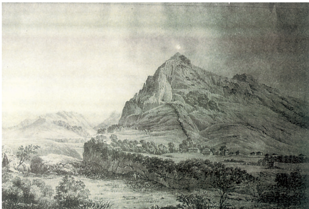
Το τείχος της Τιθόρας όπως το είδε ο Dodwell στα 1805.