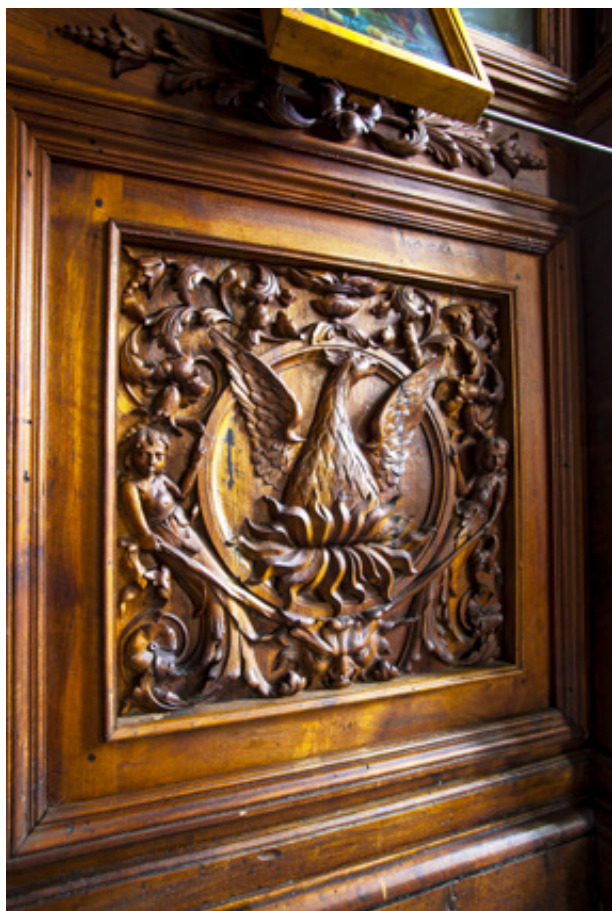
Λεπτομέρειες από το εσωτερικό του Αη-Γιώργη. Ξυλόγλυπτο σε ξύλο καστανιάς του Βασίλη Σκαλιστή από το "Τούρνοβο" και πολύ ιδιαίτερες τοιχογραφίες του Σέρβου καλλιτέχνη Μιλτιάδη Νικόλιτς.