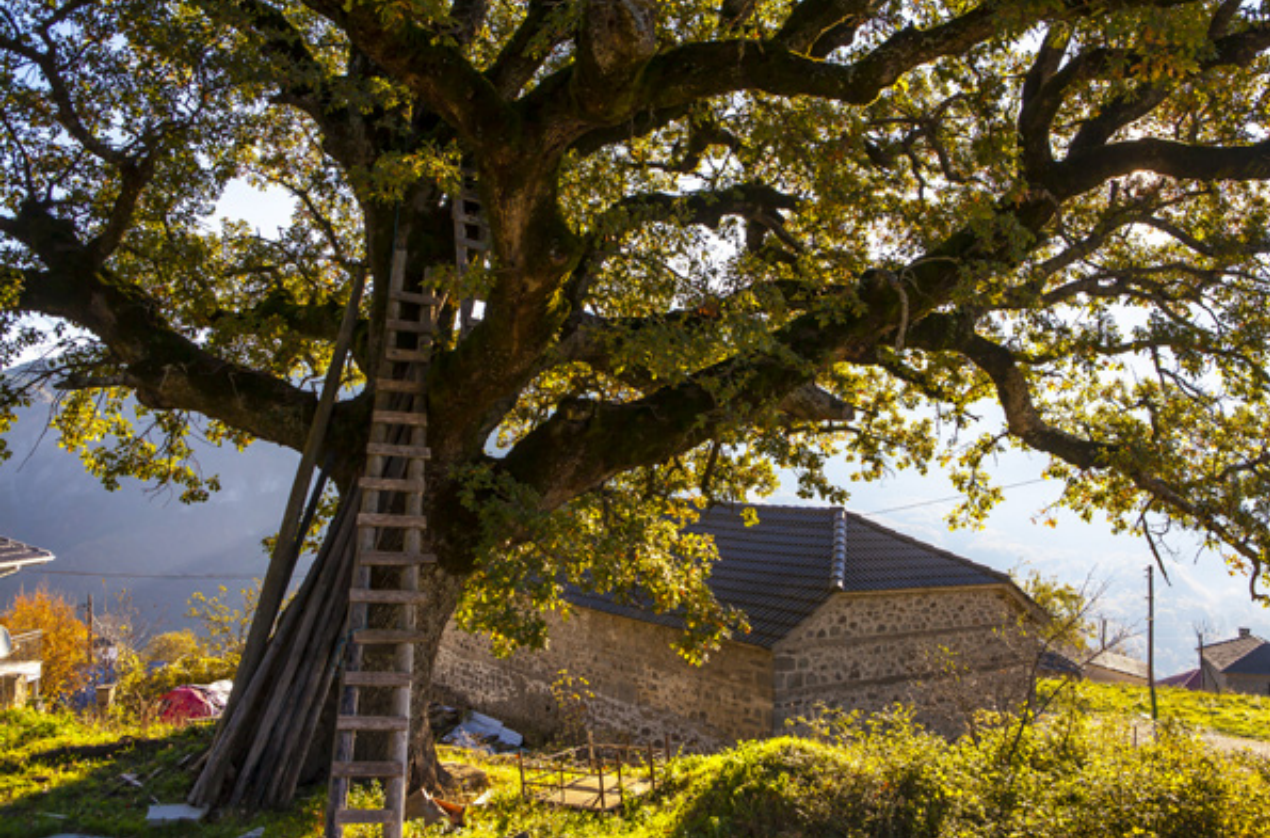
Αιωνόβια δρυς πάνω από το εκκλησάκι του Αγίου Αθανασίου. Κατηφορίζοντας πλακόστρωτα στενορρόμια από τον "Πέρα Μαχαλά".