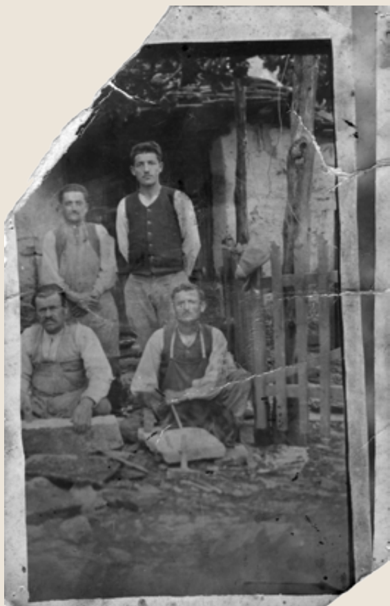
Πωγωνιανή (παλιά Βοστίνα). Πυρσογιαννίτες μαστόροι το 1932.

της Πυρσόγιαννης στον 16ο αιώνα. Θεωρείται, ωστόσο, πιθανόν ότι έχει προγενέστερο παρελθόν.