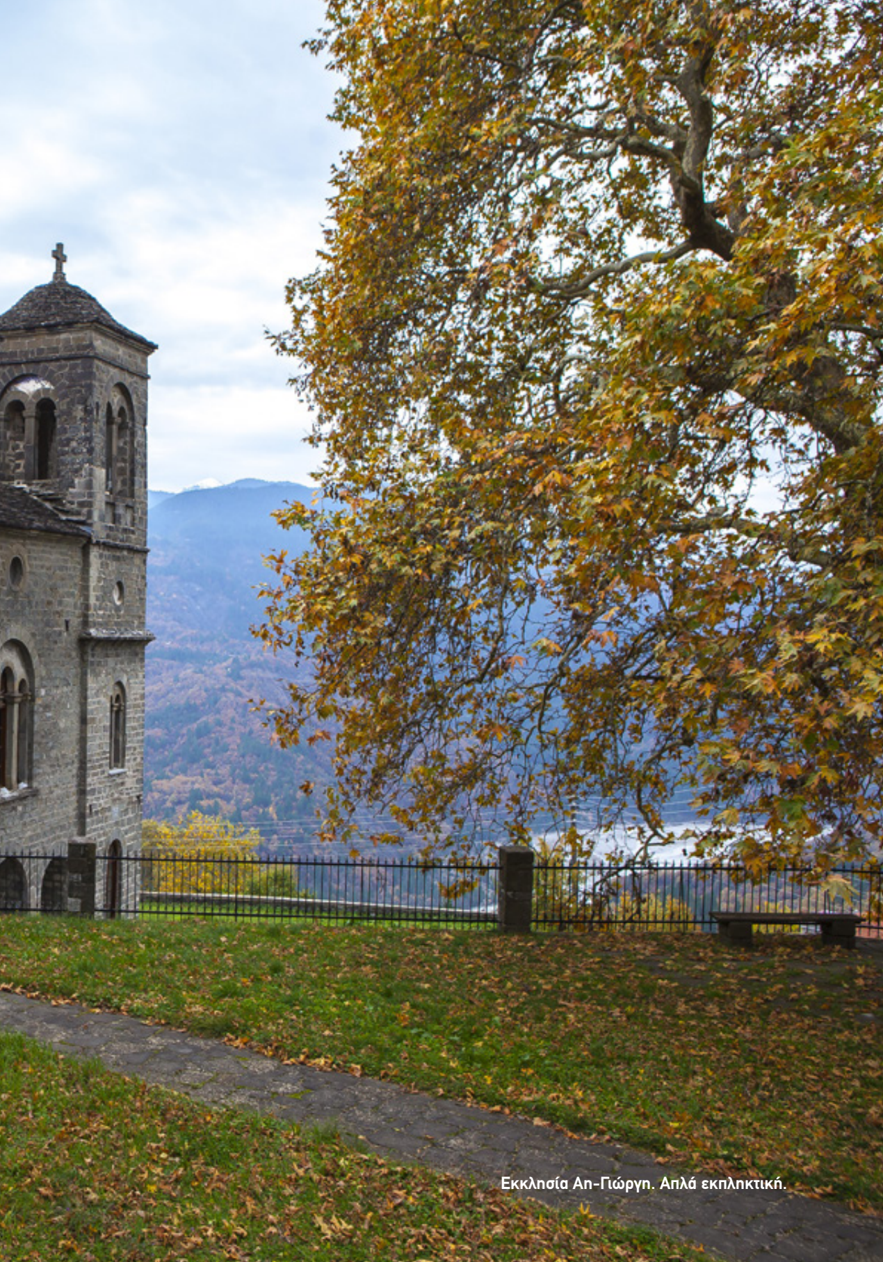
Εκκλησία Αγ-Γιώργη. Απλά εκπληκτική.