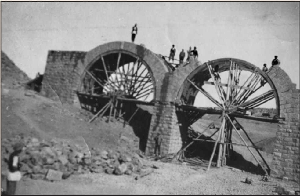
Πυρσογιαννίτες και Στρατσιανίτες μαστόροι χτίζουν στην Περσία τη γέφυρα Γκιρντανέ στο 120 χλμ της σιδηροδρομικής γραμμής Κουμ - Τεχεράνης.

τόπους της Αλβανίας. Την ίδια περίοδο τους βρίσκουμε στην περιοχή της Λαμίας και Δομοκού στην Ορεινή Ναυπακτία και Καρπενήσι.