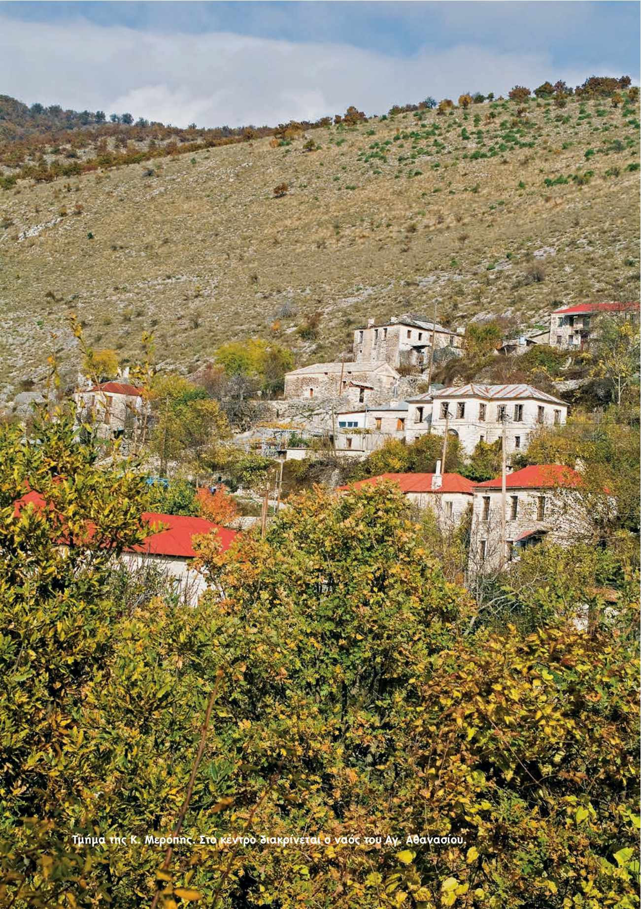
Τμήμα της Κ. Μερόνης. Στο κέντρο διακρίνεται ο ναός του Αγ. Αθανασίου.