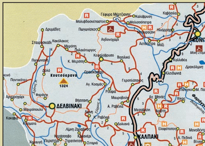
Τμήμα από τον χάρτη "Νομός Ιωαννίνων", Δ.Ε.Τ.Α.Ι.

ΞΕΝΩΝΑΣ ΠΑΝΟΡΑΜΑ/ ΩΡΑΙΟΚΑΣΤΡΟ Τηλ. 26570 41440, 6945 851131 (Σχίζας Δημ.)