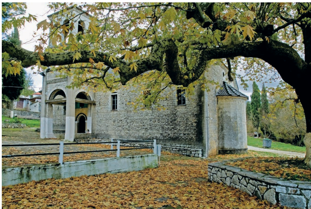
Αυθεντική φθινοπωρινή εικόνα στην πλατεία του Ωραιοκάστρου με τον ναό της Θεοτόκου.

Στον όροφο του οικήματος στεγάζεται το πολύ περιποιημένο Πολιτιστικό Κέντρο, όπου εκτίθεται παραδοσιακή Πωγωνία στολή, βιβλιοθήκη, πολλές φωτογραφίες από το παρελθόν του χωριού και ποικιλία παλιών σκευών. Παραδίπλα ορθώνεται ένα εξαιρετο αρχοντικό, διώροφο και μακρόστενο.