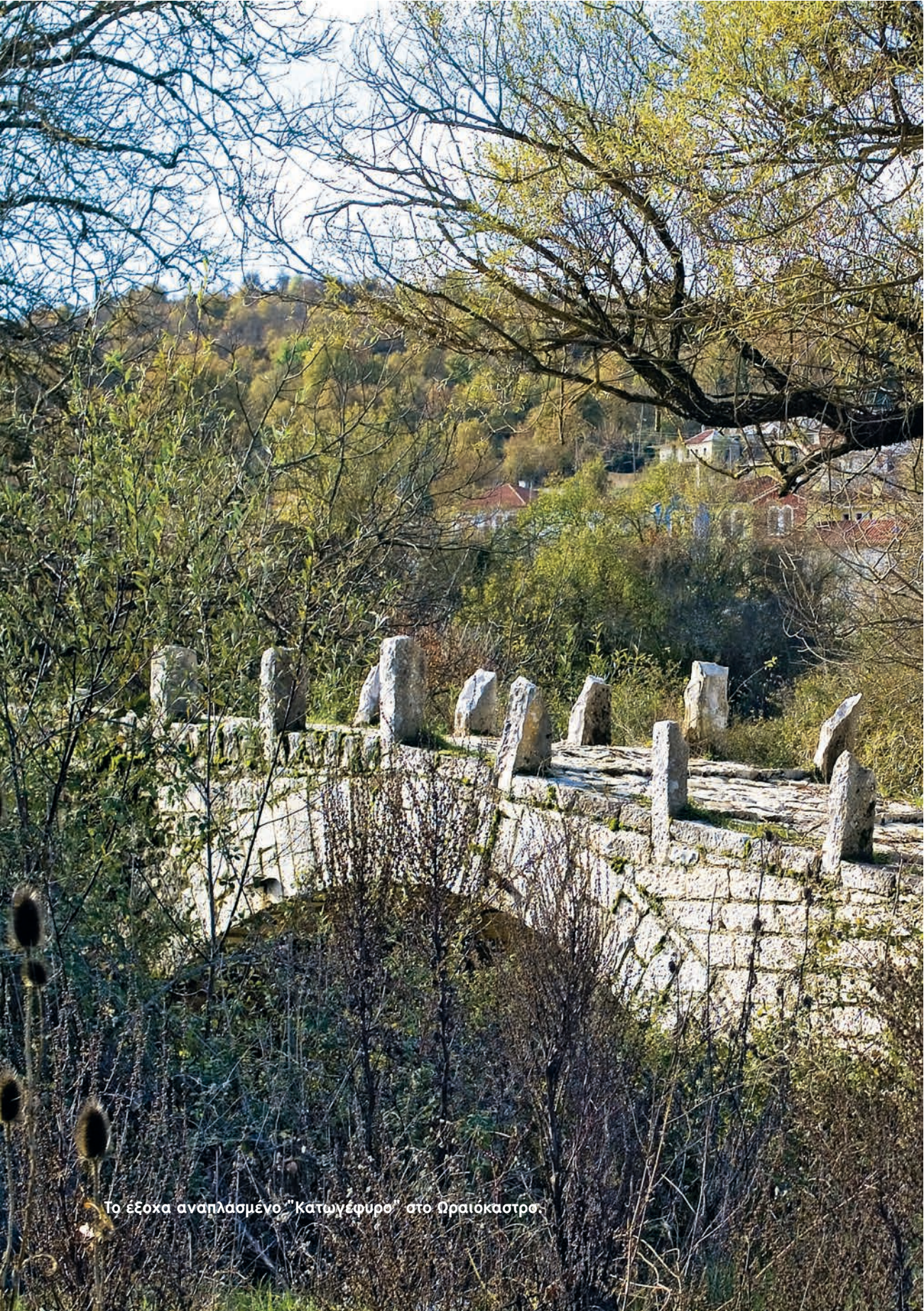
Το έξοχα αναηλασμένο "Κατωγέφυρο" στο Ωραιόκαστρο.