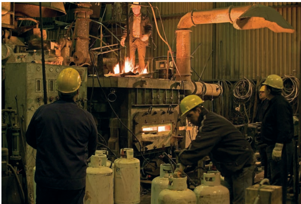
Προθέρμανση του φούρνου αναμονής πριν από τη μετάγγιση του χαλκού. (Επάνω) Η μετάγγιση χαλκού από το φούρνο τήξης στο φούρνο αναμονής σε πλήρη εξέλιξη.

Στην ενημερωτική επίσκεψη της προηγούμενης μέρας ο χώρος του χυτηρίου ήταν ήρεμος, αφού ο φούρνος τήξης του μετάλλου τελούσε ακόμη σε φάση προθέρμανσης. Σήμερα τα πάντα είναι διαφορετικά: ζέστη, ατμοί, αναμονή και ένταση διάχυτες στον