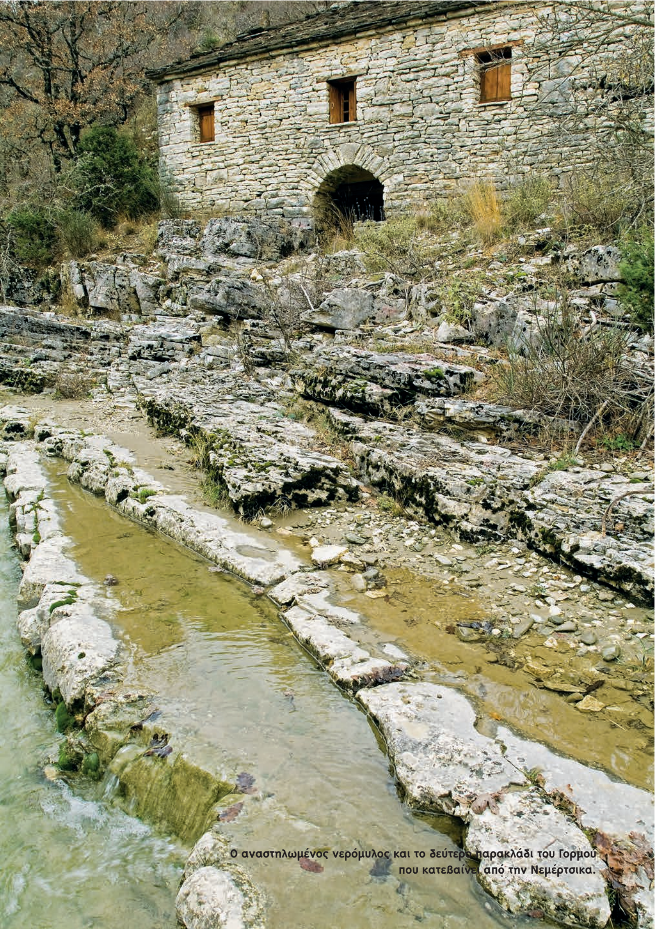
Ο αναστηλωμένος νερόμυλος και το δεύτερο παρακλάδι του Γορμού που κατεβαίνει από την Νεμέρτσικα.