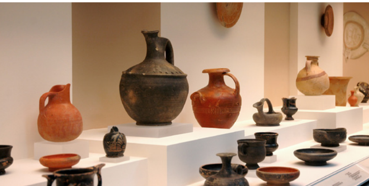
Μουσείο Αιανής, Αίθουσα ΣΤ. Προθήκη με αγγεία από τάφους του Ανατολικού Νεκροταφείου των ελληνιστικών χρόνων.

6 ου και στις αρχές του 5ου αι. π.Χ. και συνεχίζονται αδιάλειπτα ως τα υστεροελληνιστικά χρόνια, οπότε εγκαταλείπεται μάλλον ειρηνικά η πόλη και μετατοπίζεται σε άλλο χώρο, προφανώς με την επικράτηση των Ρωμαίων.