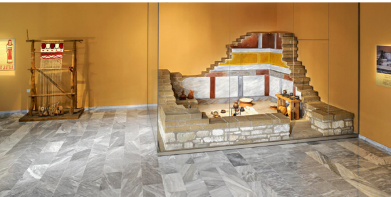
Μουσείο Αιανής, Αίθουσα Γ. Αναπαράσταση Δωματίου Γ της οικίας με τη συμβατική ονομασία «Σπίτι με Σκάλες». Αριστερά διακρίνεται η αναπαράσταση του αργαλειού.

γνώσεις των αρχαίων κατοίκων της στην κατασκευή μεγάλων και μνημειακών έργων. Τα κτήρια, με τις συμβατικές ονομασίες "Μεγάλοι Δόμοι" και "Στωϊκό Κτήριο", τα χαρακτηρίζουν χώροι με στοές και παρά την διαρπαγή, ιδιαίτερα των μαρμάρινων αρχιτεκτονικών μελών, διασώζουν κομμάτια από ζωγραφιστές υδρορρόδες, δωρικά κιονόκρανα από το 470-460 π.Χ. και ιωνικά από το 430-420 π.Χ., καθώς και σφονδύλους ημικιόνων. Αυτά προϋποθέτουν την ύπαρξη πρώτου ορόφου και μαρτυρούν τη μεγαλοπρέπεια και τη σωστή αρχιτεκτονική οργάνωση του χώρου.