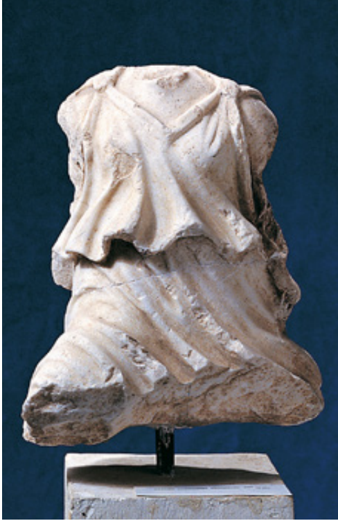
Μαρμάρινο άγαλμα Νίκης από ακρωτήριο αετώματος της αρχαίας Αιανής, κλασικών χρόνων.