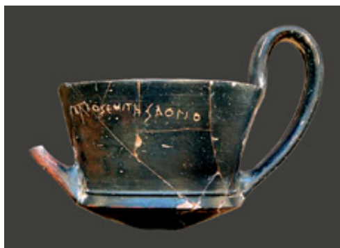
Ενεπίγραφος κώνθαρος από τη Βασιλική Νεκρόπολη, τέλη 6ου αι. π.Χ.

Η Έκθεση του Μουσείου Αιανής περιλαμβάνει σε 6 αίθουσες ευρήματα από την αρχαία Αιανή και τη χώρα της, ενώ η 7 η αίθουσα προορίζεται για προσωρινές εκθέσεις ευρημάτων από τον Νομό Κοζάνης.