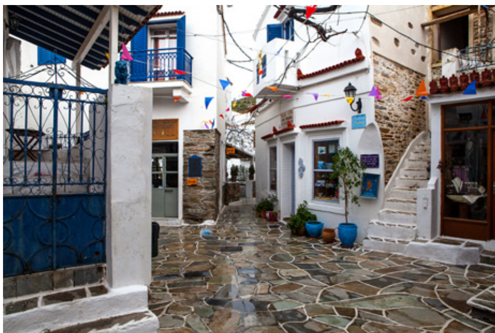
Μικροσκοπικό, πλακόστρωτο πλατειάκι στην Δρουσιίδα. (αριστερά) Δρομάκια στρωμένα με πλάκες ποικίλων χρωματισμών συνδυάζονται αρμονικά με τους γκριζογάλανους χρωματικούς τόνους στους τοίχους των σπιτιών.

10:50. Ένας τοιμεντόδρομος μας οδηγεί στην Παναγία την Καλολιβαδιανή , με το κελαρικό της, τον πλακόστρωτο αύλειο χώρο και το πηγάδι. Εξαιρετική είναι η θέα, στην γύρω φύση αλλά και στην θάλασσα που, μερικά μέτρα χαμηλότερα, βρυχάται με τα αφρισμένα κύματα του λεβάντε. Να κι ένα αλωνάκι εξαφανισμένο μέσα στα χόρτα, ενώ 100 μέτρα μετά, απλώνονται τα σπίτια του παραθεριστικού οικισμού του Καλολιβαδιού. Ως εδώ, τα στοιχεία της διαδρομής δείχνουν απόσταση 3.8 χλμ και καθαρό χρόνο πορείας 57' . Καθώς διασχίζουμε την παραλία ο πελαγίσσιος αέρας μας φέρνει τις πρώτες σταγόνες της βροχής. Επιστρατεύονται αδιάβροχα και κουκούλες. Αμέσως μετά τον οικισμό αρχίζουν ανηφοριές. Είναι το πιο τραχύ μέχρι τώρα, το δυσκολότερο μονοπάτι. Στενό και απότομο, με ψηλά χόρτα που κρύβουν τις πέτρες. Αγκαθωτοί θάμνοι και πυκνά κλαδιά θεριεμένων σπάρτων δυσκολεύουν τα βήματά μας.