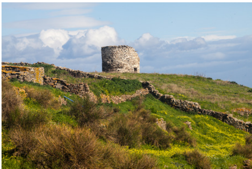
Πέτρινος ανεμόμυλος, ένας από τους πολλούς στον λόφο, πάνω από την Δρυοπίδα. Η «Ξέρα του Μέρικα», στο έλεος του μαΐστρου.

χες του Κακόβουλου και πιο βόρεια ακόμη, οι αβυσσαλοί γκρεμοί του θρυλικού κάστρου της Ωριάς. Και είναι, βέβαια, οι «συρμοί», τα υπέροχα μονοπάτια, τόσο σοφά οριοθετημένα ανάμεσα στα δεκάδες χιλιόμετρα των ξερολίθινων φρακτών, που αποτελούν αληθινό μνημείο μαστοριάς, πείσματος και υπομονής των Θερμιωτών.