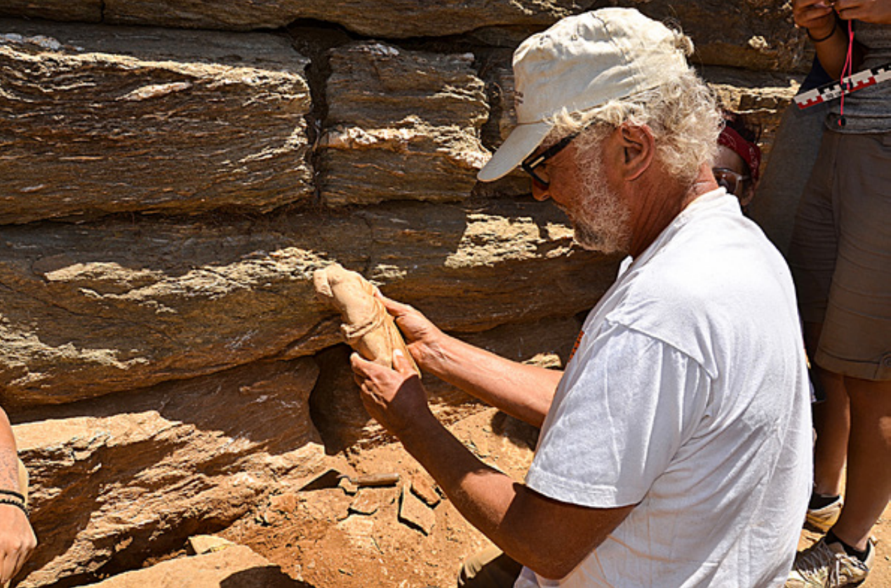
Στιγμιότυπο από την ανακάλυψη του μαρμάρινου αγαλμάτιου ημίγυμνης Αφροδίτης.

Μια θέση της Πρωτοκυκλαδικής ΙΙ Περιόδου (3 η χιλιετία π.Χ.) ερευνήθηκε στην θέση « Σκουριές ». (10) Εκεί βρέθηκαν 20 περίπου κυκλικές κατασκευές, που θεωρούνται στέγαστρα μεταλλευτικών κλιβάνων για την εκκαμίνευση χαλκού.