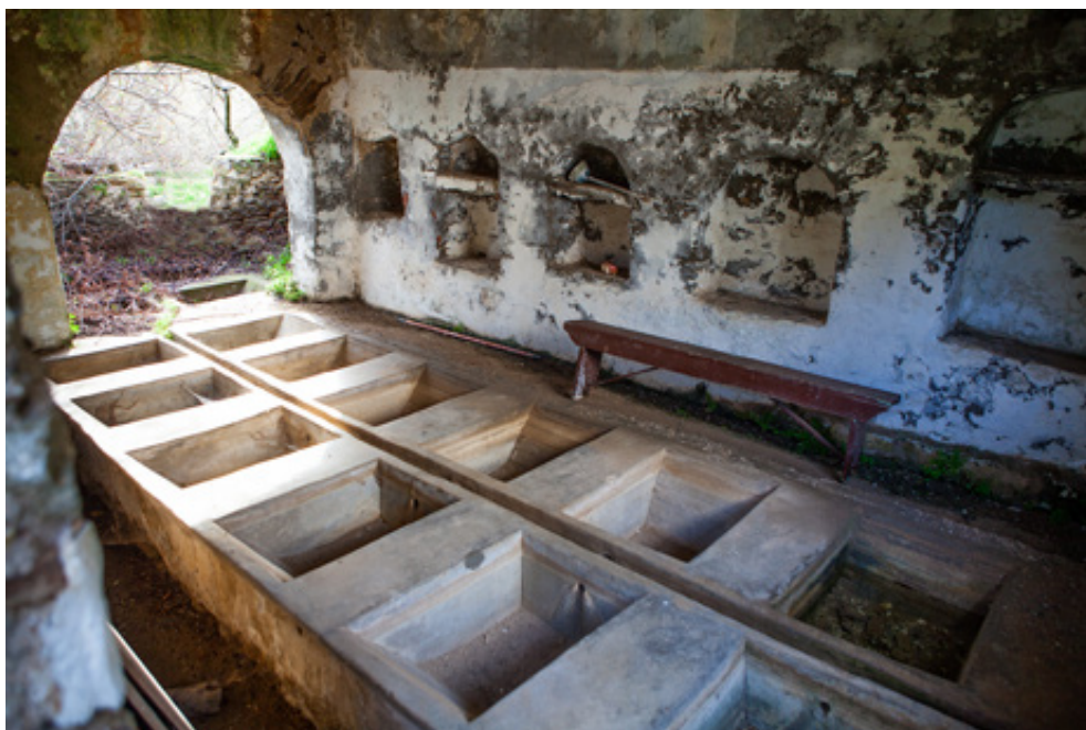
Στα σκεπασμένα «Πλεισταριά του Μαθά», όπου άλλοτε έπλεναν τα ρούχα οι γυναίκες της Δρυοπίδας. Στο γραφικό ξωκκλήσι της Παναγιάς του Μαθά (αριστερά)