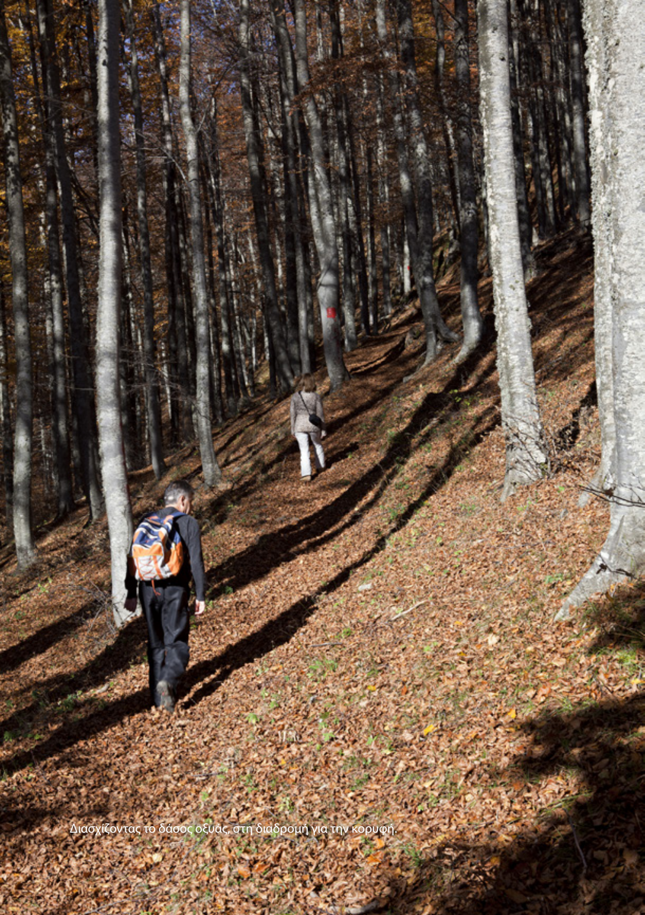
Διασχίζοντας το δάσος οξυάς, στη διαδρομή για την κορυφή.