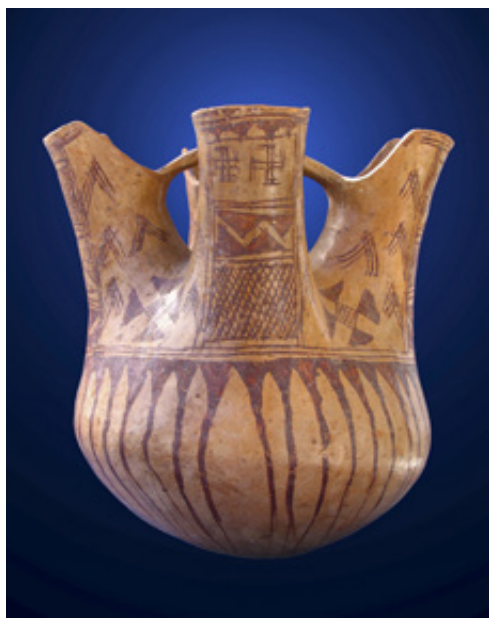
Ένα από τα κεραμικά αγγεία που βρέθηκαν κατά την ανασκαφή στην Νεκρόπολη τύμβων.

των βάλτων. Σαφής είναι τέλος η προτίμσή τους στις ανοικτές επιφάνειες των χαμπλών εκτεταμένων εξαρμάτων και στις ομαλές πλαγιές γυλόφων ή ορεινών σχηματισμών.