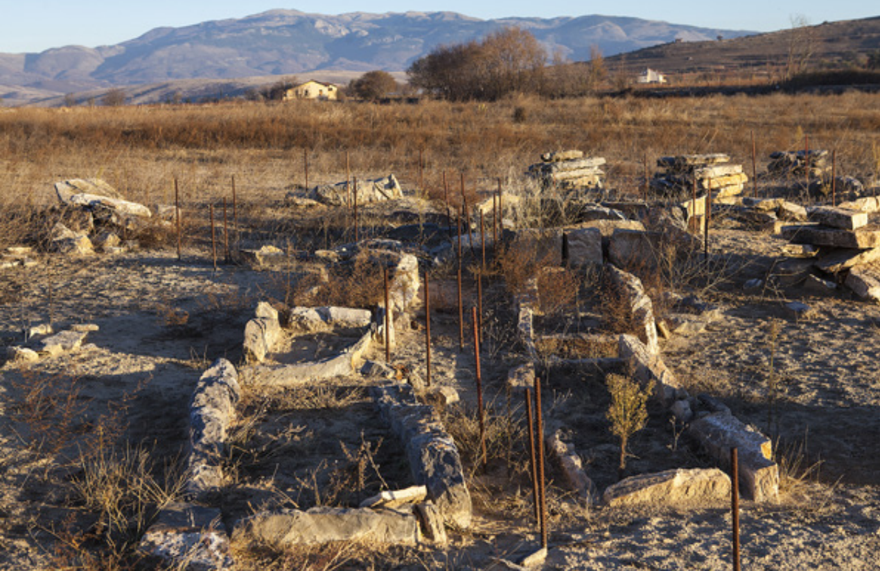
Τμήμα από τον μεγάλο αριθμό των τάφων στην Νεκρόπολη τύμβων.