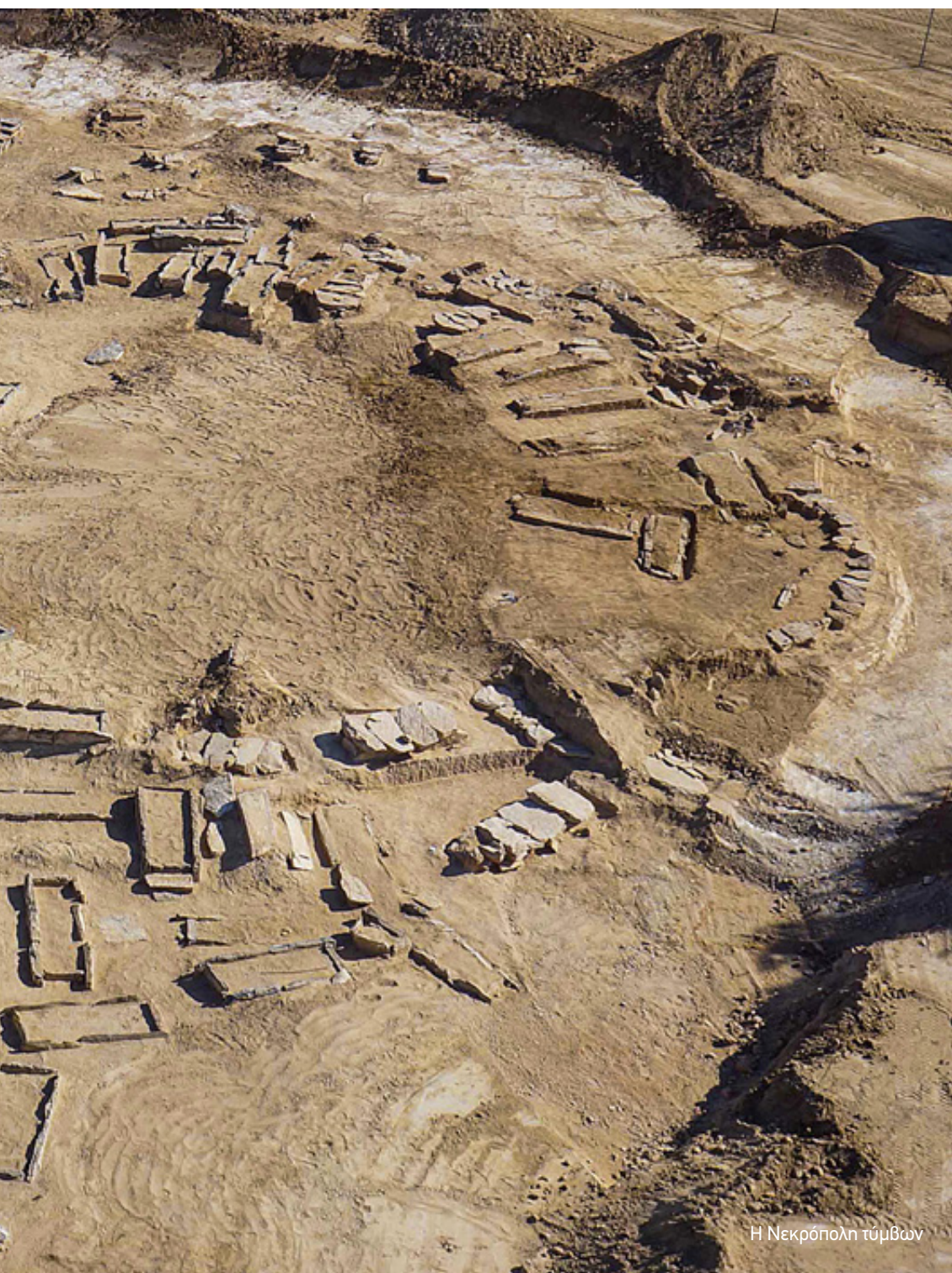
Η Νεκρόπολη τύμβων