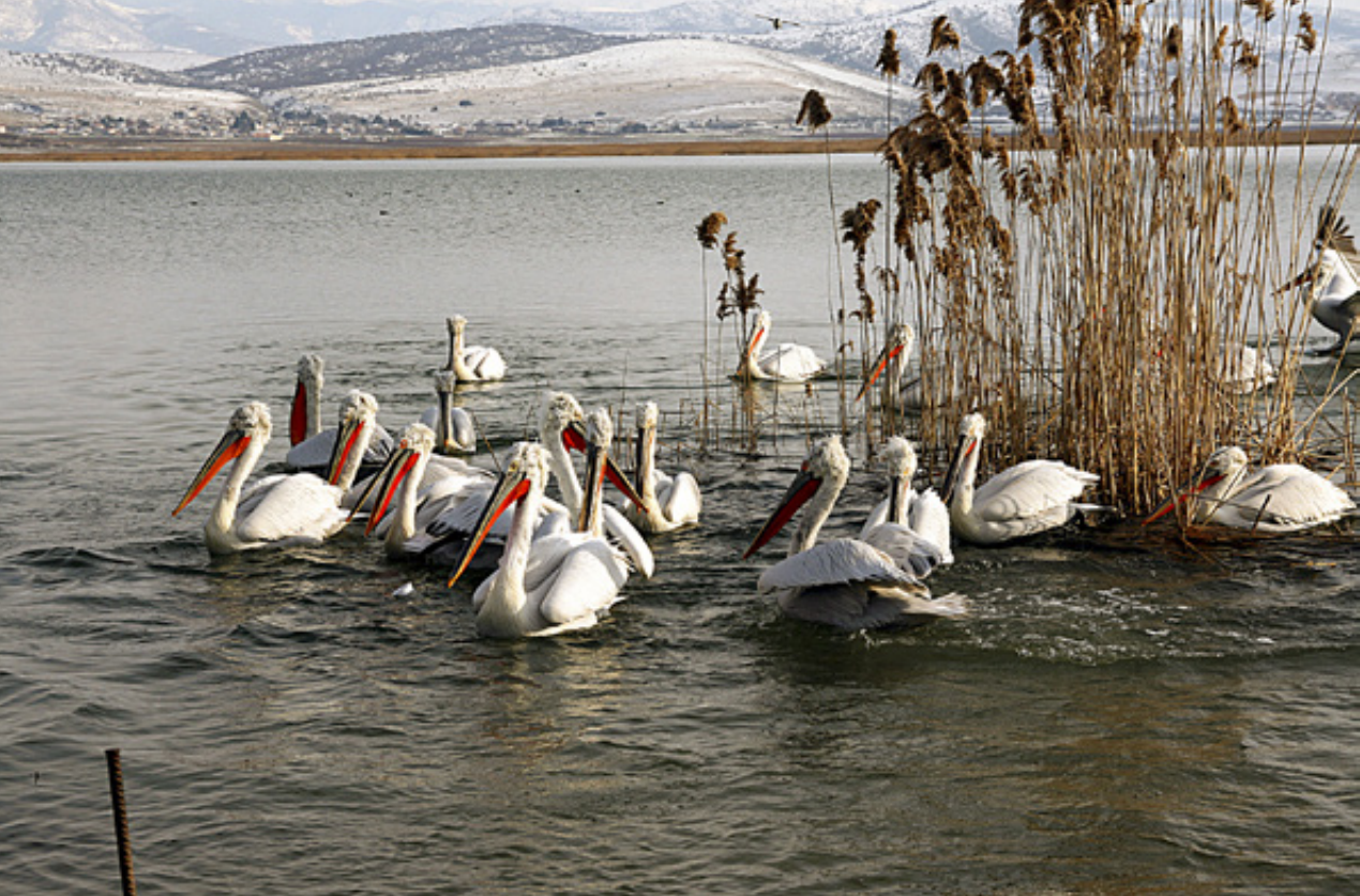
Λίμνη Βεγορίτιδα. Οι αργυροπελεκάνοι όχι μόνον έχουν συνηθίσει αλλά και αποζητούν την παρέα των ψαράδων, με το αζημείωτο, φυσικά.