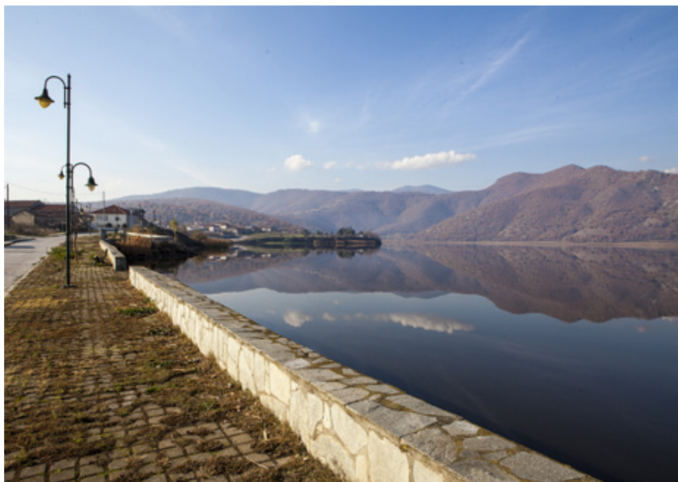
Γραφικό τμήμα της ακρολιμνιάς στην Ζάζαρη και πλωτή προβλήτα με ήμερες φαλαγίδες στην Χειμαδίτιδα.