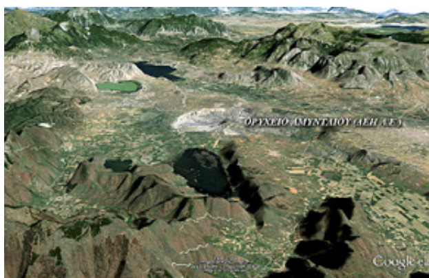
Η λεκάνη του Αμυνταίου

Οι πρώτοι χερσαίοι οικισμοί δημιουργήθηκαν στο λεκανοπέδιο Αμυνταίου γύρω στο 6.500 π. Χ . Ήταν σχετικά μικροί σε έκταση και προς το τέλος της 7 ης χιλιετίας περιβάλλονταν από ρηχή τάφρο. Οι κατοικίες τους αρχικά ήταν κυκλικές και σκαμμένες εν μέρει κάτω από το έδαφος, ενώ αργότερα ήταν επίγειες κατασκευασμένες από πασσάλους, δοκάρια και πλέγμα επενδυμένο με αχυροππλό. Αργότερα, στο άμισό της 6 ης χιλιετίας, ο οικιστικός χώρος οριοθετούνταν από επάλλπες βαθιές τάφρους, ενώ τα οικήματα έγιναν επίγεια ή υπερυψωμένα, ήταν μονόχωρα και είχαν τετράγωνη κάτοψη. Σε ένα από τα σπίτια αυτά διαπιστώθηκε μετά από 8.000 χρόνια η πρωιμότερη γνωστή ανθρώπινη τραγωδία, όπου 3 από τα ενήλικα μέλη μιας οικογένειας βρήκαν φρικτό θάνατο από πυρκαγιά, όταν εγκλωβίστηκαν μετά την εκδήλωσή της στον πρώτο όροφο. Οι συχνές κατα-