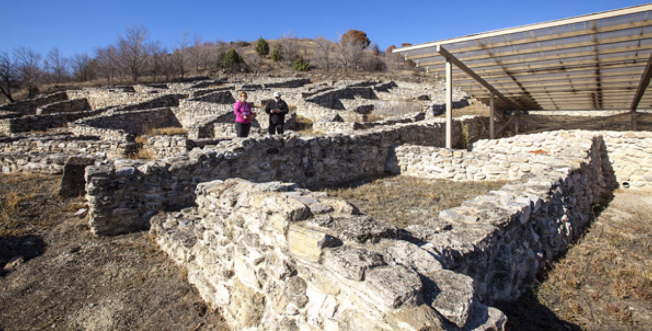
Τμήμα της πυκνοκατοικημένης και άριστα αναπλασμένης ελληνιστικής πόλης των Πετρών. (Επάνω) Μεγάλα πήλινα πιθάρια με εγχάρακτη διακοσμητική ταινία, που διατηρούνται στην κορυφή του λόφου.

του σιδήρου. Η επόμενη φάση στα κλασικά χρόνια, ενώ παρατηρείται συνεχής κατοίκηση του χώρου από τον 4 ο ως τον 1 ο αι. π.Χ. Ο Φίλιππος Β΄ πιθανότατα ίδρυσε την πόλη με σκοπό τον έλεγχο των συνόρων και την ενοποίηση των τοπικών φυλετικών ομάδων. Η περίοδος μετά τα μέσα του 2 ου αι. π.Χ. συμπίπτει με την ακμή της πόλης, γεγονός που σχετίζεται με τη διέλευση της Εγνατίας οδού από την περιοχή. Η κατασκευή της Εγνατίας οδού 130-120 π.Χ. από τον ανθύπατο Γάιο Εγνάτιο , η οποία συνέδεε τη δύση με την ανατολή, ξεκινούσε από τη Ρώμη, έφθανε Δυρράχιο και από εκεί Βυζάντιο, βοήθησε ώστε να αναπτυχθούν οικονομικά πολλές περιοχές από τις οποίες διερχόταν. Ανάμεσα σε αυτές ήταν και περιοχές της Άνω και Κάτω Μακεδονίας, όπως ο οικισμός των Πετρών που γνωρίζει ιδιαίτερη άνθηση αυτή την περίοδο. Η καταστροφή της πό-