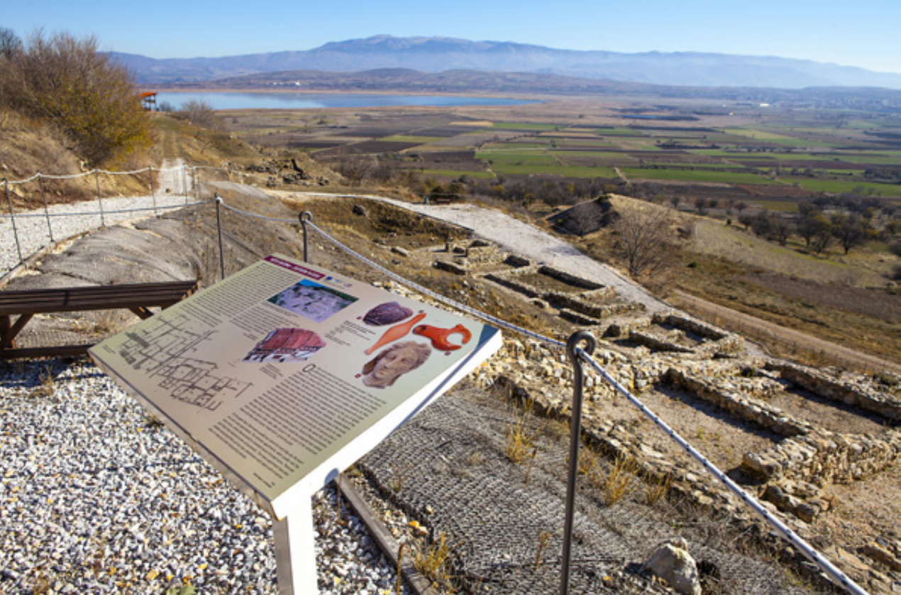
Ενημερωτικές πινακίδες στον αρχαιολογικό χώρο των Πετρών.