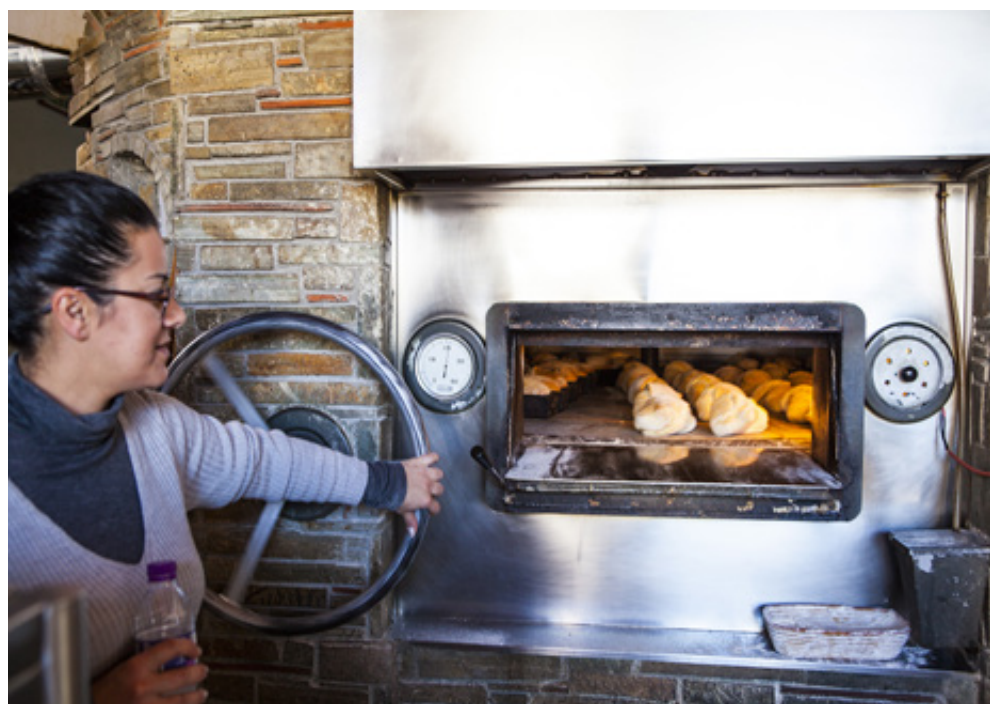
Όψεις Αμυνταίου. Παραδοσιακός ξυλόφουρνος και κτίριο εξαιρετικής αρχιτεκτονικής.