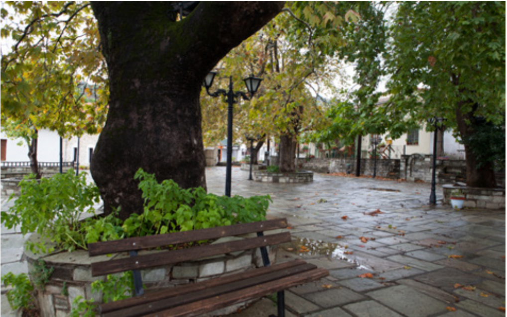
Ένα τμήμα της πλακόστρωτης και πλατανοσκέπαστης “Πλατείας Αγάπης”, των Αφετών. Ο ζωγραφισμένος γυναικωνίτης στο εσωτερικό του ναού. (Δεξιά)

-Στα τόσα περπατήματά σας στο Πήλιο, έχετε ποτέ διασχίσει κάποιος φαράγγι;