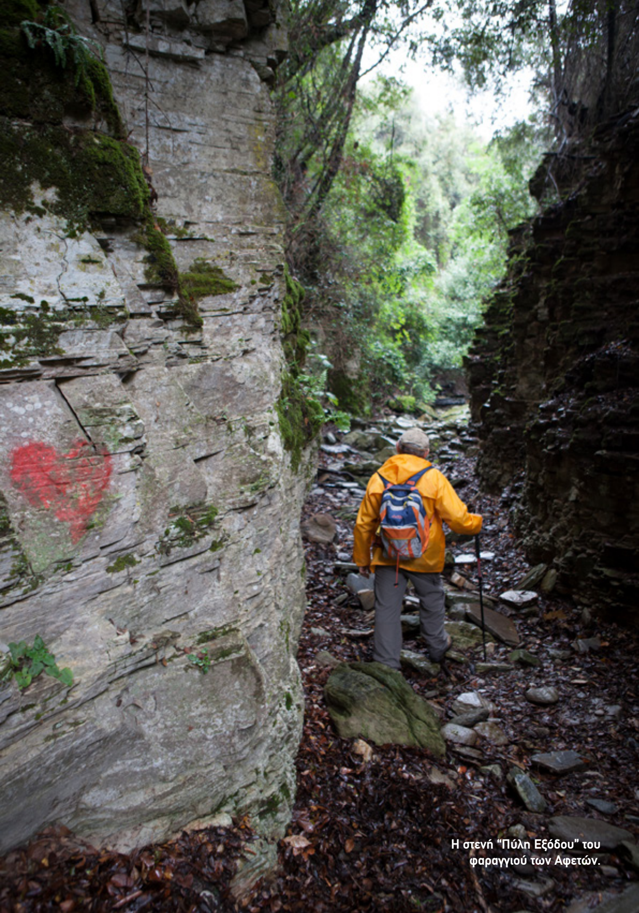
Η στενή "Πύλη Εξόδου" του φαραγγιού των Αφετών.