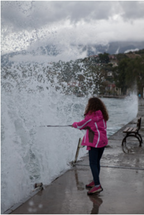
Παραλία Αφήσου. Στο έλεος των κυμάτων του γαρμπί.

λευταίο έδωσε λαβή σε κάποιους ερευνητές, με πρώτο τον Ν. Γεωργιάδη, να υποθέσουν πως εδώ βρισκόταν η αρχαία κώμη Αφέτες , απ' την οποία πήρε το όνομά του και το γειτονικό χωριό των Αφειτών. Διαβάζοντας όμως τους αρχαίους συγγραφείς (Ηρόδοτο, Πλούταρχο και Διόδωρο Σικελιώτη), θα πρέπει να αναζητήσουμε μάλλον στο Νότιο Πήλιο τις Αφέτες και κυρίως από την έξω πλευρά του Παγασητικού, πιθανόν στον Πλατανιά. Μάλιστα, γνωστοί αρχαιολόγοι, όπως ο Kirsten και ο Wace, βασισμένοι στο σχετικό χωριό του Ηροδότου, τοποθετούν με σιγουριά τις αρχαίες Αφέτες στο καλό κι ασφαλές λιμάνι του Πλατανιά» (4) . 14:20 Από την πηγή της Αφήσου ξεκινάμε (χωρίς σήμα) το πλακόστρωτο δρομάκι αριστερά. Στο HOTEL «ΚΑΤΙΑ», λίγο πιο