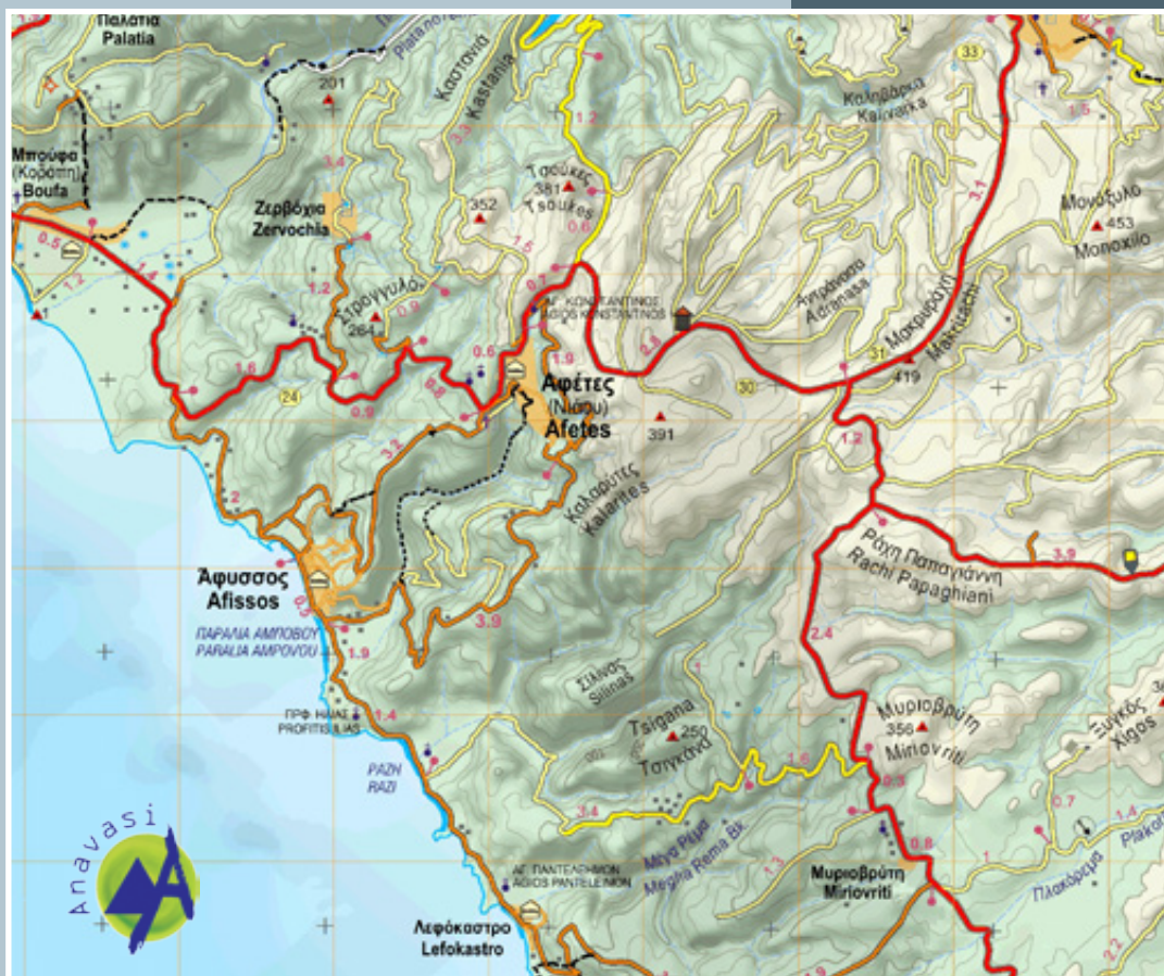
Τμήμα από τον χάρτη Νότιο Πήλιο 1:50.000 των εκδόσεων ΑΝΑΒΑΣΗ. www.anavasi.gr