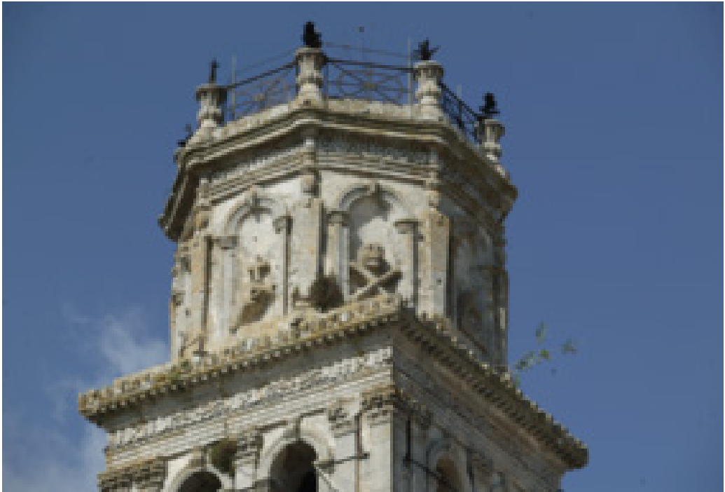
Το ανώτερο τμήμα του περίφημο 5ώροφου καμπαναριού στο "Κοιλωμένο", με τις εκπληκτικές ανάγλυφες - συμβολικές του παραστάσεις.