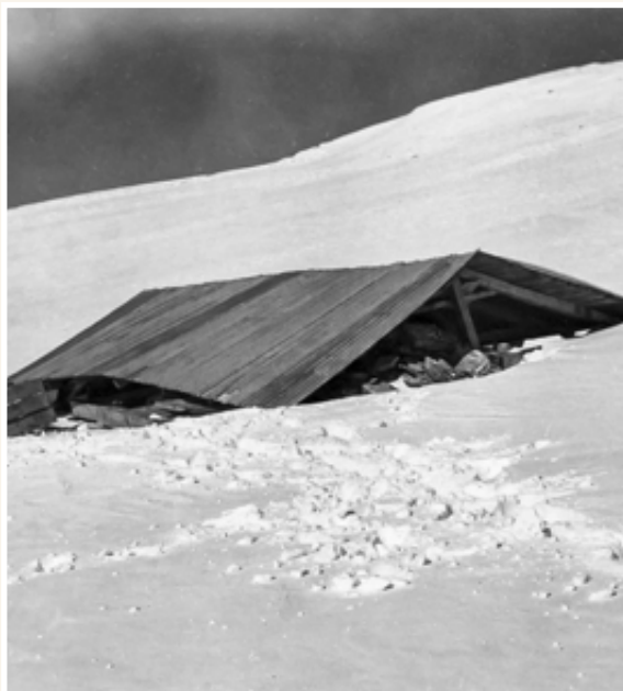
Η ανατιναγμένη ορειβατική καλύβα στο οροπέδιο των Μουσών. Οκτώβριος 1959.