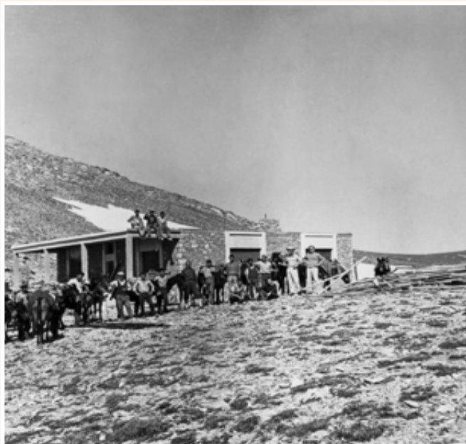
Το κτίσιμο του ισογείου του καταφυγίου του Ολύμπου έχει ολοκληρωθεί με τη συμμετοχή των εικονιζόμενων.

Το Καταφύγιο πήρε το όνομα του πρωτομάστορα της ανέγερσής του, Γιώσου Αποστολίδη. Είχε προηγηθεί ο τραγικός θάνατός του στο ατύχημα που συνέβη το Πάσχα του 1964 . Τότε, μετά την ανάβαση στην χιονισμένη κορυφή του Μύτικα, και κατά την διάρκεια της επιστροφής, κατακρημνίσθηκε στο «Λούκι» η τετραμελής σχοινοσυντροφιά για εκατοντάδες μέτρα, με μοναδικό άτυχο τον Γιώσο.