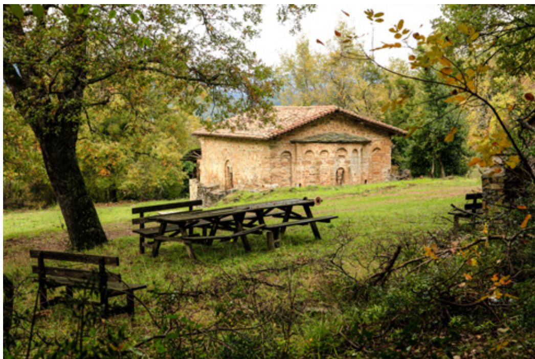
Το εκκλησάκι της Παναγίας, κτίσμα του 16ου αιώνα. Μια έξοχη πέτρινη παρουσία στο σκηνικό της φύσης.

ξέφωτου είναι κυριολεκτικά ανασκαμμένο από γουρούνια. Κάτω από την προστατευτική ομπρέλλα μιας θεόρατης βαλανιδιάς διαγράφεται το λιτό περίγραμμα του ναού της Κοίμησης Θεοτόκου . Χρονολογικά ανήκει στο Β μισό του 16 ου αιώνα και συγκεκριμένα στο έτος 1558 . Η καλή τοικοποιΐα έχει δεχθεί αρκετές σύγχρονες αποκαταστάσεις. Σε ανάγλυφη επιγραφή στην εξωτερική κόγχη του ιερού αναγράφεται η ημερομηνία Αύγουστος 18 1805 , μεταγενέστερη, προφανώς, της κτίσης του ναού.