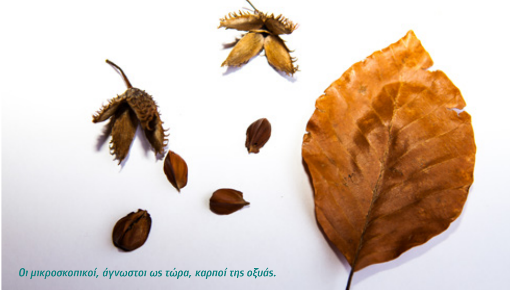
Οι μικροσκοπικοί, άγνωστοι ως τώρα, καρποί της οξυάς.

Στα 12,9 χλμ. συναντάμε πινακίδα προς « Παρατηρητήριο » Παίρνουμε το μονοπάτι μέσα στο δρυοδάσος, με κατεύθυνση Α-ΒΑ (75°). Τρία λεπτά μετά φτάνουμε στο σπιτάκι του Παρατηρητηρίου. Είναι μισοερειπωμένο από τα μέσα της δεκαετίας του '90. Εδώ το υψόμετρο είναι 740 μέτρα και η θέα είναι άμεση προς το Πήλιο, Κίσαβο και Μαυροβούνι (3). Στις αρχές του Γενάρη μάς ζεσταίνει ένας ήλιος εκπληκτικός. Την ίδια ώρα στην περιοχή της Αθήνας πέφτει χιόνι.