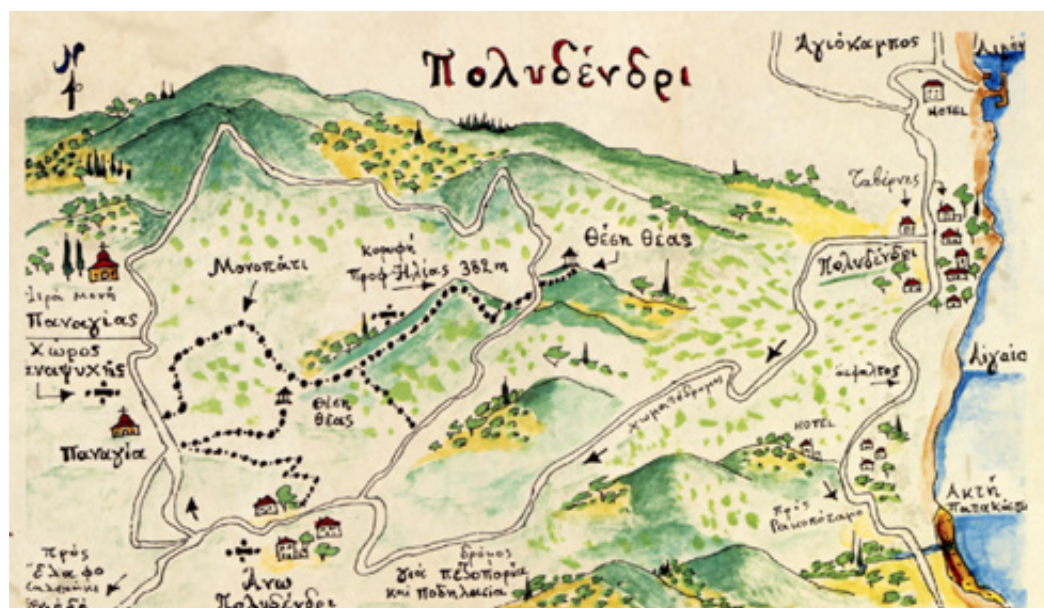
Χειροποίητος χάρτης της περιοχής του Πολυδενδρίου από τον καλλιτέχνη - χαρτογράφο Χάρη Τζήκα.

Στα 15,2χλμ συναντάμε δίπλα μας την ολοζώντανη ροή του ρέματος Γριβενής και 200 μέτρα μετά, το διασχίζουμε, εύκολα σχετικά. Δυσκολότερα περνάμε, στα 18,5 χλμ. το πιο ορμητικό και βαθύ ρέμα Βέλλας , που αποτελεί βασικό τροφοδότη του περίφημου Ρακοπόταμου.