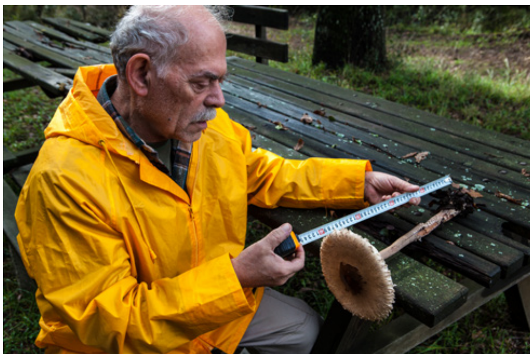
Macrolepiota procera . Διάμετρος καπέλου 20 και ύψος μίσχου 40 εκατοστά.

όμως υπάρχει μια σιδερένια μπάρα κλειδωμένη με λουκέτο. Είναι τοποθετημένη από το Δασαρχείο Αγιάς, για να εμποδίζει τη διέλευση των οχημάτων λαθρουλοτόμων και λαθροκυννηγών. Συνεχίζουμε ανηφορικά αριστερά και 400 μέτρα μετά (7.2 χλμ από την αρχή της διαδρομής) φτάνουμε σ' έναν τόπο εκπληκτικό. Είναι το ωραιότερο ξέφωτο της εκκλησίας της Παναγίας με χάρτη, τραπεζοκαθίσματα και γρασίδι. Εδώ βρίσκουμε, επιτέλους, το πρώτο μας μανιτάρι. Είναι μια τρυφερότατη Macrolepiota procera , με διαστάσεις εντυπωσιακές: Μίσχο ύψους 40 εκ. και διάμετρο καπέλου 20 εκατοστά! Δυστυχώς, όσο κι αν ψάχνουμε τριγύρω, δεν καταφέρνουμε να εντοπίσουμε την υπόλοιπη οικογένεια.