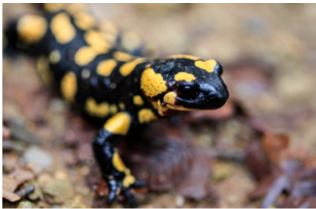
Η σαλαμάντρα με το στιλπνό της δέρμα και τους ζωηρούς χρωματισμούς.

Ξεκινάμε την περιήγησή μας στον δασικό ποδηλατόδρομο προς τα δεξιά, με κατεύθυνση ΒΑ. 200 μέτρα μετά ( 3,5 χλμ. από την αρχή της διαδρομής) συναντάμε αριστερά μονοπάτι με ξύλινα παγκάκια και πινακίδα προς Παναγία , μήκους 1.500 μέτρων. Στα 4,5 χλμ. φεύγει ένα νέο μονοπάτι αριστερά προς Παναγία ,