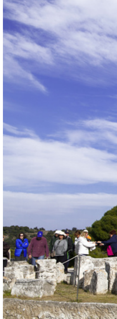
(9) Ελληνικό Πανόραμα, τεύχος 20, Μαρτ. 2001