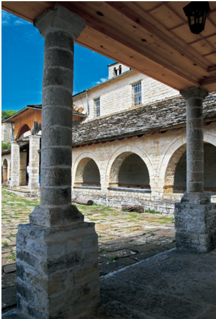
Το επιβλητικό καμπαναριό και τμήμα της εκκλησίας της Κοίμησης της Θεοτόκου.

Η πλατεία είναι πλακόστρωτη και πανέμορφη. Στο κέντρο της επιβάλλεται ένας πλάτανος, που η πιθανότερη χρονολογία της