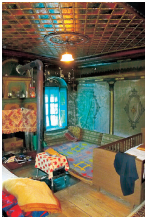
Στο σπίτι της κυρίας Κθειώς εντυπωσιάζουν τα ξυλόγλυπτα ταβάνια, τα παραδοσιακά έπιπλα και η άριστη κατάσταση διατήρησης.

1963. Δίπλα είναι η αποθηκούλα, με αθέατη στο δάπεδό της την "γκλαβανή", την είσοδο δηλαδή της καταπακτής που οδηγεί στο κατώι. Με εσωτερική σκάλα που διατηρείται σε άριστη κατάσταση οδηγούμαστε στο "νοντά", ένα εκπληκτικό δωμάτιο με έξοχη ξυλόγλυπτη οροφή, περίτεχνο τζάκι και τοίχους κατάγραφους από Χιονιαδίτες ζωγράφους το 1885, όπως αναφέρεται στη σχετική επιγραφή.