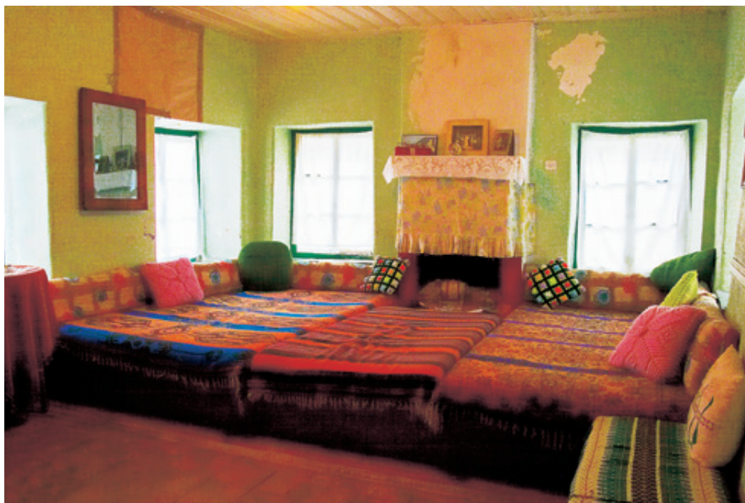
Παραδοσιακά μπάσια, ευρύχωρο δωμάτιο και αέρας παλιού αρχοντικού.

2000 οκάδων για το κρασί της οικογένειας. Υπάρχουν επίσης πολλά παλιά αντικείμενα και σκευή και ένα ξύλινο αμπάρι, όπου φυλασσόταν το σιτάρι. Στο κάτω μέρος υπάρχουν δυο μικρά ανοίγματα με πορτούλες, που ανοίγοντάς τες η οικογένεια έπαιρνε όση ποσότητα χρειαζόταν. Περνάμε στον δεύτερο όροφο. Εδώ κυριαρχούν τα δυο "μαντζάτα" με τα τζάκια και τα "μπάσια" τους, την θαυμάσια ξύλινη "μισάντρα" για τα βαριά ρούχα της οικογένειας. Διασώζεται το υπέροχο ξυλόγλυπτο ταβάνι και οι ζωγραφισμένοι τοίχοι, ενώ το ξύλινο πάτωμα είναι αυθεντικό. Το σπίτι χτίστηκε το 1880, όπως διαπιστώνουμε από την χαραγμένη χρονολογία στην λαμπίρινα του τζακιού. Μοιάζει σαν να το άγγιξε ελάχιστα ο χρόνος, η κυρία Κλειώ το διατηρεί σε άριστη κατάσταση. Πριν φύγουμε, η καλή κυρούλα δεν παραλείπει να μας κεράσει ένα ποτηράκι εκπληκτικό δικό της τσίπουρο.