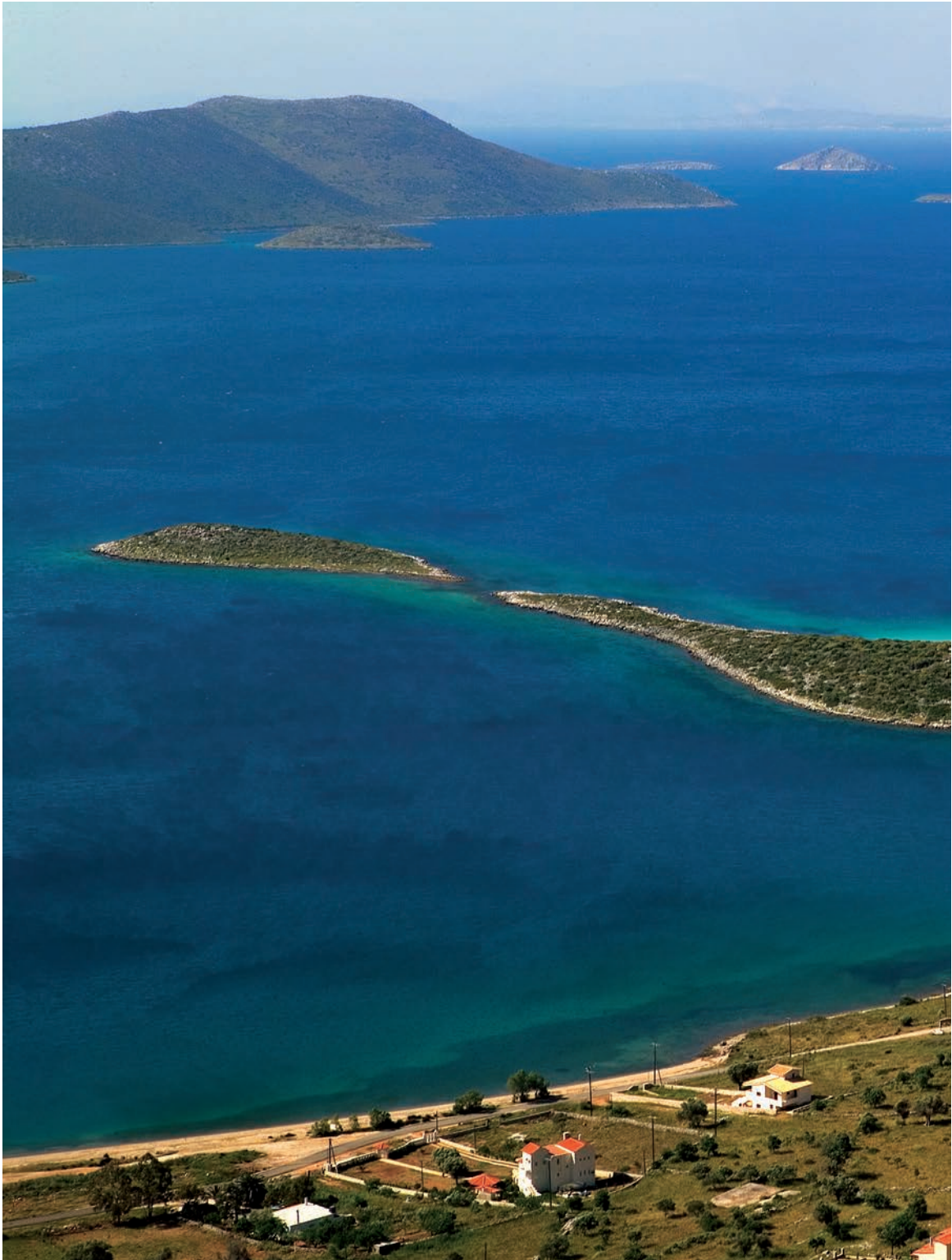
Όρμος Αλμυροπόταμου με τον οικισμό του Αγ. Δημητρίου