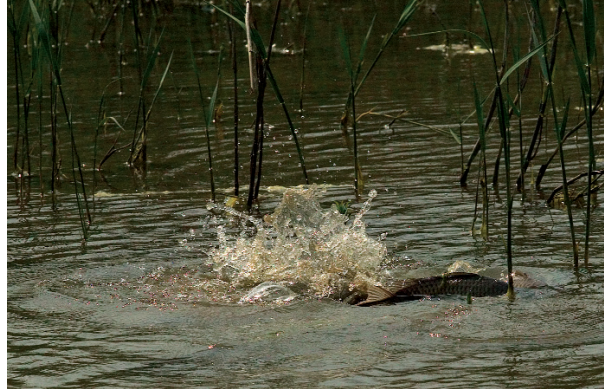
Κυπρίνοι σε αναπαραγωγή στα αβαθή νερά της Λίμνης Δύστου. Τμήμα της ερειπωμένης ακρόπολης στον λόφο του Καστριού.

πρώτες εκατοντάδες μέτρα του δύσβατου δρόμου της ΒΑ πλευράς η λίμνη μας αποκαλύπτει όψεις αθέατες, πολύ συναρπαστικές. Οι πυκνοί καλάμιώνες αφήνουν ανάμεσά τους μεγάλα ανοίγματα με γαλαζωπό νερό. Στην ήρεμη επιφάνειά του καθρεφτίζονται τούφες - τούφες τα καλάμια και μας χαρίζουν εικόνες με θαυμάσιους χρωματικούς τόνους, πράσινους, καφέ και χρυσοκίτρινους.