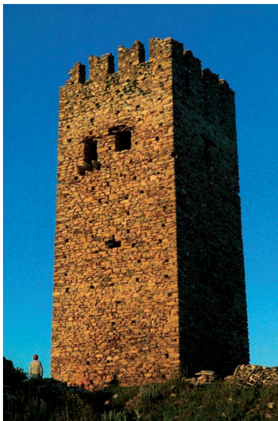
Ο θαυμάσιος διατηρημένος ενετικός πύργος των Βελουσιών ή Κουτουμουλά.