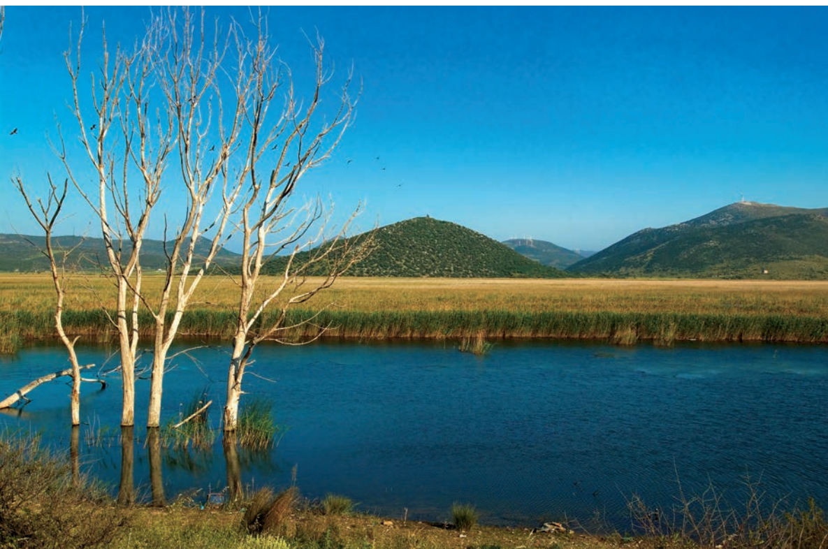
Λίμνη Δύστου. Κορμοράνοι, καλαμιώνες και λόφος του Καστριού. Αμπέλια καλλιεργημένα κατα το γραμμικό σύστημα στον κάμπο του Δύστου. (Δεξιά)

Κάποιος έμπειρος τοπιογράφος θα μπορούσε να βρει εδώ ιδανικά θέματα για την άκρη του χρωστήρα του. Στο βάθος, πέρα από την συμπαγή και επίπεδη επιφάνεια των κορυφών των καλαμιώνων, ορθώνεται ο τριγωνικός λόφος του Καστριού και, μακρύτερα ακόμη, τα περιγράμματα των λόφων, με τις δεκάδες ανεμογεννήτριες που περιστρέφονται αργά στο φύσημα του ανέμου. Να και δυο ψαράδες, στριμωγμένοι σε μια μικρή φουσκωτή βαρκούλα, ανατολικοευρωπαίοι κάτοικοι της περιοχής του Δύστου, όπως προκύπτει από την πινακίδα του αυτοκινήτου τους.