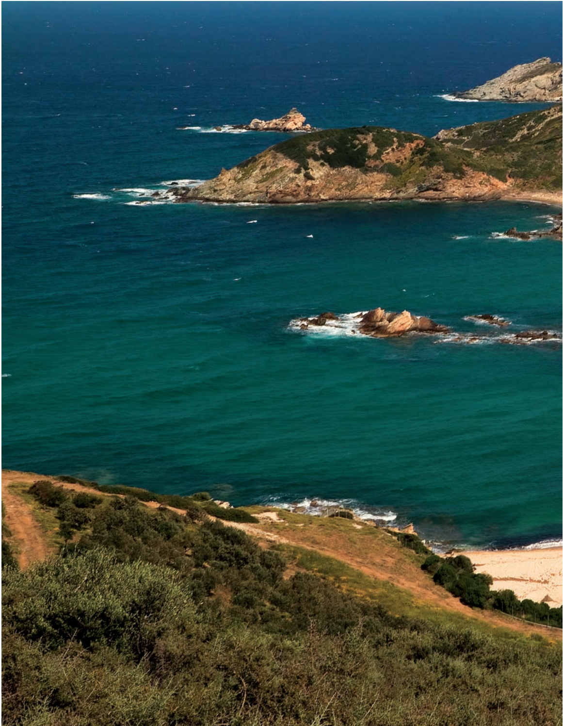
Στόμιο και Χερόμυλος, δύο δίδυμοι κόλποι με νερά απaráμιλλης γοπτείας.