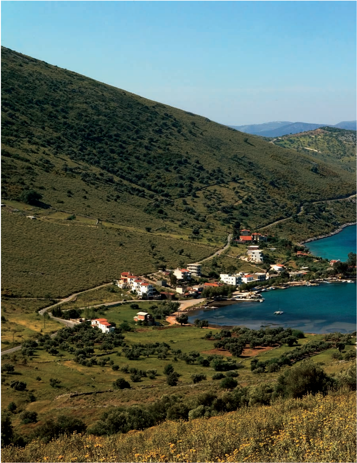
Κόλπος και οικισμός του Πόρτο Μπούφαλο.