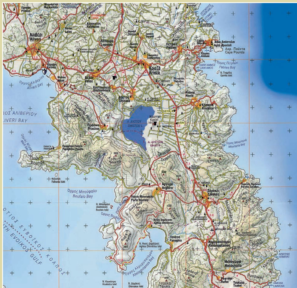
Τμήμα χάρτη “ΝΟΤΙΑ ΕΥΒΟΙΑ” 1 : 100.000 των εκδόσεων ΑΝΑΒΑΣΗ