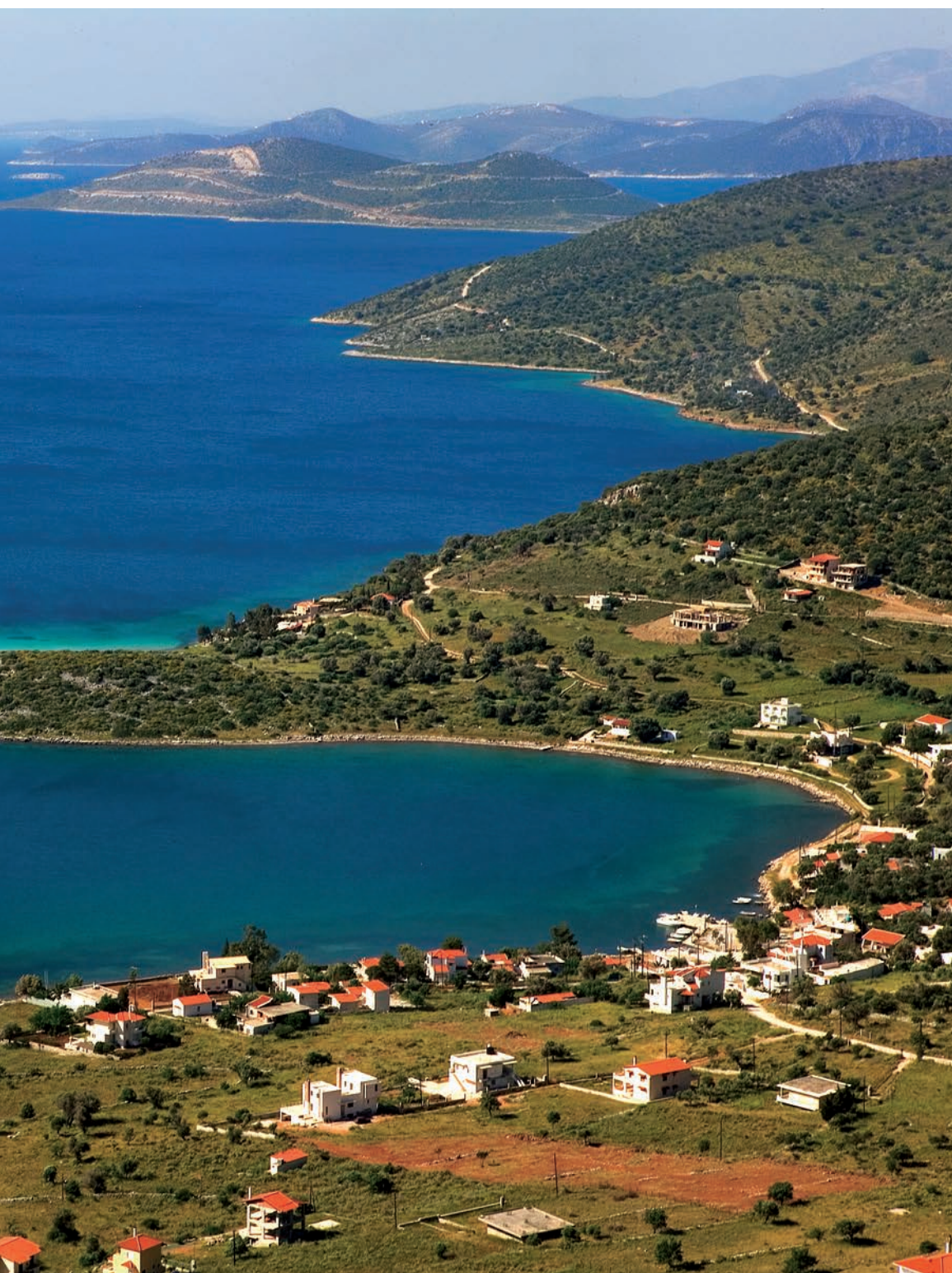
Ο Ευβοϊκός στις ωραιότερες στιγμές του.