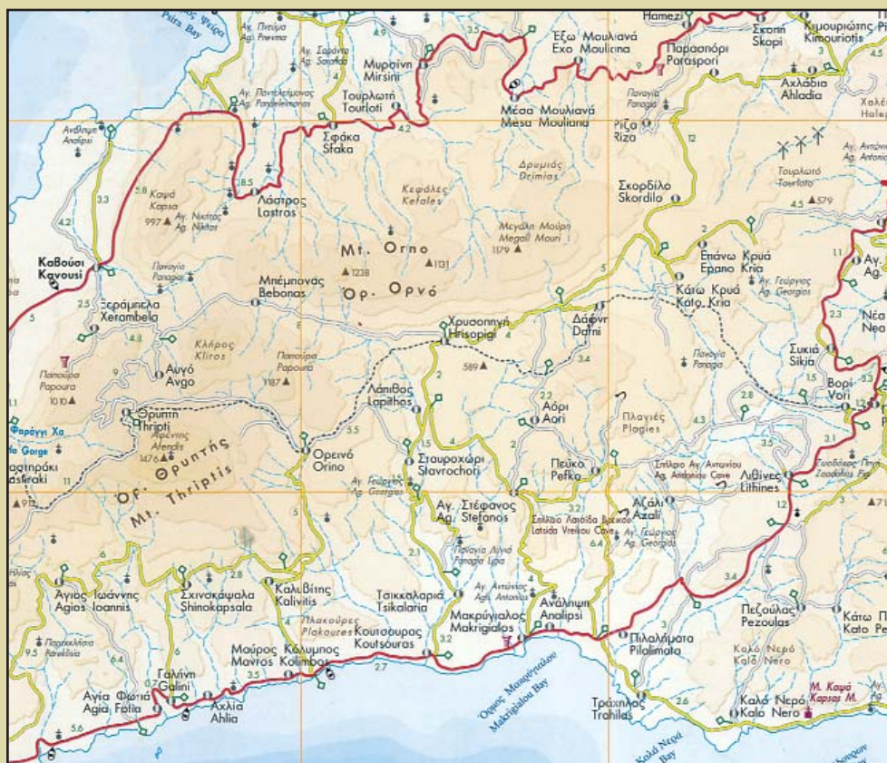
Τμήμα από τον χάρτη ΚΡΗΤΗ 1 : 125 000 των εκδόσεων Leadercom