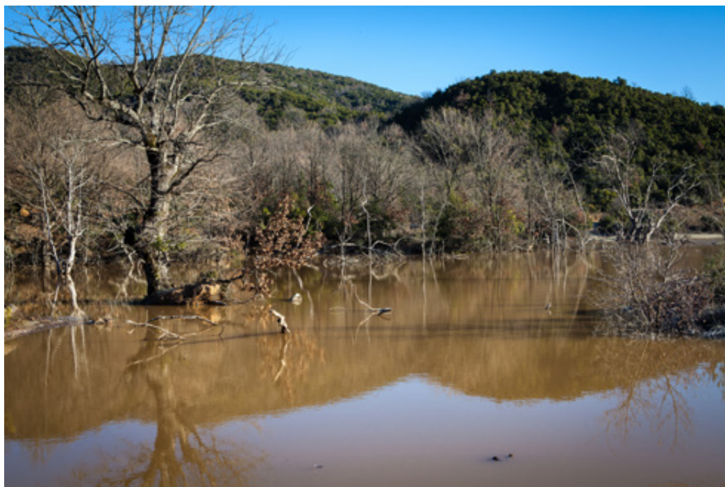
Η πλημμυρισμένη τεχνητή λιμνούλα με τα θολά νερά από τις δυνατές βροχές.

αιώνα από τον αυτοκράτορα Ιουστινιανό , με σκοπό να προστατεύσει τους πληθυσμούς της περιοχής.