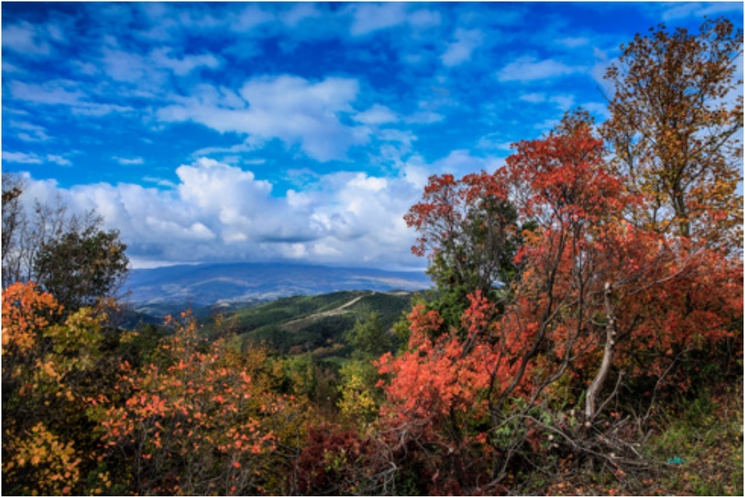
Αριστερά: Ξωκκλήσι Προφητηλία πάνω από τη Σκήτη. Επάνω: Η απίστευτη φθινοπωρινή φύση στο Μαυροβούνι. Κάτω: Εισχωρώντας ανάμεσα στις ήρεμες κασικούλες.