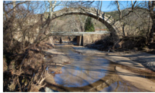
Το επιβλητικό γεφύρι του Αλαμάνου, μεταξύ Σκήτης και Αγιάς.

Δυστυχώς, με τις έντονες βροχοπτώσεις των τελευταίων ημερών, έχουν παρασυρθεί μεγάλες ποσότητες χωμάτων, με αποτέλεσμα το νερό της λίμνης να είναι καφετίρινο και θολό.