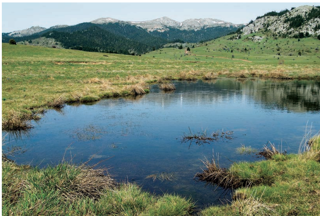
Μικρές λιμνούλες στα οροπέδια της Οίτης σε υψόμετρο 1600 περίπου μέτρων.

κομμάτια επιγραφής παραπέμπουν, κατά τον αρχαιολόγο, στα «Οιτέα Ηρακλεία», γιορτές δηλαδή προς τιμήν του Ηρακλέους. Βρέθηκαν επίσης αφιερώματα πήλινα και μεταλλικά, αιχμές από δόρατα, μαχαίρια, κοσμήματα, δυο χάλκινα αγαλμάτια που παριστάνουν γυμνό τον Ηρακλή και 13 συνολικά νομίσματα Αιτωλών, Αινιανών-Λαμιέων και Οιταίων. Το μνημείο χρονολογήθηκε στον 3ο αι. π.Χ. ενώ οι στάχτες της πυράς θεωρούνται προγενέστερες του 6ου αι. π.Χ.