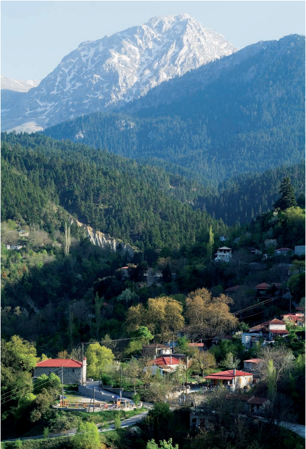
Ψηλά η Πυραμίδα της Γκιώνας. Στους πρόποδες η Στρώμη.