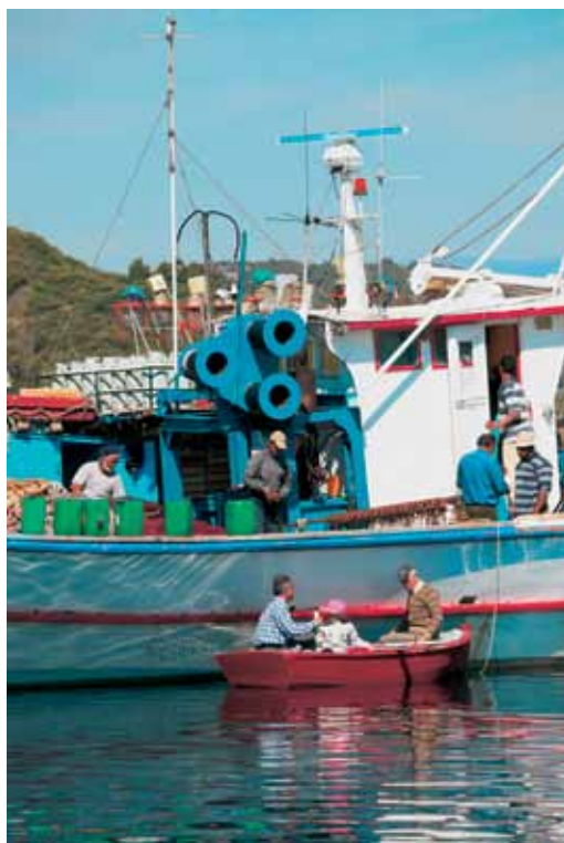
Εικόνες και στιγμές από το πανέμορφο φυσικό λιμανάκι των Γιάφτρων με τον μύλο στο ακρωτήριο.