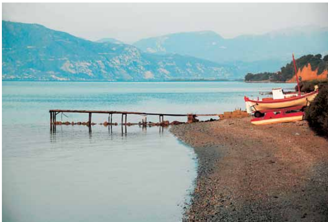
Γραφικός ορμίσκος στην εκτεταμένη παραλία του Αγ. Νικολάου.

Παρατηρώ στο χάρτη τη μακρόστενη, κορμωστασιά της Εύβοιας, ξαπλωμένη νωχελικά ανάμεσα στον Ευβοϊκό και στο Αιγαίο. Οι ακτές της είναι προνομιούχες, δέχονται θωπεύματα από δύο θάλασσες, με τόσο διαφορετικό χαρακτήρα μεταξύ τους. Περίκλειστος και εσωστρεφής ο Ευβοϊκός, συνήθως γαλήνιος και ατάραχος, με σπάνια ξεσπάσματα. Γεμάτο ορμή και ζωντάνια το Αιγαίο, απρόβλεπτο και ατίθασο, πάντα έτοιμο να χάσει την ηρεμία του με τις πρώτες πνοές του λεβάντε και του γραΐγου.