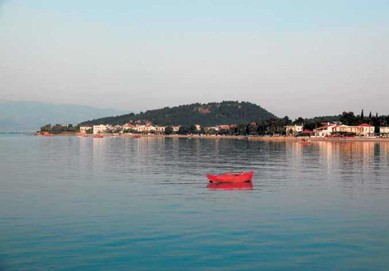
Τμήμα από τον παραθαλάσσιο οικισμό του Αγ. Γεωργίου, επίγειο της γραφικής και κατάφυτης Λιχάδας.