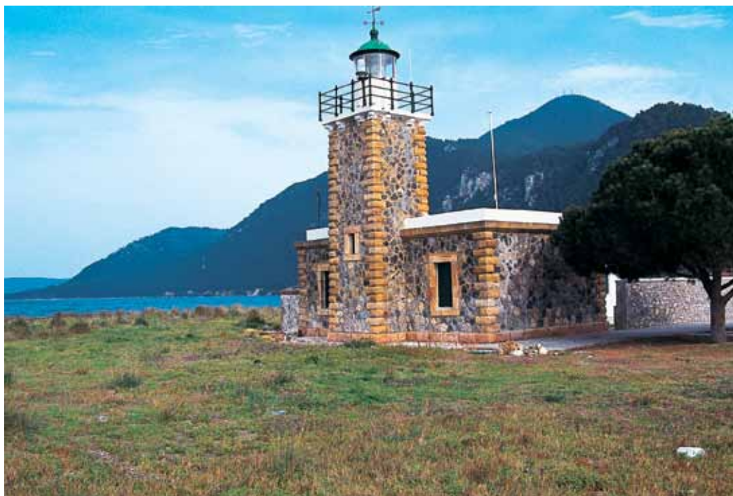
Το καταπληκτικής κατασκευής πετρόχτιστο οικοδόμημα του Φάρου της Βασιλίνας στο ομώνυμο ακρωτήριο.