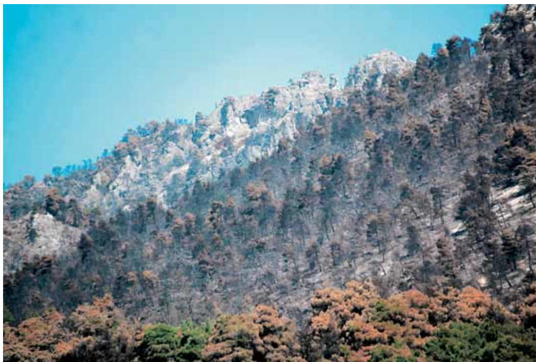
Εικόνες καταστροφής και συμφοράς. "Αφιερώνονται" στους καταστροφέις της Ελληνικής φύσης.

οροπέδιο επιλέγουμε την ΒΔ κατεύθυνση προς τ' αριστερά. Ο δρόμος είναι υπέροχος, το μαλακό του όμως χώμα πρέπει να λαισπώνει πολύ κατά την βροχερή περίοδο. Όπως σ' όλο τον ορεινό όγκο, έτσι κι εδώ οι κορμοί των περισσότερων πεύκων είναι χαραγμένοι και οι σακκούλες που κρέμονται είναι γεμάτες με ρετσίνι. Κατηφορίζουμε συνεχώς. Συναντάμε ποτίστρα με δροσερό νερό και ωραία ρεματιά με πλατάνια. Πιο κάτω αποκαλύπτεται νέο πανέμορφο οροπέδιο, αυτή τη φορά κάτω από τις απότομες δασωμένες πλαγιές του Προφητηλία.