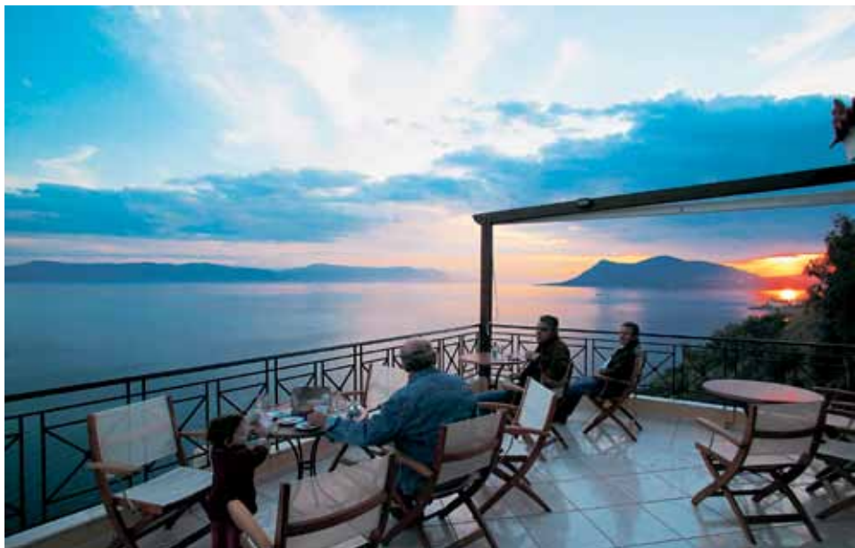
Ηλιοβασίλεμα από το μπαλκόνι του καφέ - εστιατόριο "ΑΓΕΡΙ". Στο βάθος ο όγκος της Χερσονήσου της Λιχάδας.

Η περιήγηση σήμερα είναι αφιερωμένη στο εσωτερικό της χερσονήσου. Ξαναπαίρνουμε την τόσο απολαυστική παράκτια διαδρομή προς τα Γιάλτρα και τον Αγ. Γεώργιο. Στην Κοινότητα της Λιχάδας σταματάμε για ένα καφεδάκι. Μικρός και συμπαθητικός οικισμός, χτισμένος αμφιθεατρικά στους ΝΔ πρόποδες του Προφητηλίου, με δέντρα, λουλούδια και αρκετά πέτρινα σπίτια. Οι διάσπαρτες μεγάλες μουριές υποδηλώνουν την ύπαρξη σηροτοφίας, που άνθιζε μέχρι τη δεκαετία του '50.