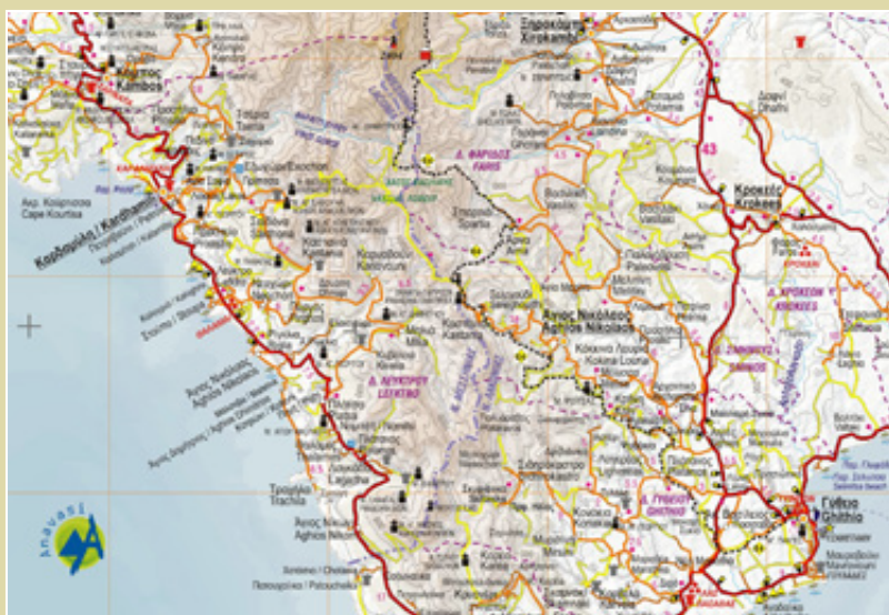
Τμήμα χάρτη Πελοπόννησος, 1 : 250.000 των εκδ. Ανάβαση.