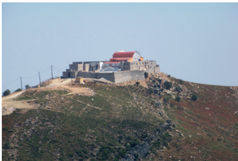
Το κάστρο μοναστήρι της Παναγίας Γιάτρισας.

Από τότε που το κατάλαβα, άνοιγα τους χάρτες των ονείρων και έτσι απλά, δίχως διάθεση κατάκτησης και “γνώσης”, μάθαινα, βαδίζοντας αργά-αργά στα υπέροχα χνάρια του, βυθιζόμενος στο όνειρο της αίσθησης και της μαγείας.